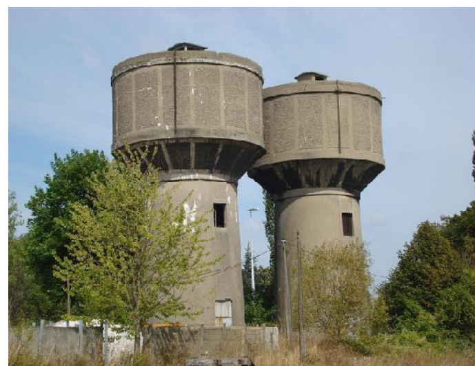
Un type de châteaux d'eau

Il s'agissait au départ de 15 mini-systèmes d'adduction d'eau potable à réaliser dans des quartiers périphériques de la ville. Mais les débits obtenus au terme de la phase de foration en fin d'année dernière ont fait modifier les données du projet initial et le financement y relatif. En exemple, à Lankouvi, au nord de Lomé, la foration a atteint une profondeur de 172 mètres, avec un débit de 40. A Fidokpui, l'eau a été recherchée à 120 mètres, avec un débit de 70. A Dabarakondji, le sol a été foré jusqu'à 302,5, avec un débit d'eau de 70 mètres cubes par heure. « Initialement, il était prévu des mini-systèmes d'adduction d'eau potable. Maintenant, compte tenu des nouvelles données, il faut réfléchir à l'amélioration du projet pour que la plupart des personnes aient accès à l'eau potable », avait-on précisé à Agetur-Togo. « Il faut chercher des moyens financiers pour pouvoir desservir plus de quartiers. Je crois que le gouvernement s'y emploiera. Les châteaux d'eau seront construits dans le cadre du projet initial, mais ils contiendront plus d'eau que prévu. Cela permettra d'étendre les réseaux à d'autres quartiers », avait indiqué le ministre de l'Urbanisme et de l'habitat, Me Fiatouyo Sessénu,