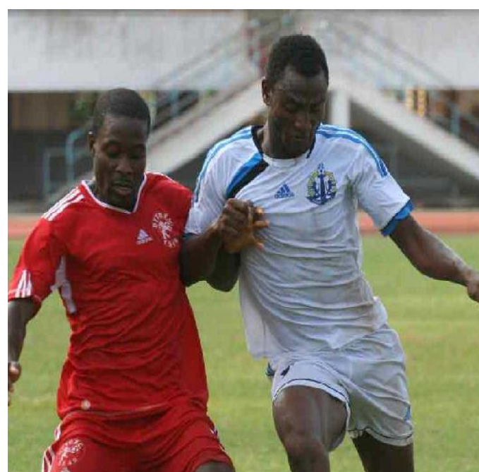
Togo Port v Asko 1-1; Anges v Agaza 0-0; Douanes v Unisport 3-0; Gbikinti v Foadan 3-1; Maranatha v Semassi 1-3; Dyto v Gomido 3-1.