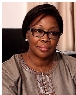
exclusive de ces efforts que le Togo est en train de faire, soutenir les efforts qui consolident le caractère

Dans son intervention de circonstance, elle relève que toutes les institutions qui travaillent avec le Togo constatent ce « progrès » qui font d'ailleurs que la coopération a repris avec ces institutions qui avaient, à un moment donné, suspendu leur coopération bilatérale ou multilatérale avec le pays. Ce qui reste à faire, souligne-t-elle, « c'est de consolider ce qui est fait et renforcer les progrès ». « Renforcer les efforts qui soutiennent et consolident la participation non-