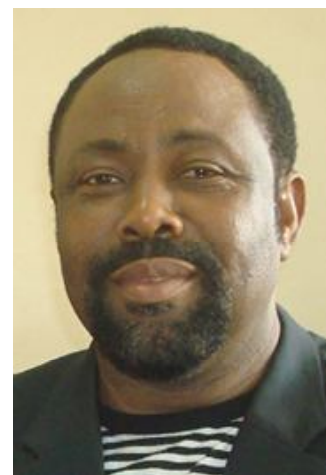
Liges en plus d'autres acteurs majeurs du football national.

Ce dernier document servira de feuille de route à l'équipe FootEthic qui devrait être composée de présidents de Clubs, de présidents de