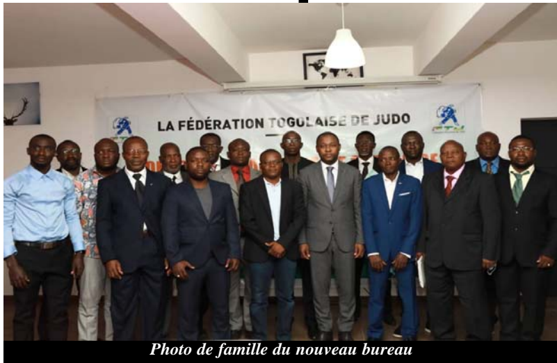
Photo de famille du nouveau bureau

Le Président réélu entend hisser le Judo au 1er rang des disciplines olympiques, redynamiser la direction technique nationale, accentuer la formation des athlètes et encadreurs de Judo, renforcer les activités du projet "Judo à l'Ecole" qui porte des fruits, et faire qualifier plus d'athlètes pour les grandes compétitions internationales et les Jeux Olympiques de Paris 2024. Un accord de partenariat a d'ailleurs été signé en mai 2021 entre la Fédération Togolaise de Judo (FTJ) et la