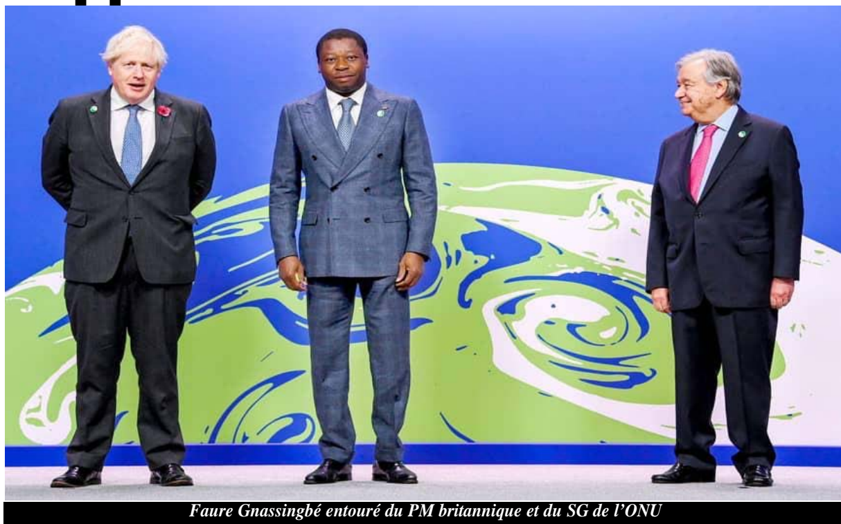
Faure Gnassingbé entouré du PM britannique et du SG de l'ONU

" Le financement de l'adaptation qui est alloué à l'Afrique est nettement insuffisant par rapport aux énormes ressources dont le continent a besoin pour s'adapt-