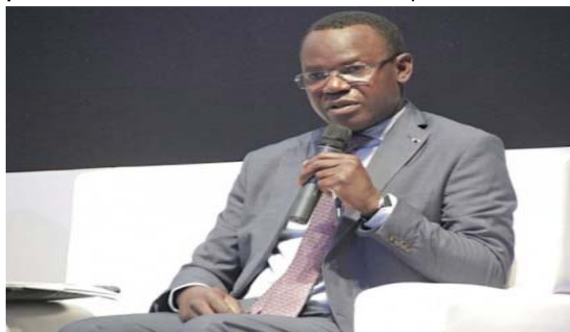
Philippe Kokou Tchodiè, Commissaire Général de l'OTR et président de l'ATAF

Organisé en mode virtuel, cette rencontre de trois jours, a permis aux différents participants de se plancher sur les modèles innovants répondant plus efficacement à la collecte des taxes chez les contribuables.