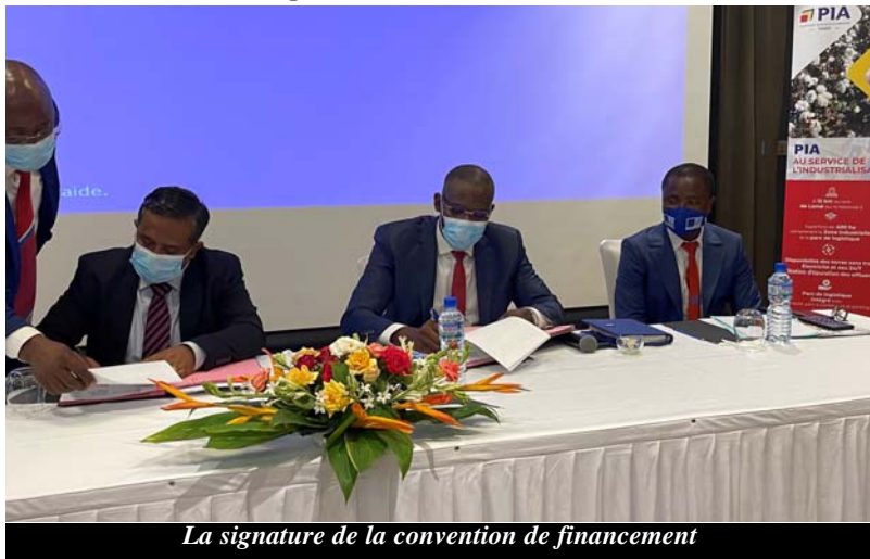
La signature de la convention de financement

Mieux exploiter la nouvelle zone industrielle d'Atédikopé, telle est l'ambition que nourrit CORIS BANK INTERNATIONAL TOGO (CBI TOGO). Une ambition qui s'est concrétisée le 03 novembre dernier par la signature d'une convention de financement de (20) vingt milliards de Francs FCFA entre ladite banque et la Plateforme Industrielle D'Adétikopé (PIA).