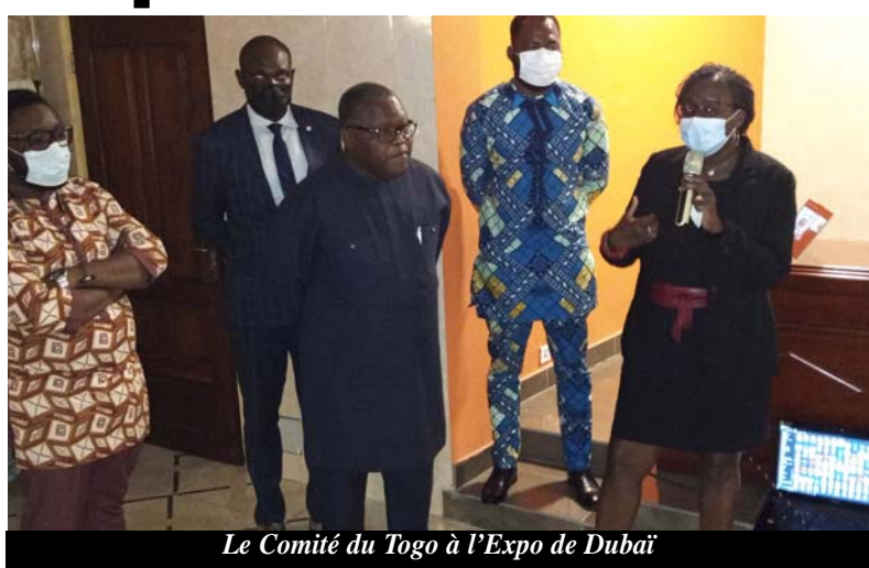
Le Comité du Togo à l'Expo de Dubaï

En prélude à cette journée, le Comité national chargé de l'organisation et de la participation du Togo à cet événement, a initié le vendredi 05 novembre 2021 à l'endroit des participants une séance d'information et de précision sur les intentions des participants aux différentes activités qui sont prévues au cours de cette journée à Dubaï.