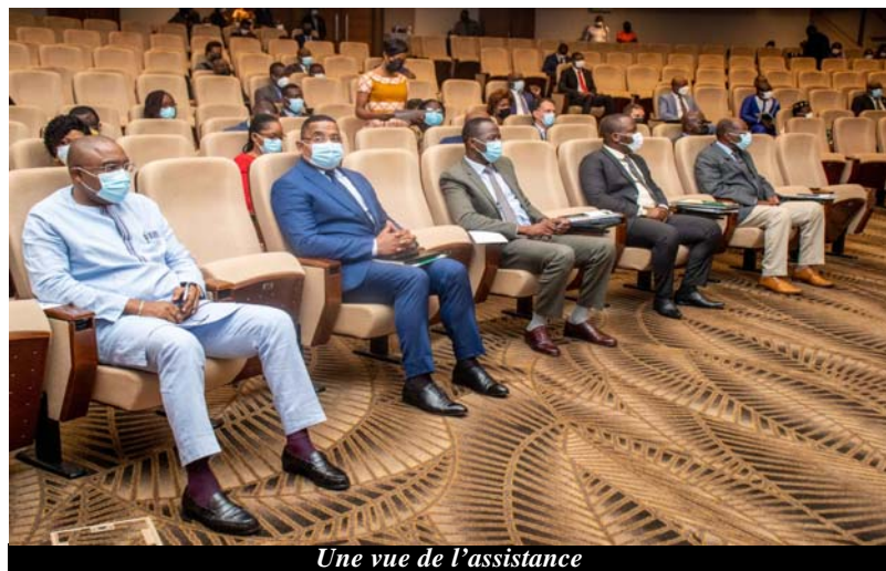
Une vue de l'assistance

Depuis un certain temps, la problématique des importations frauduleuses revient sur les lèvres des Togolais comme un leitmotiv. Les autorités togolaises et le secteur privé se sont fortement engagés pour lutter contre ces pratiques qui constituent un manque à gagner pour l'État. A cet effet, un cadre de concertation a été mis en place dans l'espoir de trouver une solution alternative.