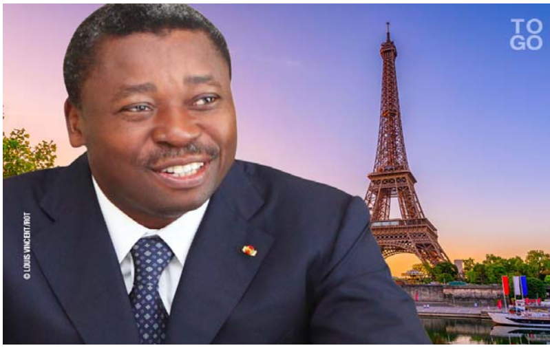
Le Président Faure Gnassingbé

Dans ce domaine, l'inclusion sociale bénéficie d'une allocation d'environ 70 milliards, pour la réalisation d'action dans le domaine de l'emploi des jeunes, de l'amélioration de l'inclusion financière, de la mise en place d'un registre social des personnes et des ménages, de la poursuite des filets sociaux au profit des communautés à la base et de l'accès à l'eau potable.