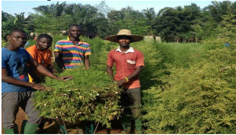
"Herbe Zangara pour paludisme" (+24,9%), plus forte hausse...

La diminution du niveau des indices observée en octobre 2021 est imputable au repli des prix des variétés suivantes : "Maïs séché en grains crus vendu au grand bol" (-14,0%) ; "Mil en grains crus vendu au petit bol" (-8,3%) ; "Sorgho en gains crus vendu au petit bol" (-1,6%) ;