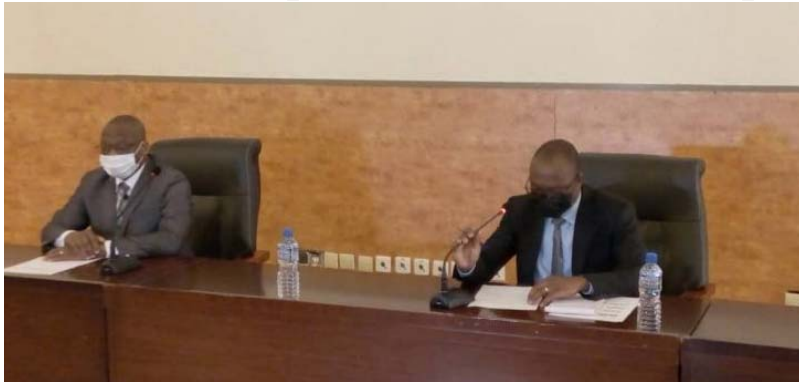
La table lors de la séance de partage de la carte des scores FFY 2022

Des échanges, on retiendra que le Togo a réalisé des avancées significatives, grâce aux ambitieux