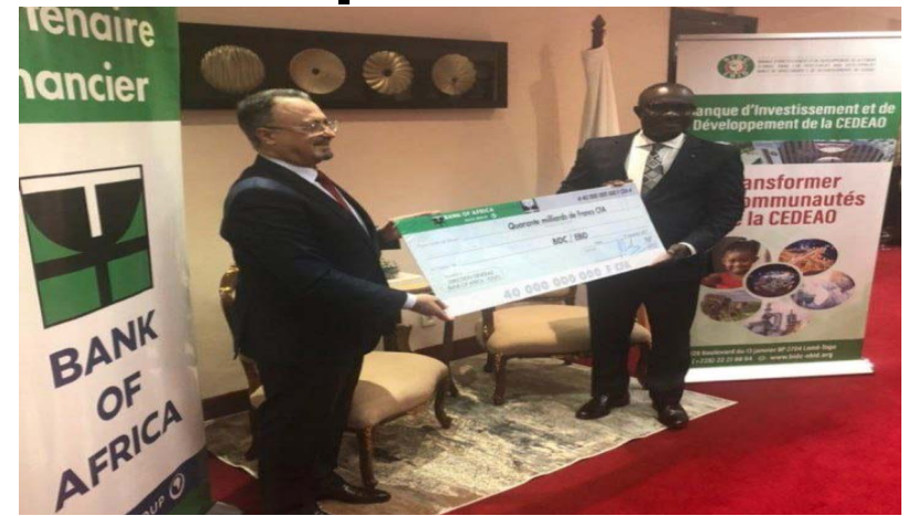
Il faut rappeler que le groupe BOA a enregistré un bilan consolidé de 8,7 milliards d'euros et un résultat net consolidé de 102,7 millions d'euros au 31 décembre 2020. Il est Implanté dans 18 pays africains.