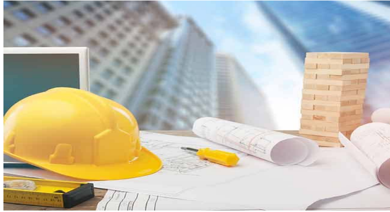
Le génie civil en action

L'activité de la " Construction de bâtiments " enregistre un fort recul au second trimestre de 2021, avec une diminution de 50,1% de son chiffre d'affaires, par rapport au 1er trimestre de 2021. Comparativement au 4ème trimestre de 2020, la baisse du chiffre d'affaires de l'activité