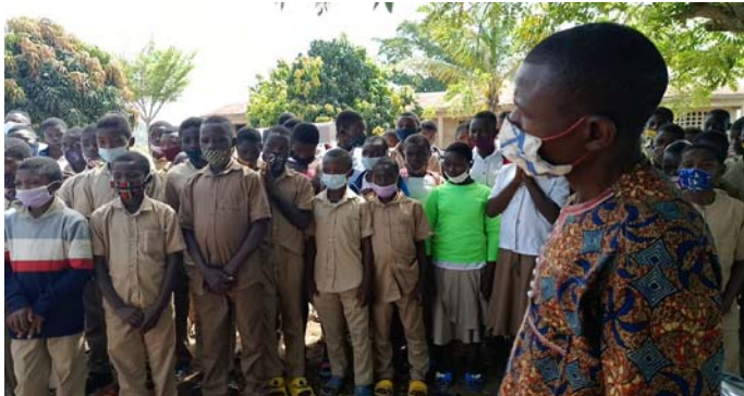
Une vue des bénéficiaires

A la faveur d'une visite dans le village en 2005, pour la distribution de kits scolaires, de vivres et de non vivres, Eric Komlan Mawuli BANYBAH a constaté que les collégiens du village d'IMOOUSSA battaient le pavé sur une distance presque de 5 km, pour rallier leur collège, celui du village voisin de Ounabè. " Cette situation ne saurait durer plus longtemps ", s'est-il dit, promettant aux villageois d'y mettre