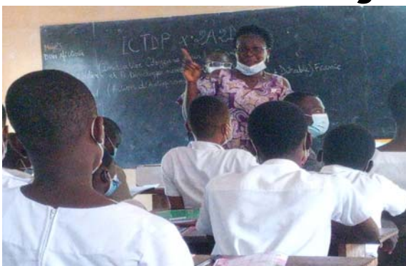
Une vue des jeunes filles lors de la séance de sensibilisation

L'autre volet du projet, c'est la promotion des serviettes hygiéniques réutilisables. L'utilisation de cette serviette respecte l'environnement, l'écologie et aussi la santé de la jeune fille. Ces serviettes réutilisables ont été conçues par l'association elle-même à travers quatre (4) jeunes filles en fin d'apprentissage