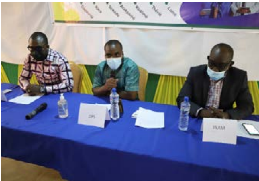
Les responsables de l'Inam et du Synphot lors de la formation

Le Syndicat national des praticiens hospitaliers du Togo (Synphot) a effectué, du 06 au 16 décembre 2021, une tournée nationale avec l'Institut national d'assurance maladie (Inam). Ladite tournée a pour objectif d'amener les prescripteurs à connaître et à s'approprier la nouvelle liste des médicaments remboursables «pour mieux servir les assurés de l'Inam et lutter contre la fraude à l'assurance maladie».