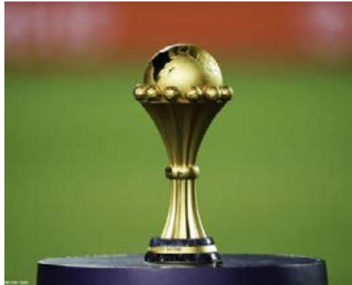
Trophée de la CAN

La Coupe d'Afrique des nations (CAN) 2021 prévue en janvier 2022 sera-t-elle reportée ou annulée ? Des rumeurs insistantes indiquent que l'organisation de la Coupe d'Afrique des nations pourrait être compromise en raison du variant Omicron.