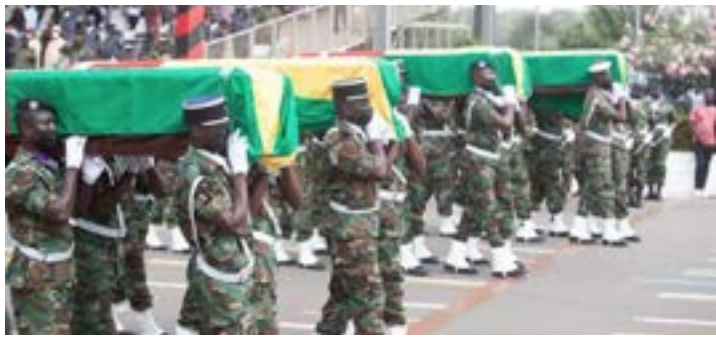
Dépot de gerbes par la ministre de la Défense

C'est avec une vive émotion que le Togo a rendu un hommage mérité aux sept casques bleus togolais tués il y a quelques jours au Mali. La cérémonie d'adieu présidée par le chef de l'Etat, Faure Gnassingbé, s'est déroulée le samedi dernier à la place des fêtes de la présidence de la République, en présence de plusieurs autres personnalités.