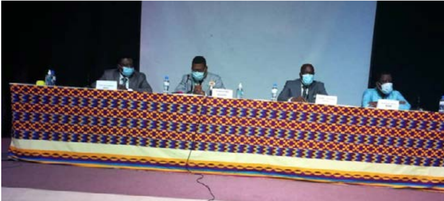
La table d'honneur au lancement des travaux

...d'améliorer le cadre de vie des populations ainsi que les activités économiques.