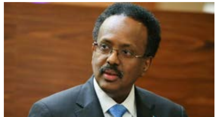
Mohamed Hussein Roble