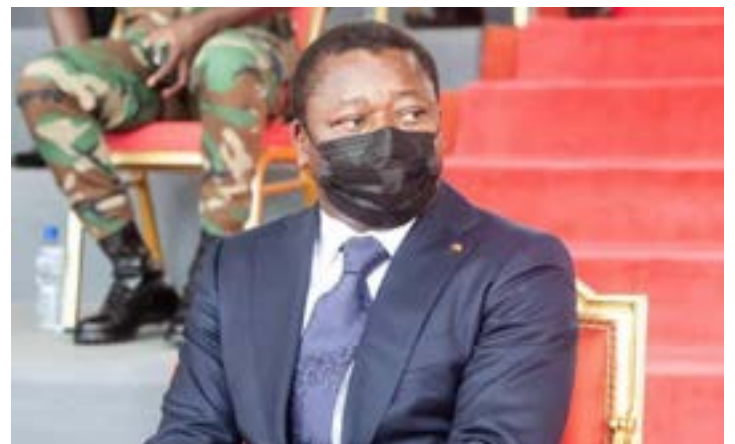
Faure Gnassingbé, président de la République

Afin de démontrer que leur sacrifice est cher à la nation, le chef de l'Etat les a élevés à titre posthume au rang de chevaliers de l'ordre du Mono. « Au nom du peuple togolais, et en mon nom personnel, je réitère mes condoléances aux familles éplorées et souhaite prompt rétablissement aux blessés », a affirmé le président de la République, chef suprême des armées. Leurs frères d'armes