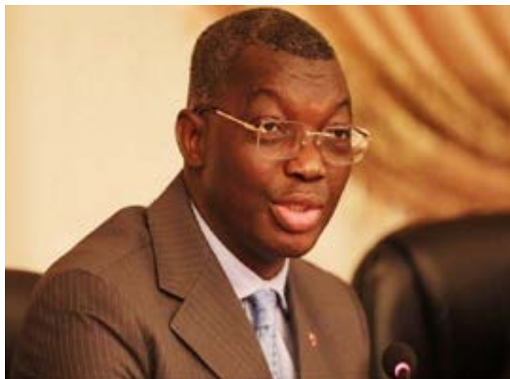
Le général de brigade Damehame Yark

Le mardi 14 décembre dernier, un grave accident de la circulation a fait douze morts et vingt-six blessés graves, sur la route de Warkambou, à Dapaong. Après la publication d'un communiqué par le ministre de la Sécurité et de la Protection civile, le général de brigade Damehame Yark, une visite a été effectuée sur le terrain. Le ministre Yark était accompagné de son homologue des Transports, Affo Atcha-Dédji.