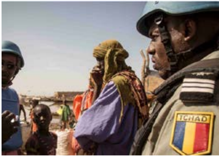
Un soldat tchadien

Pour le moment, ni le calendrier ni la zone de déploiement ne sont précisés et ces détails seront définis en accord avec les Nations unies. La Minusma avait décidé dès le mois de juin de