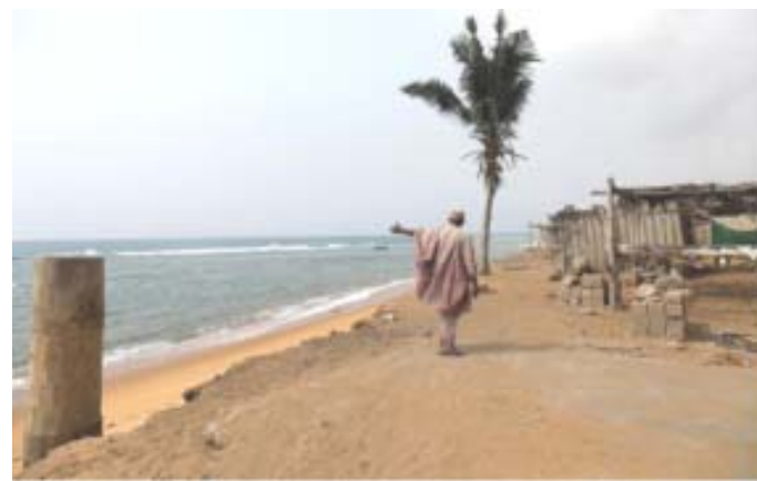
Vue partielle de la côte togolaise

Au Togo, près de 42% de la population vit près des côtes. Il se concentre également sur le littoral une diversité d'activités économiques qui impactent le milieu marin. Pour le gouvernement, la loi de 2021 doit lui permettre d'accélérer la validation du schéma directeur d'aménagement du littoral qui est un outil d'aménagement permettant de mieux organiser l'occupation de l'espace, d'assainir l'environnement et de garantir un meilleur cadre de vie aux populations vivant sur le littoral. D'après un recensement partiel des occupations du littoral, effectué sur l'espace allant de la frontière du Ghana jusqu'à la limite de Baguida, 291 installations illégales avaient été dénombrées et l'aménagement de cette portion du littoral devrait affecter 3.000 occu-