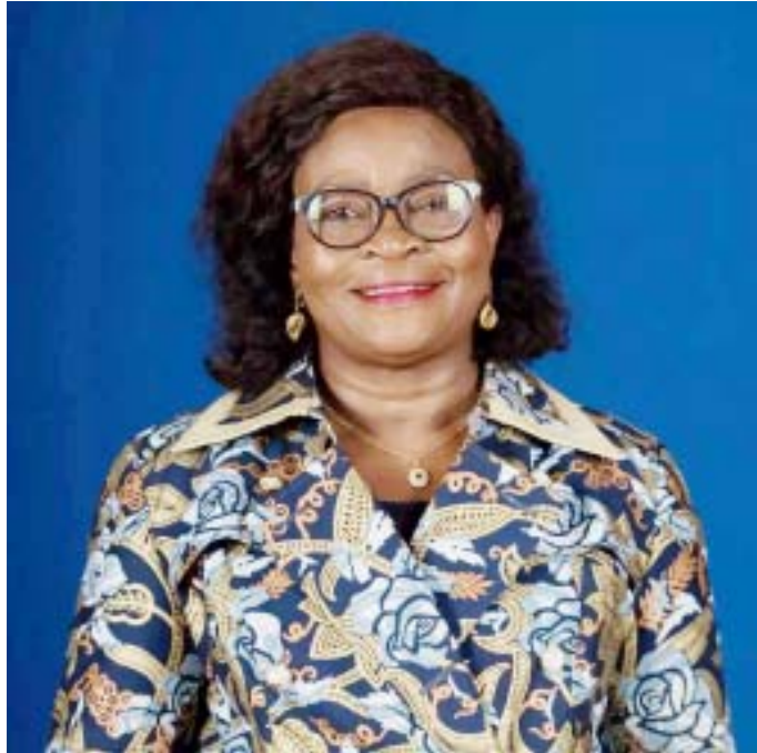
Zouréhatou Tcha-Kondo - Kassa-Traoré, Ministre des travaux publics

En lieu et place de l'entreprise attributaire des travaux (Ebomaf), c'est le gouvernement qui a dû s'expliquer. Tout en croyant en un nouveau délai. D'après le ministre des travaux publics, plusieurs difficultés ont entravé l'avancement normal des travaux, notamment la libération progressive de l'emprise de la route (indemnisation des ri-