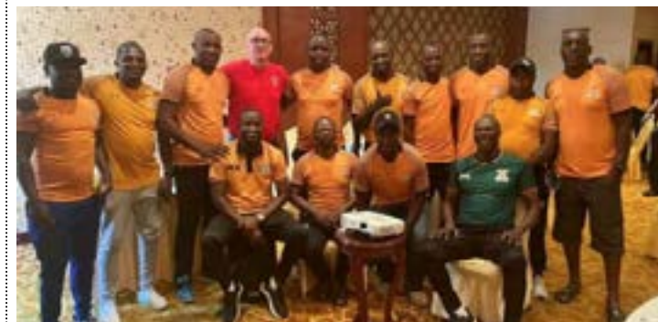
Photo de famille des entraîneurs