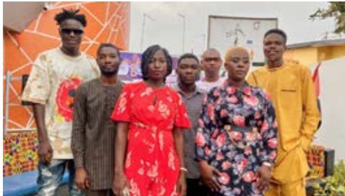
Photo de famille avec les influenceurs