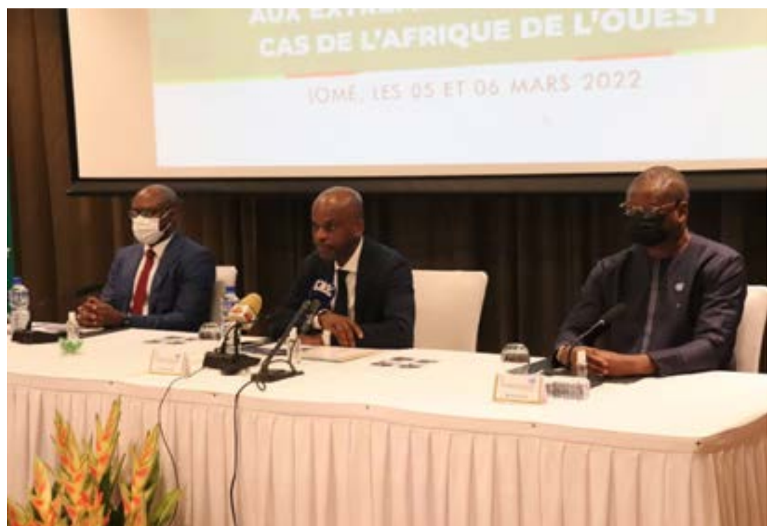
La table d'honneur à l'ouverture du colloque

Les pays qui connaissent des transitions actuellement sont fragiles et leur fragilité peut impacter négativement les autres États de l'Afrique de l'ouest. Comme l'a précisé le ministre des