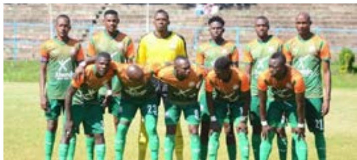
Les Green Eagles