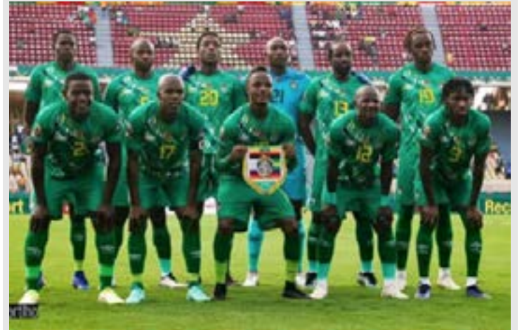
Sélection senior du Zimbabwe

Depuis le 24 février dernier, une épée de Damoclès pèse sur la tête du Zimbabwe, exclu de toutes les compétitions internationales de football par la Fifa pour cause d'ingérence du gouvernement. Cette sanction coupe l'herbe sous les pieds des compétiteurs.