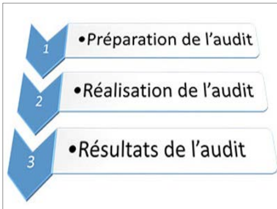
L'audit de sécurité informatique

sécurité informatique est la clé pour sécuriser les données de votre organisation. Un audit de sécurité informatique est une démarche, censée être périodique, qui permet de connaître le niveau de sécurité global de votre système