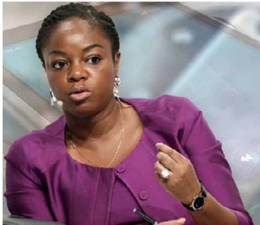
Cina Lawson, ministre de l'Economie numérique

C'est exactement cette coopération que permet et favorise la Convention de Malabo à laquelle l'Assemblée nationale donne l'autorisation au gouvernement d'adhérer. Le Togo a, en effet, mis à niveau son cadre législatif et réglementaire