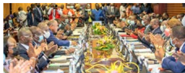
Table du dialogue politique