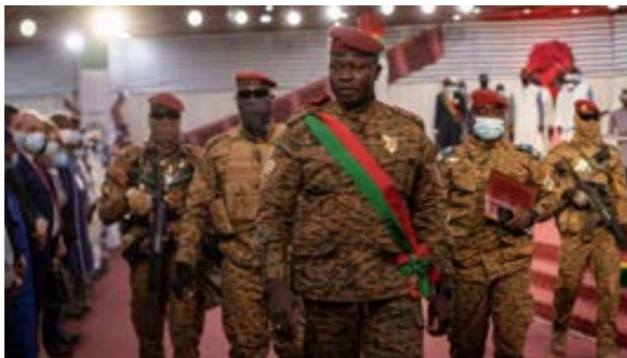
Lt Col Paul-Henry Damiba, pdt de la transition

que l'on pourra ranger dans cette volonté éclectique de la junte au pouvoir, reste celle de l'ancien ministre Yero Boly. Ancien directeur de cabinet, plusieurs fois ministre à des postes stratégiques sous Blaise Compaoré, cet administrateur civil de profession a également été ministre de l'Administration territoriale et de la Sécurité sous Christian Kaboré. Il revient dans ce gouvernement de transition à la faveur de ce coup