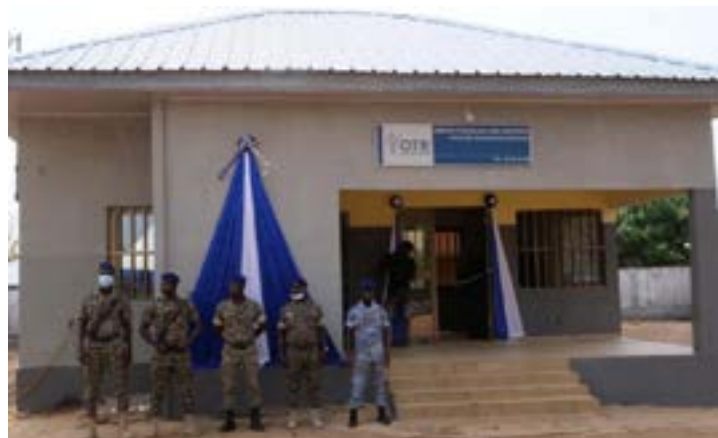
Les bureaux inaugurés

L'Office togolais des recettes (OTR) poursuit sa politique de proximité des populations. De nouveaux bureaux de l'Office ont été inaugurés dans ce cadre, le vendredi 4 mars à Tindjassi. L'ouvrage permet aux agents de l'OTR de travailler dans de bonnes conditions.