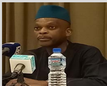
Le ministre Robert Dussey, chef de la diplomatie togolaise

L'idée de la tenue d'une conférence internationale sur les transitions politiques est née de l'analyse approfondie du