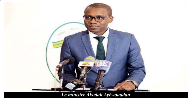
Le ministre Akodah Ayéwouadan

L'annonce a été faite, le 7 avril 2022, par le ministère de la communication. Selon les informations publiées sur le compte twitter du ministère, le processus de modernisation des médias publics " évolue vers la nomination du conseil d'administration de la RTVT.