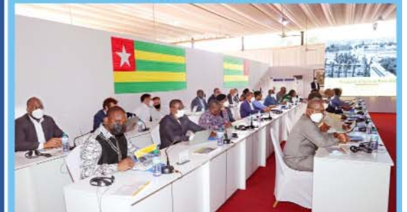
Une vue de l'exécutif lors des travaux en Conseil des ministres.