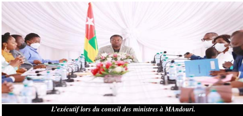
L'exécutif lors du conseil des ministres à Mandouri.

Après le séminaire gouvernemental tenu à Kara du 8 au 9 Avril dernier, l'exécutif togolais sous le leadership du Président de la République Faure Essozimna Gnassingbé s'est rendu à Mandouri dans la préfecture de Kpedjal où un conseil des ministres a eu lieu le dimanche 10 avril 2022.