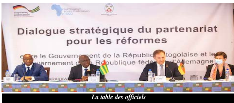
La table des officiels

La République Fédérale d'Allemagne reste un des principaux partenaires du Togo. En effet, en plus du partenariat pour les réformes, le Togo a bénéficié de l'appui du gouvernement Allemand dans la mise en œuvre des politiques de développement notamment dans les secteurs de l'énergie et de la santé, particulièrement dans la gestion avec succès de