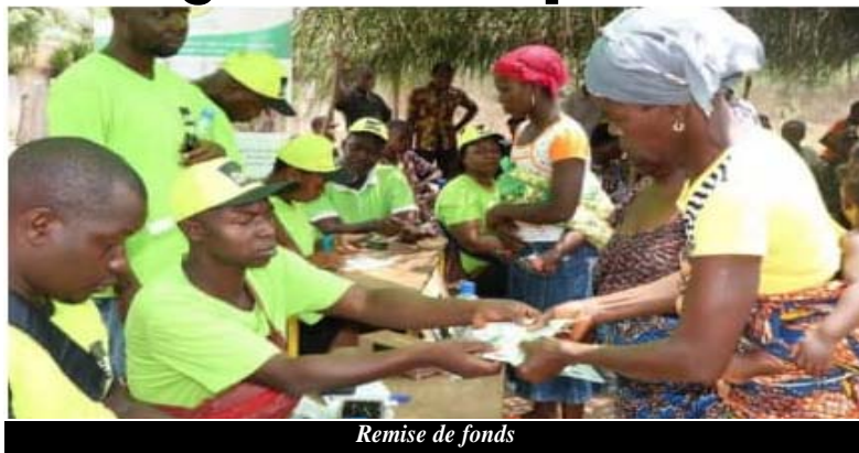
Remise de fonds

Les Filets sociaux et services de base (FSB) assurent aux communautés un meilleur accès aux infrastructures socioéconomiques de base et aux filets sociaux (transferts monétaires, cantines scolaires). C'est un mécanisme qui accroît le revenu et la consommation des bénéficiaires et, par conséquent, leur capacité à faire face aux chocs, surtout en pleine covid-19.