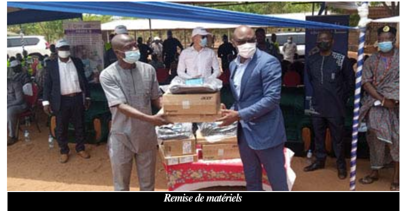
Remise de matériels

participative des collèges. Spécifiquement, il va plus améliorer la gouvernance de 175 collèges publics à travers les projets d'établissement, la lutte contre les violences, la promotion de l'égalité genre, l'orientation scolaire et socio-professionnelle ; les capacités et les conditions d'accueil par la mise en place des infrastructures et équipements dans 135 collèges publics des régions Maritime, Plateaux et Savanes.