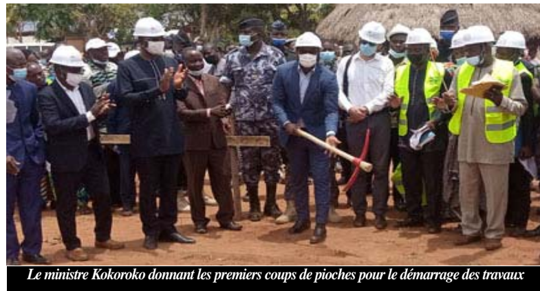
Le ministre Kokoroko donnant les premiers coups de pioches pour le démarrage des travaux

C'est dire que le gouvernement à travers sa feuille de route, ambitionne remettre de l'ordre dans le secteur pour garantir un avenir meilleur aux futures générations. Une ambition qui a permis le lancement du volet construction des salles de classes de la phase 2 du Projet d'Appui à la Réforme des Collèges (PAREC II). Avec ce projet, les populations des régions Maritime, Plateaux (Est et Ouest) ainsi que des Savanes, bénéficieront de la construction de 384 salles de classes. Financé partiellement par l'Agence Française de Développement (AFD) à hauteur de 10 milliards de F CFA, le PAREC 2 va contribuer à l'amélioration de l'achèvement des collégiens particulièrement les filles par le renforcement des conditions d'accueil, d'apprentissage et la promotion de la gouvernance