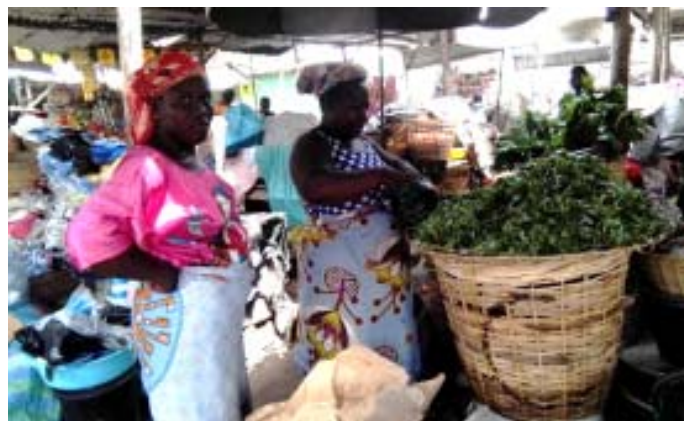
Adémè contribue à la baisse avec ses -26,3%...

La baisse de l'indice des fonctions de consommation «Produits alimentaires et boissons non alcoolisées» et «Logement, eau, gaz, électricité et autres combustibles» est soutenue par la régression des indices des postes suivants : «Légumes frais en fruits ou racine» (-13,2%); «Légumes frais en feuilles» (-12,2%); «Poisons et autres produits séchés ou fumés» (-4,3%); «Sel, épices, sauces et produits alimentaires n.d.a» (-3,7%); «Autres matières grasses» (-8,2%); «Autres produits à base de tubercules et de plantain» (-2,7%); «Céréales non transformées» (-0,2%) et «Combustibles solides et autres» (-13,6%). La diminution du niveau des indices observée en mars 2022 est imputable au fléchissement des prix des variétés suivantes : «Tomates rondes (Pomme)» (-24,0%); «Concombre» (-18,7%); «Oignon frais rond» (-18,7%); «Betterave» (-1,7%); «Carottes» (-1,0%); «Feuille de haricot» (-30,0%); «Adémè» (-26,3%); «Gboman» (-11,8%); «Choux vert» (-2,2%); «Doèvi fumé (Anchois)» (-15,0%); «Doèvi séché (Anchois)» (-7,9%); «Manvi fumé (Hareng)» (-4,2%); «Sardinelles fumées (Adiadoè)» (-4,0%); «Akpala fumé (Chinchard)» (-1,2%); «Poisson salé fermenté (Lanhoinhoin)» (-0,6%); «Ail frais» (-22,8%); «Piment rouge frais» (-14,9%); «Gingembre frais» (-5,4%); «Piment rouge sec en poudre» (-2,4%); «Sel de cuisine gros cristaux» (-2,2%); «Noix de palme