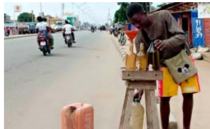
...tandis que Essence super de rue a flambé de 4,5%

Du point de vue des nomenclatures secondaires et par