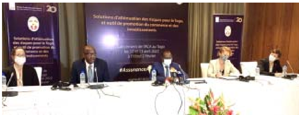
Table officielle lors de la rencontre de l'ACA à Lomé

Le Togo est devenu Etat membre de l'ACA en 2020, avec une participation initiale de 12,5 millions