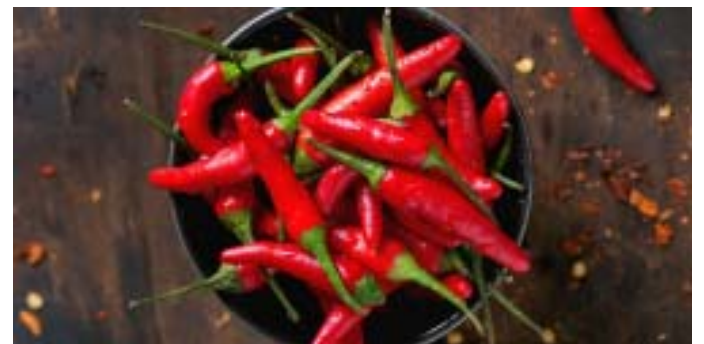
Piment rouge frais

ont enregistrées comme suit : «Logement, eau, gaz, électricité et autres combustibles» (+6,0%); «Restaurants et Hôtels» (+2,6%); «Articles d'habillement et chaussures» (+3,9%); «Loisirs et culture» (+8,0%); «Biens et services divers» (+3,0%); «Meubles, articles de ménage et entretien courant du foyer» (+3,8%); «Boissons alcoolisées tabac et stupéfiants» (+3,0%) et «Santé» (+0,7%).