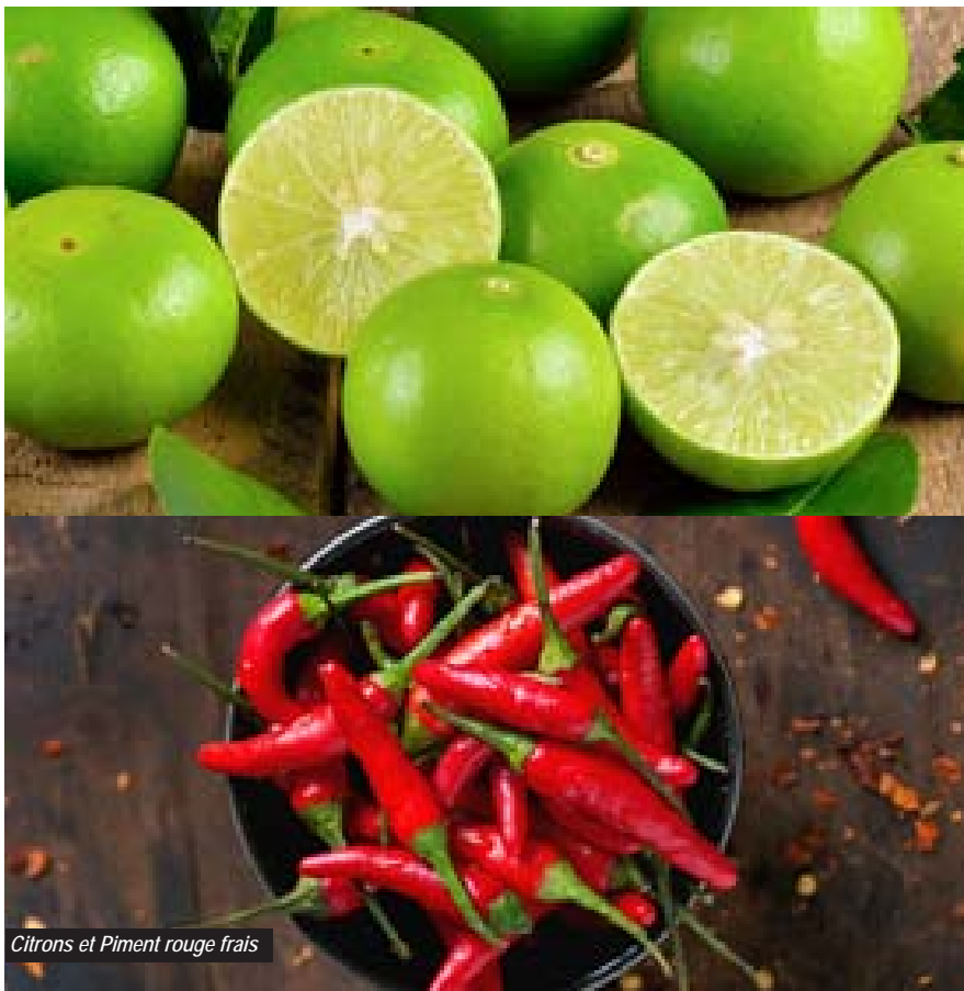
Citrons et Piment rouge frais

En avril 2022, l'INHPC - Indice national harmonisé des prix à la consommation - a progressé de 1,5% par rapport à son niveau de mars 2022 où la baisse constatée était de 0,4%. Cette évolution est due à l'augmentation des indices des fonctions de consommation dont les plus importantes en termes de contribution sont : "Produits alimentaires et boissons non alcoolisées" (+2,7%) ; "Transports" (+4,3%) et "Restaurants et Hôtels" (+0,8%). La hausse de l'indice global est, cependant, ralentie par la baisse du niveau des indices des fonctions de consommation "Logement, eau, gaz, électricité et autres combustibles" (-0,3%) et "Boissons alcoolisées, tabac et stupéfiants" (-1,4%).