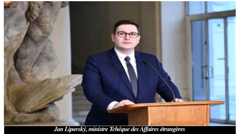
Jan Lipavský, ministre Tchéque des Affaires étrangères

La transformation du gaz et du pétrole en armes de guerre a un impact négatif sur de nombreuses économies en Europe et ailleurs. L'armée russe visant l'infrastructure de stockage des céréales et le blocus russe des