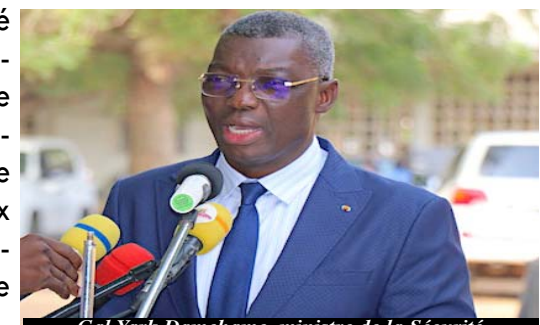
Gal Yark Damehame, ministre de la Sécurité