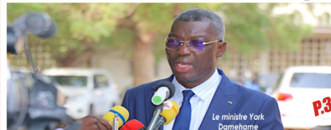
Le ministre York Damehame

Terrorisme : On n'attaque pas impunément le Togo