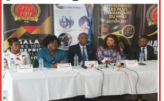
La table lors de la rencontre avec la presse P.7