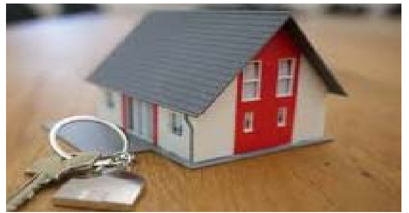
Une habitation moderne

Par ailleurs, il est avéré que le fait d'habiter dans un logement dégradé conduit à un processus de stigmatisation, de dégradation sociale, de perte d'estime de soi. Il s'en suit donc que le maigre rendement des citoyens et leur incapacité à créer de la vraie richesse dans le pays trouvent leur fondement, en bonne partie, dans ce manque d'organisation sociale qui permet la création des cadres convenables de vie. Car, comme indiqué plus haut, les effets de la mauvaise qualité de logement et de sa suroccupation sur la santé mentale, l'anxiété, la dépression, l'a-