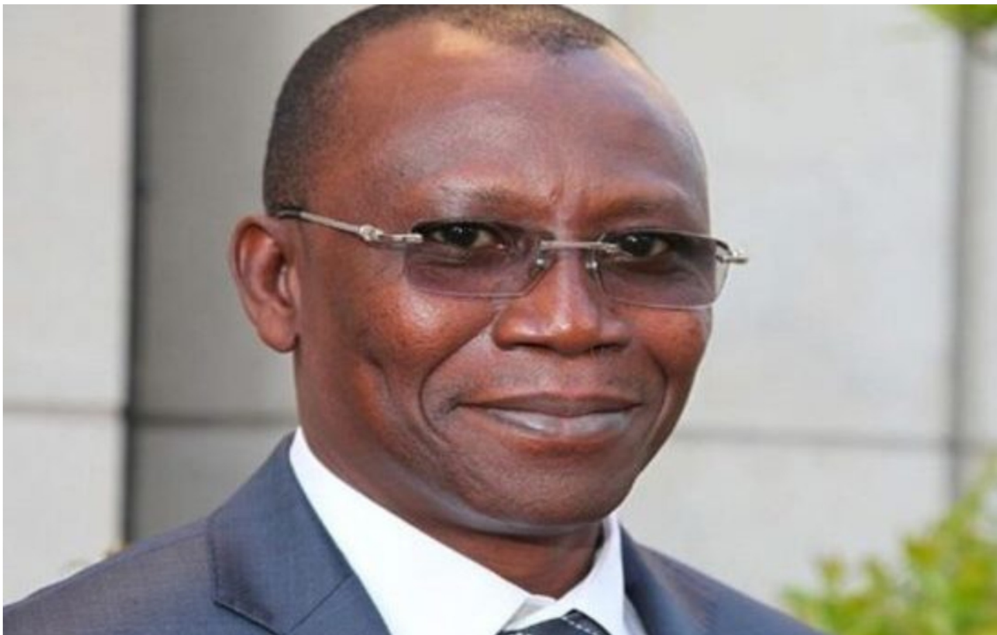
Sani Yaya, ministre de l'Economie et des finances

Régression du Coronavirus au Togo: Le gouvernement rouvre les frontières