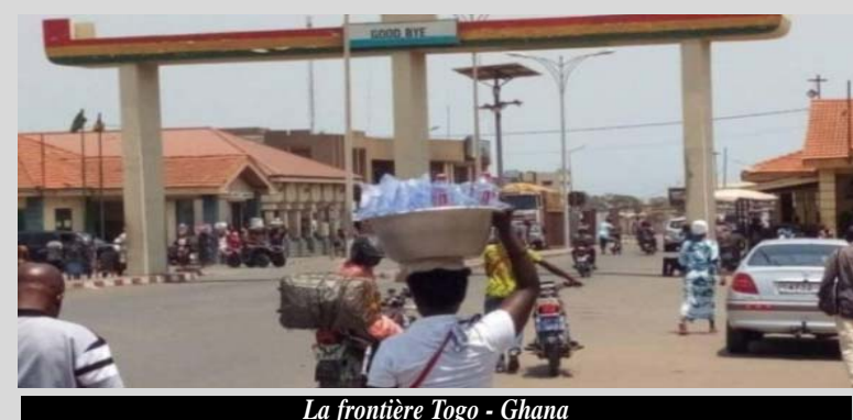
La frontière Togo - Ghana

Cette mesure, d'après les autorités fait suite au "ralen-