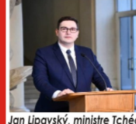
Jan Lipavský, ministre Tchèque des Affaires étrangères

La Guerre Russie- Ukraine : Vraies et fausses "libérations" - combattre les fantômes du néo-colonialisme