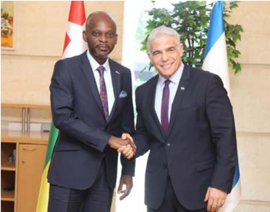
Professeur Robert Dussey (à gauche) et Yair Lapid

Depuis quelques jours, le professeur Robert Dussey, ministre togolais des Affaires étrangères, de l'Intégration régionale et des Togolais de l'étranger, séjourne en Israël afin de réchauffer les liens de coopération entre les deux pays.