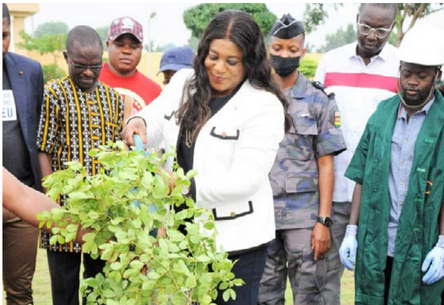
Yawa Djigbodi Tsègan (au milieu), lors de l'opération de reboisement le 1er Juin au siège de l'Assemblée nationale

La cheffe du gouvernement s'est ensuite rendue à Afagnan, chef-lieu de la préfecture de Bas-Mono où elle a planté un jeune plant de Gmelina arborea encore appelé teck indien. À Akoumapé dans le Vo, elle a mis en terre un plant de Kaya senegalensis. La présidente de l'Assemblée nationale Yawa Djigbodi Tsègan, les députés et les membres de l'administration parlementaire ont également mis en terre des plants, au siège du Parlement. A la présidence de la République, c'est le ministre et secrétaire général, Sandra Ablamba Johnson qui a pris les devants au nom du président de la République Faure Gnassingbé. La ministre des Armées, Marguerite Essozimna Gnakadé était aux côtés de ses frères et sœurs d'armes pour l'opération un militaire, un