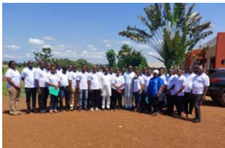
Des participants à la rencontre

Le Projet d'appui à l'employabilité et à l'insertion des jeunes dans les secteurs porteurs (Paeij-SP) tient du 1er au 3 juin au siège de la PME, « Trésor Agricole » sis à Sotouboua, dans la région Centrale, un atelier de réflexion. L'initiative qui regroupe 15 PME/PMI permet de réfléchir sur les perspectives de pérennisation de l'approche chaîne de valeurs et d'intégration de la RSE au sein des clusters.