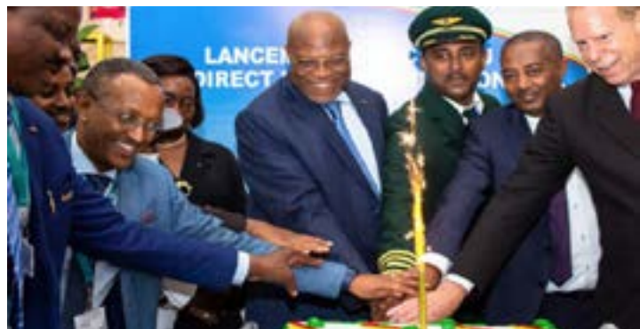
Coupe du gâteau

Il est désormais possible de rallier directement la capitale des Etats-Unis au départ de Lomé. Le vol direct Lomé-Washington DC a été officiellement lancé mercredi 1er juin à l'Aéroport international Gnassingbé Eyadema (AIGE). 3 vols s'effectueront chaque semaine vers cette destination.