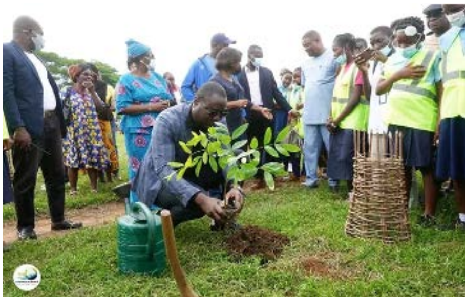
Activité de reboisement dans le Golfe 3

La 45 e édition de la journée de l'arbre dans la commune du Golfe 3 s'est déroulée dans une ambiance bon enfant. En effet, elle va vu la forte mobilisation du Conseil municipal du Golfe3, notamment la présence de tout l'exécutif et des 3 présidents des Commissions permanentes et plusieurs conseillers) venus planter un arbre pour sauver notre planète menacée par le réchauffement climatique. On note la présence effective de Rose Kayi Mivedor, ministre de la Promotion de l'investissement. Elle a, dans son allocution rappelé l'importance de cet acte qui sauve des vies. Elle a invité tout le monde à planter un arbre afin d'atteindre les objectifs du