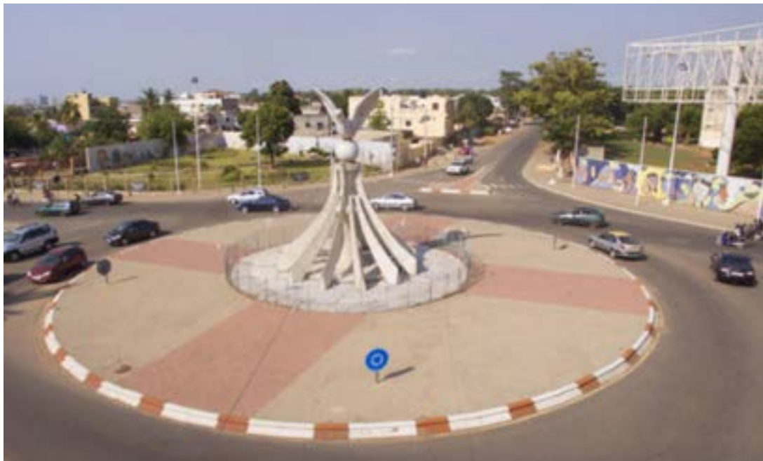
Le monument de la colombe de la paix

Le trajet en voiture de l'aéroport jusqu'à mon nouveau chez moi m'a montré une capitale très vivante. La chaleur qu'il y faisait alors que le soleil était couché depuis bien longtemps, contrastait avec le froid que j'avais subi durant mes 6 heures de vol. Les rues de la ville étaient animées malgré l'heure tardive. Ce sentiment de ville très active m'a accompagné les jours qui ont suivi. J'ai l'impression que tout le monde est tout le temps dehors.