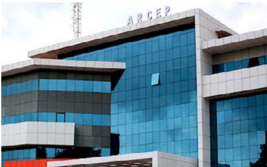
Siège de l'Arcep

L'enquête fait suite à la campagne nationale de mesures de qualité (QoS) mobiles voix (2G) et data (3G/4G) lancée pour évaluer la conformité de la qualité des services fournis par les opérateurs Togocom et Moov Africa Togo par rapport à l'arrêté portant définition des indicateurs de qualité des services mobiles 2G/3G/4G et leurs seuils.