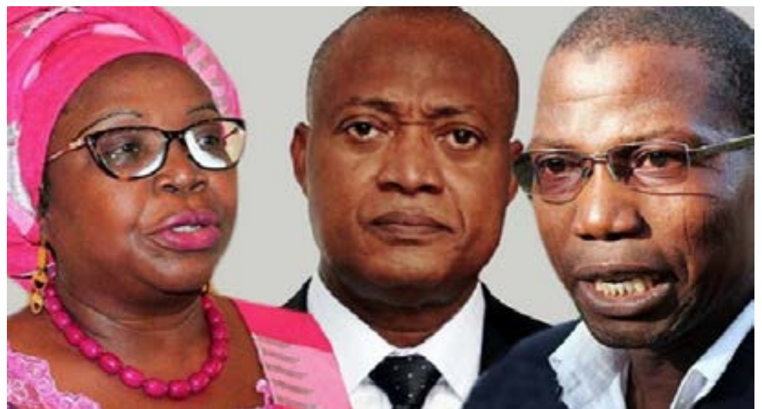
Quelques responsables de l'opposition togolaise

En effet, ces dernières années au Togo ont été marquées par plusieurs échecs successifs de l'opposition politique, y compris la division