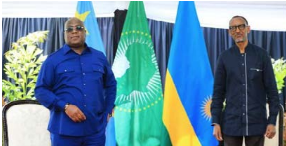
Tshisekedi et Kagame

Missionnée par l'Organisation des Nations unies (ONU), une enquête des experts transmise au Conseil de sécurité de l'organisation vient de rendre son verdict. L'armée rwandaise, selon les conclusions de cette enquête, est intervenue dans l'est de la RDC, directement et en soutien à des groupes armés, depuis novembre 2021.