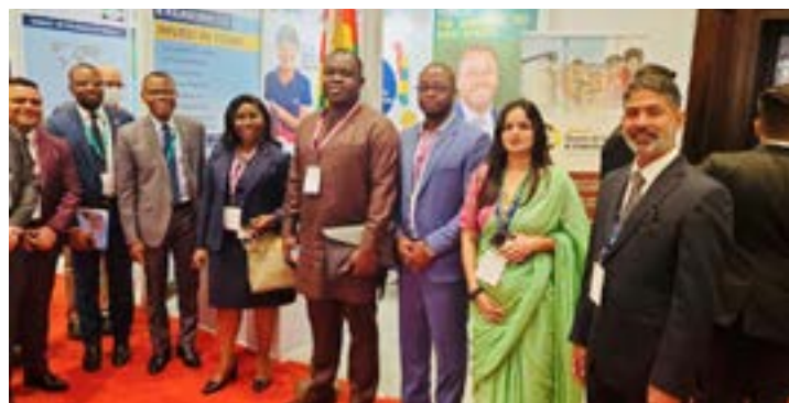
Des membres de la délégation

exportations, le commerce, l'investissement et l'échange de connaissances et d'expertise, créant ainsi une valeur partagée pour les entreprises et l'industrie au sens large entre l'Inde et le Togo. Pour l'occasion, la PIA a pu organiser des réunions de haut niveau avec plus de 100 investisseurs potentiels. Elle a aussi