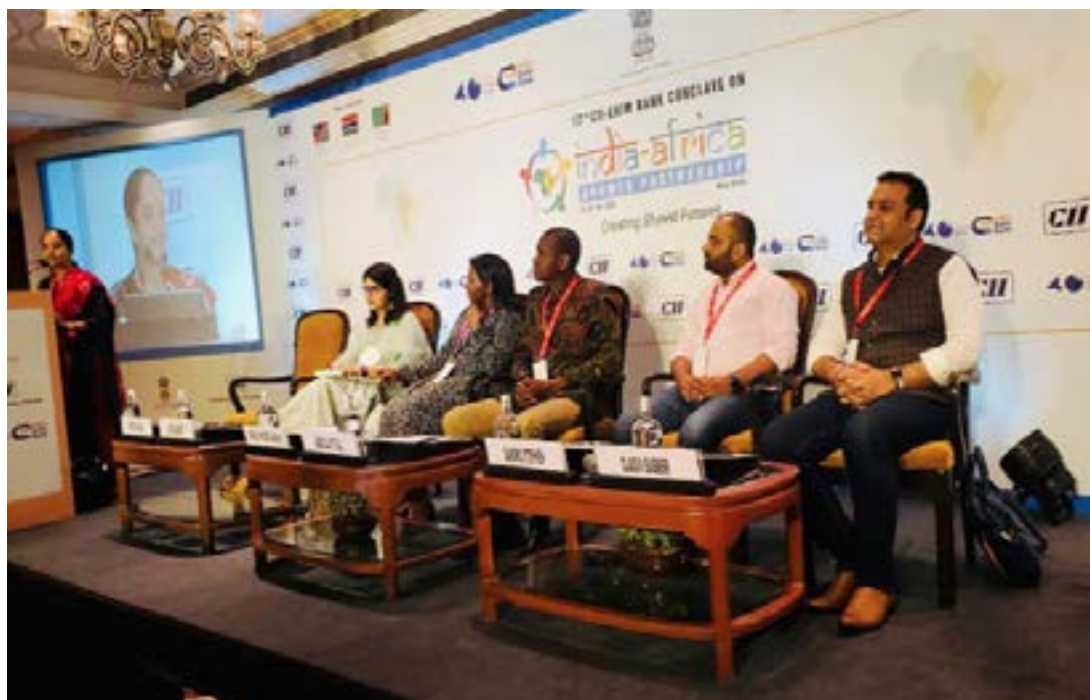
Une table ronde lors de la rencontre

La délégation togolaise était composée de la ministre des Investissements et de la Promotion, Rose Kayi Mivedor, des agents du ministère chargé du Commerce, de la Société d'administration des zones franches (SAZOF), de la Chambre de commerce et d'industrie du Togo (CCIT), du Conseil national du patronat du Togo (CNPT),