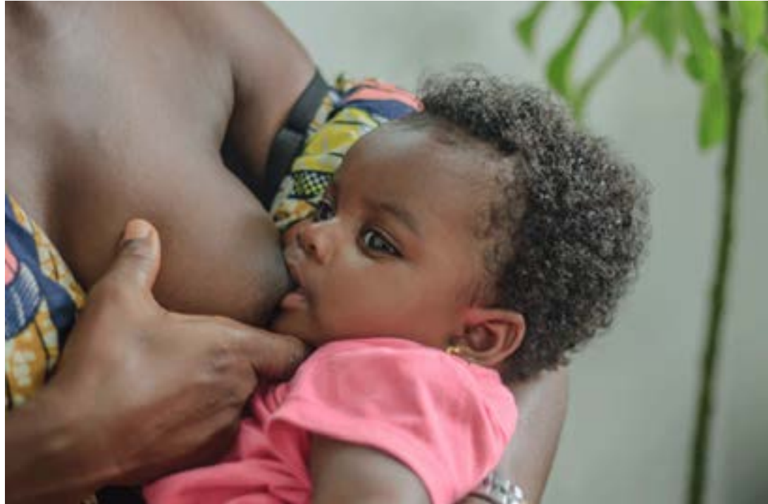
Une maman allaite son bébé

Chaque année, des millions de nouveau-nés sont privés des bienfaits de la mise au sein précoce, très souvent pour des raisons auxquelles l'on peut remédier. Les mères ne reçoivent tout simplement pas l'appui nécessaire dans ces premières minutes cruciales qui suivent la naissance, même de la part du personnel médical des centres de santé.