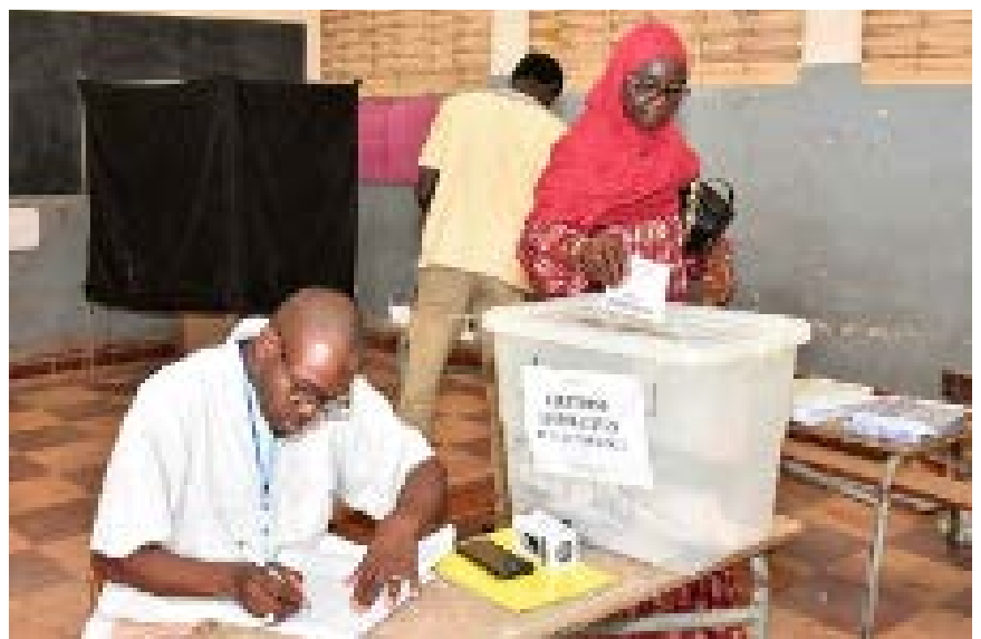
Une opération de vote au Sénégal

Quelque 7 millions de Sénégalais étaient appelés