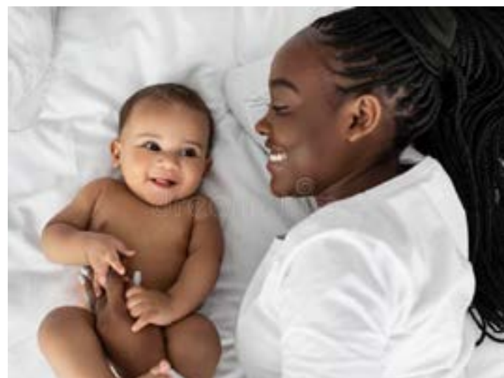
L'allaitement rend heureux, maman et son bébé

Malheureusement, près de 2 nourrissons sur 3 ne sont pas allaités