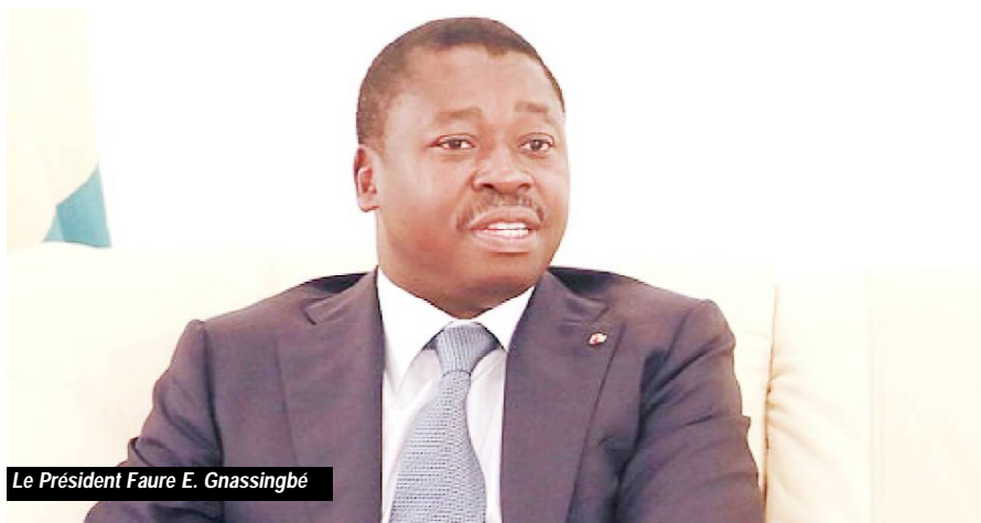
Le Président Faure E. Gnassingbé

Implication personnelle de Faure pour les faire baisser