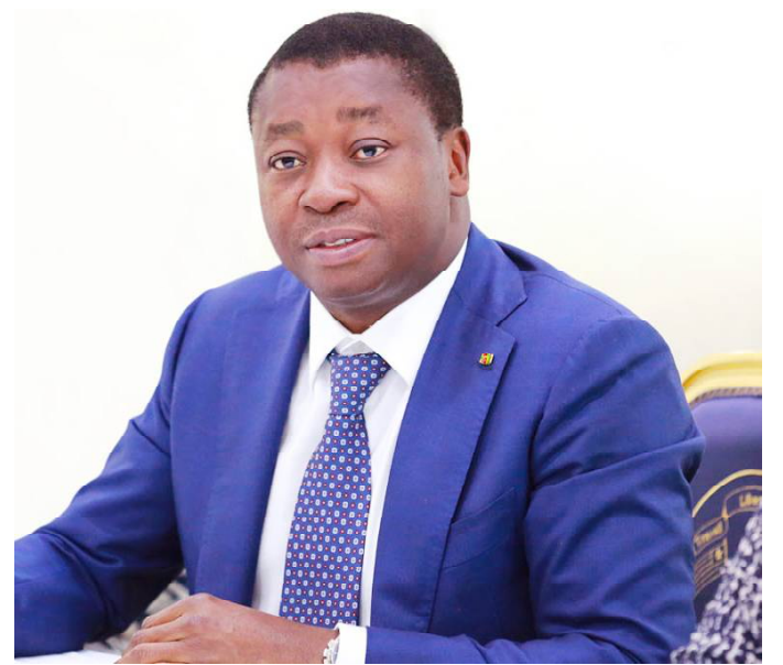
Le président Faure Gnassingbé

Cette annonce de Faure Gnassingbé est faite moins de deux semaines après l'officialisation, pour bientôt, de la suppression des frais du roaming (itinérance) entre le Gabon et le Togo. "La mise en œuvre effective se traduira par une baisse drastique des prix sur les communications mobiles (voix, data et sms) en itinérance favorisant ainsi la mobilité des citoyens entre les deux pays. Concrètement, il sera désormais possible d'utiliser une carte SIM togolaise au Gabon et vice versa sans payer de frais de roaming qui rendent ces communications mobiles extrêmement chères. Plus précisément, la réception des appels sera désormais gratuite et les appels