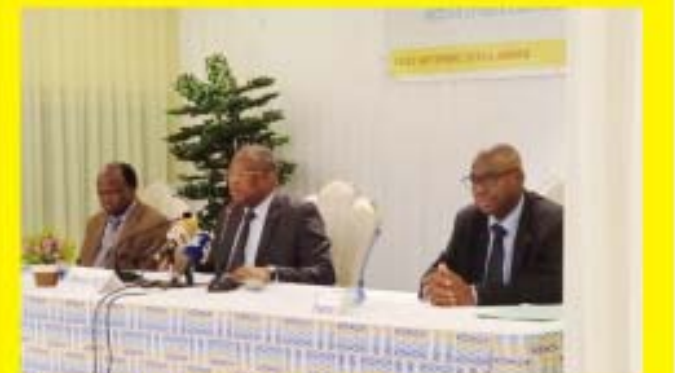
Le Président de la HAAC au milieu

La HAAC renforce la collaboration entre les journalistes et les FDS P.4