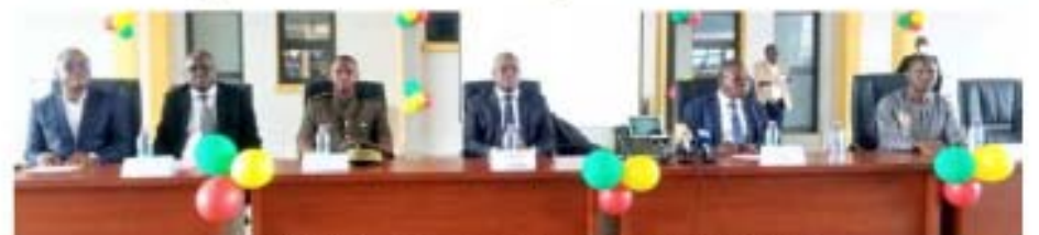
Table d'honneur au cours de la séance

L'Interconnexion des Systèmes Informatiques des douanes béninoises et togolaises opérationnelle