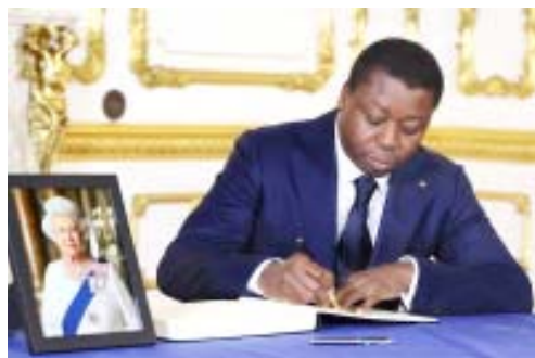
Le Chef de l'Etat signant le livre d'or

vre d'or de condoléances ouvert en hommage à la monarque britannique à Lancaster House. À l'annonce du décès de la Reine Elizabeth II, le Président de la République avait salué «une figure universelle du