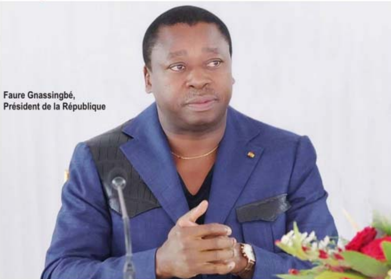
Faure Gnassingbé, Président de la République

Lutte contre la vie chère : En plus de ses dix mesures, le président Faure appelle à la solidarité et à plus d'ardeur au travail P.3