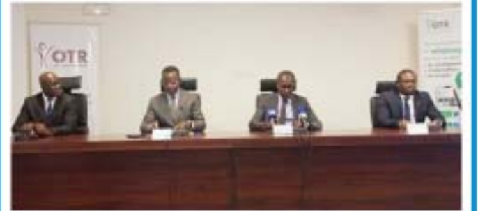
Table d'honneur lors du lancement

L'OTR et l'OTM lancent la deuxième édition P.6