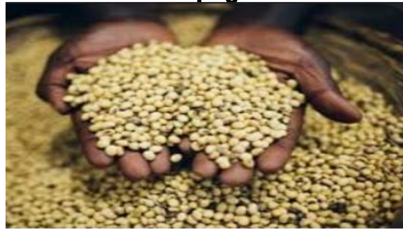
Le soja togolais

Il faut dire qu'à la veille du lancement de cette campagne, les autorités avaient précisé les conditions de l'exercice de la profession