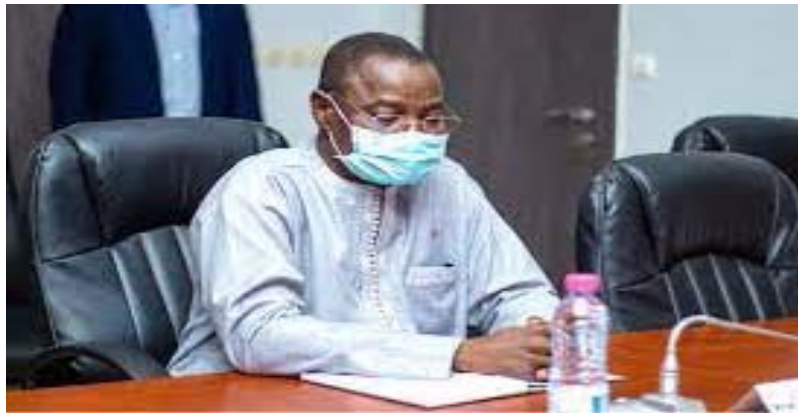
Prof Moustafa Mijiyawa, ministre de la Santé

En termes de bilan, cinq ans après sa mise en œuvre en 2017, la contractualisation a apporté de nombreux changements dans la gestion des structures de santé qui en ont fait l'expérience. Ces chan-