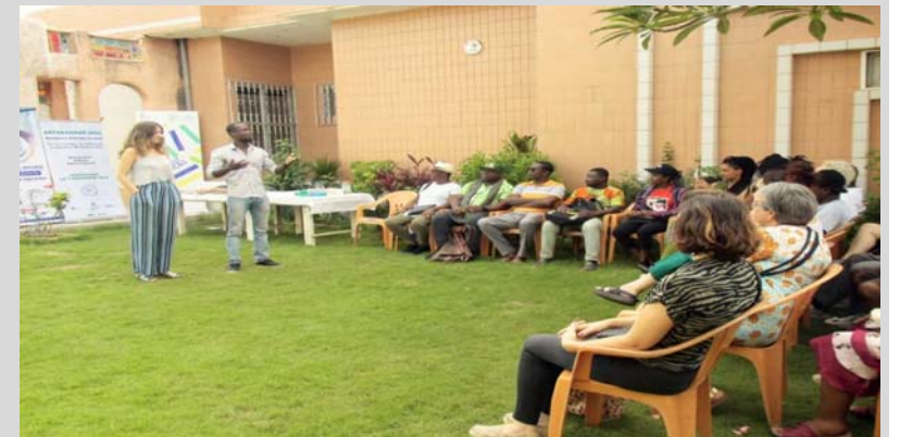
Une vue de l'assistance

Du 19 novembre, au 4 décembre 2022, le musée Agnassan, de feu Paul Ahyi, à Lomé, servira de cadre au déroulement des activités inscrites à la 3 e édition de ArtMéssiamé. Neuf (9) artistes venant de la France, du Burkina-Faso, de la Côte d'Ivoire et du Togo échangeront entre eux et partageront également leur savoir avec des étudiants.