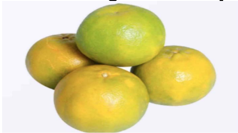
"Oranges locales" (-15,3%), la plus forte baisse

Cependant, la baisse de l'indice global est atténuée par l'augmentation du niveau des indices des fonctions de consommation "Logement, eau, gaz, électricité et autres combustibles" (+0,6%), "Biens et services divers" (+1,0%), "Articles d'habillement et chaussures" (+0,5%), "Transports" (+0,4%) et "Enseignement" (+1,3%). L'augmentation du niveau des indices des postes "Combustibles liquides" (+4,3%) et " Loyers effectifs des locataires et sous-locataires" (+1,1%) a