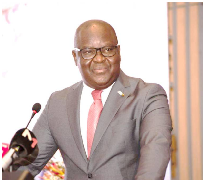
Edoh Kossi Amenounve, Président de l'ASEA et Directeur général de la BRVM

« L'AELP s'inscrit dans la dynamique d'accroissement des échanges intra-africains sur le plan commercial (ZLECAF), des systèmes de paiement (PAPSS) promu par l'Afreximbank, et des capitaux. Avec l'AELP, nous entrons dans une nouvelle ère des marchés de capitaux africains où tous nos membres effectueront