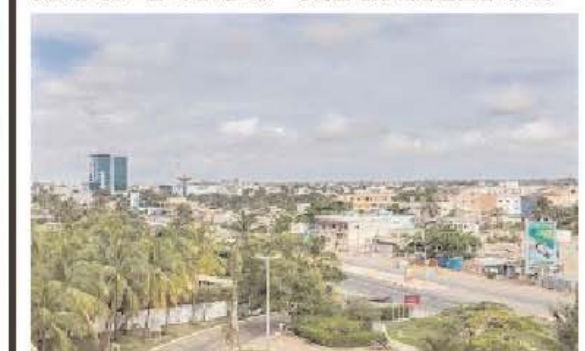
Une vue partielle de la ville de Lomé

EmploiTogo.com Des annonces, des offres d'emploi, une banque de Cvs, des formations. Journalemploi.com Tel 22 20 05 53