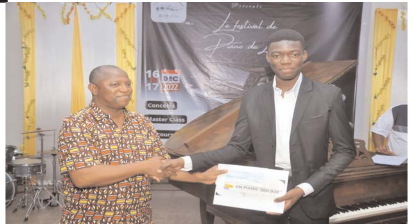
Remise de chèque au gagnant au vainqueur du concours par le Représentant du ministre de la culture...

La journée du samedi 17 décembre 2022 a constitué le summum avec le concours de piano Master Piano dans la Grande Salle d'un Hôtel de la capitale.