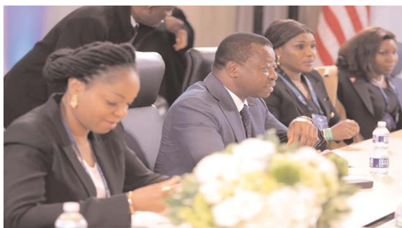
Le Président Faure Gnassingbé et sa délégation lors du Sommet

Dans un communiqué, le MCC précise que la sélection du Togo, en tant que pays éligible au programme de subvention de cinq ans de la MCC, n'est que la première des nombreuses étapes du développement d'un programme compact. Au fur et à mesure que le travail sur le "Compact " avance, le Conseil d'administration et la MCC continueront à surveiller de près l'engagement du Togo