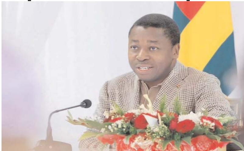
Le Président de la République, Faure Gnassingbé

Pour une fois, je pense qu'on n'a pas de différence entre les équipes africaines et les autres équipes. J'ai été particulièrement heureux de voir que le Maroc a fait des prouesses,