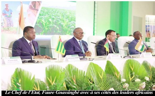
Le Chef de l'Etat, Faure Gnassingbé avec à ses côtés des leaders africains

C'est autour de cette question que les réflexions ont été menées mardi et mercredi dernier dans la capitale togolaise au cours d'une table ronde de haut niveau initiée par le gouvernement togolais et qui a connu la présence des représentants de la Banque mondiale et de la Cedeao, des dirigeants venus de l'ensemble des Etats membres de la CEDEAO notamment le Bissau Guinéen Président en exercice de la CEDEAO Umarou Cissoco Mbalo, Mohamed Bazoun du Niger Président en exercice de l'UEMOA, ainsi que