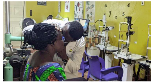
Un patient se faisant examiner

quantaine de personnes. Tout a débuté avec une sensibilisation sur les maladies