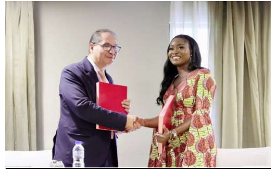
Echange de documents après la signature du protocole d'accord

concerne la promotion de la mécanisation de l'agriculture et débouche sur la déclaration de Lomé sur les engrais. Une étude de faisabilité est envisagée en vue de l'installation de l'usine. Dans le cadre de ce projet donc le royaume chérifien proposera son