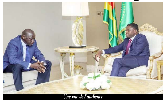
Une vue de l'audience

D'autres pratiques culturelles et irrigations inappropriées ainsi que la sécheresse modifient la croissance végétale et