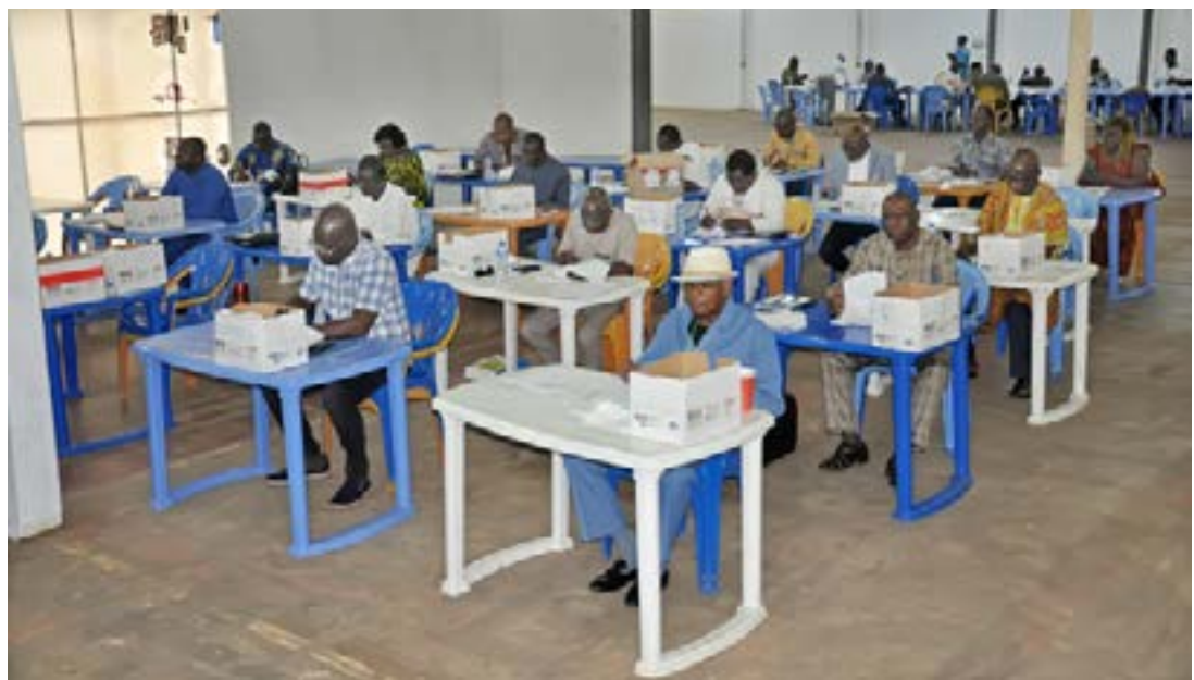
Séance de travail à la Ceni

le principe sacro-saint d'« un électeur, une voix », fondamental pour des élections crédibles. Il y a lieu de rappeler que le recensement électoral en vue des élections de 2023, a commencé le 29 avril