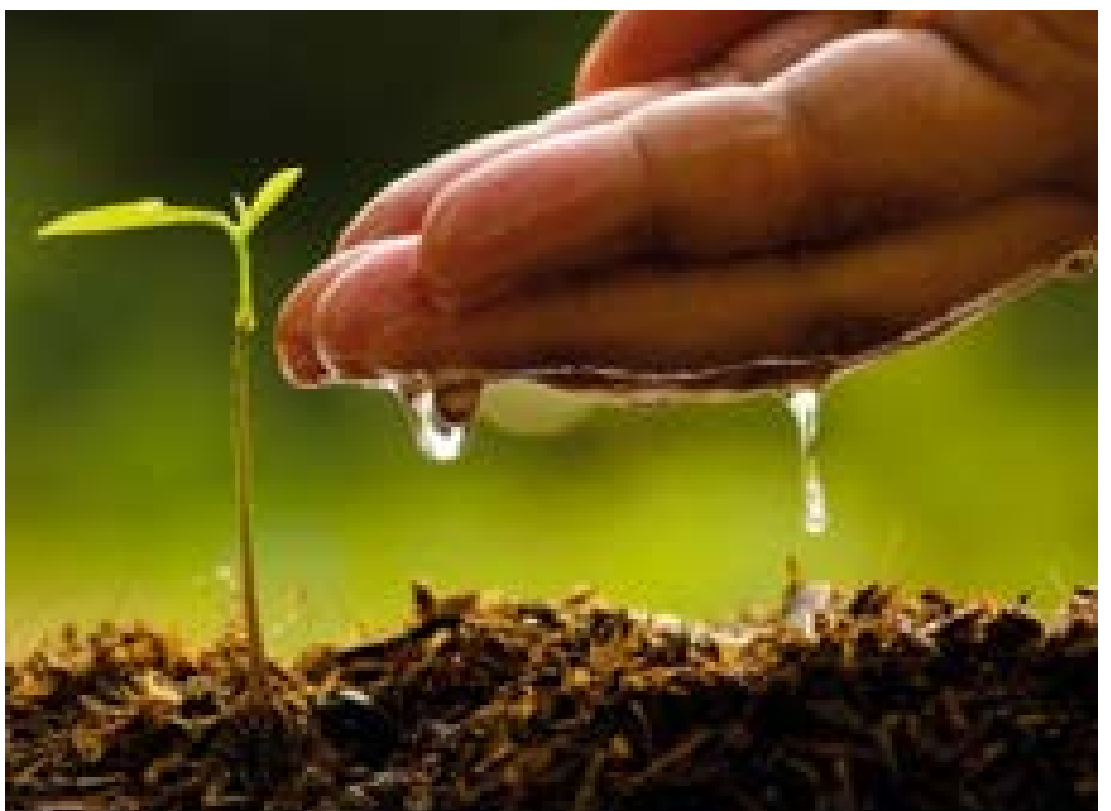
Une agriculture togolaise prospère

Aujourd'hui plus que jamais, on se rend compte de l'engagement inconditionnel du président de la République togolaise, Faure Gnassingbé qui a déclaré au début de la crise que « la population