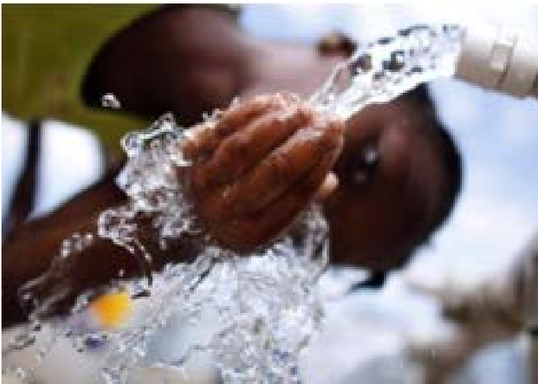
Accès à l'eau potable

Les ambitions liées à l'accès facile et sans conditions à l'eau potable sont plus prononcées au Togo, un pays dont les priorités correspondent aux Objectifs de développement durable (ODD). Ces ODD font également allégeance à l'agriculture. En effet, le Togo est un pays à forte potentialité agricole. A travers des aides socioéconomiques importantes, le gouvernement est au chevet des producteurs. Autant de défis à relever face à la crise sanitaire de coronavirus qui a secoué le pays entre 2020 et 2022.