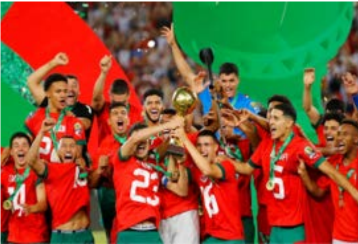
Le Maroc soulevant la coupe

des vainqueurs de la compétition. Mené dès la 10e minute de jeu grâce à un but exceptionnel de Mahmoud Saber, le Maroc a renversé la partie après l'exclusion du buteur égyptien à la