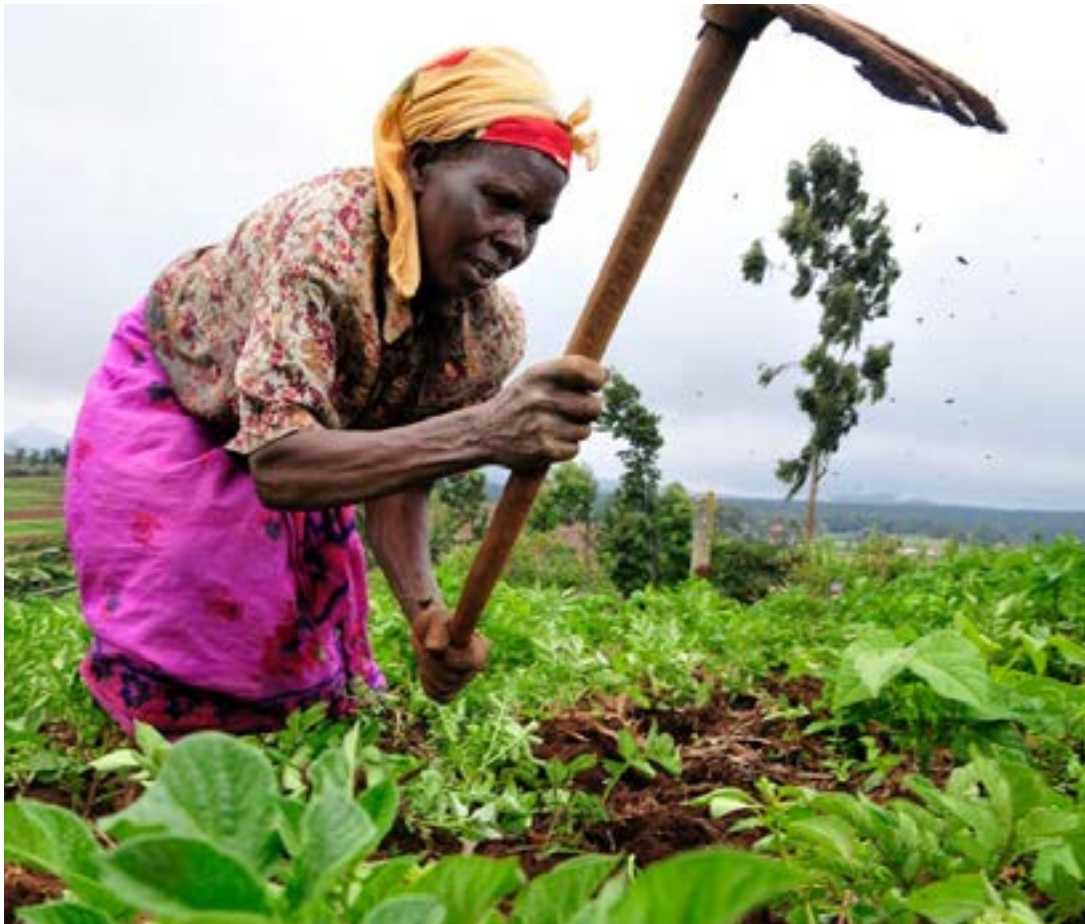
Le jardinage, un des secrets

Faure Gnassingbé est perpétuellement au front de la lutte, tentant