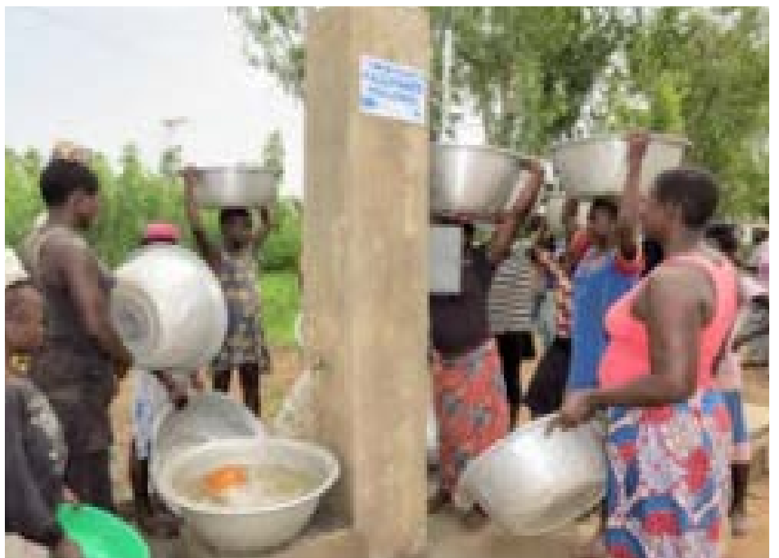
Une pompe publique d'eau potable

Le sous-secteur de l'élevage a été fortement impacté de 2011 à 2020. Durant la décennie, les revenus de 80 000 éleveurs ont été améliorés de 50% grâce à une bonne