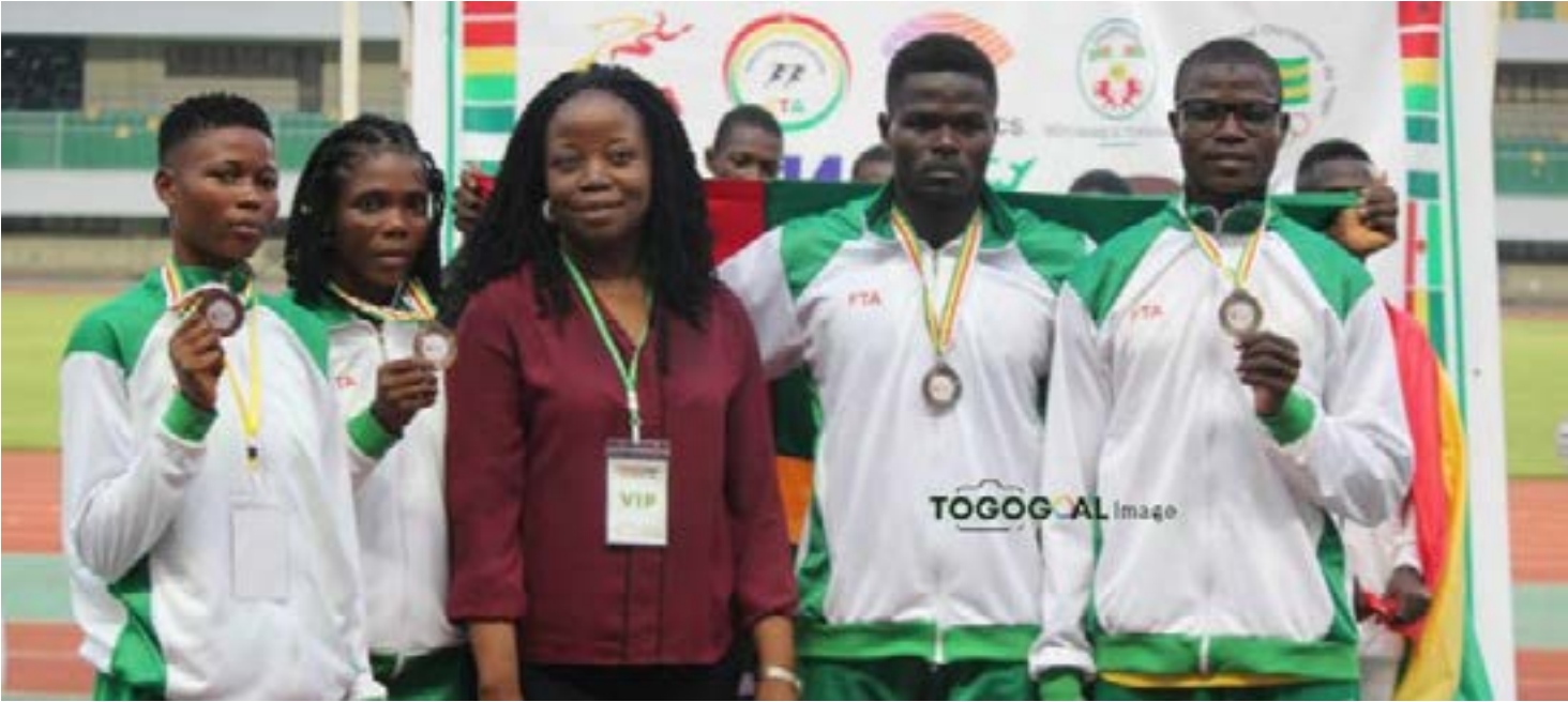
Des athlètes togolais