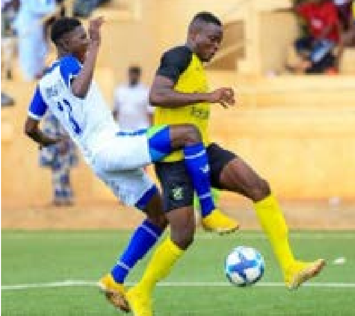
Action de match championnat D1