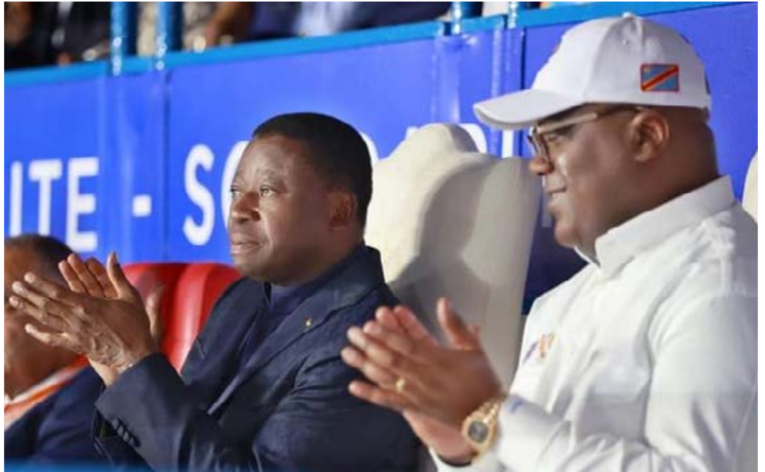
Faure Gnassingbé (à gauche) et son homologue Félix Tshisekedi

francophones dont des Togolais vont concourir dans plusieurs disciplines sportives et culturelles. 19 artistes de tout genre et 14 athlètes sont allés défendre les couleurs du pays, valoriser la culture et le sport togolais. Le 24 juillet 2023, le ministre de