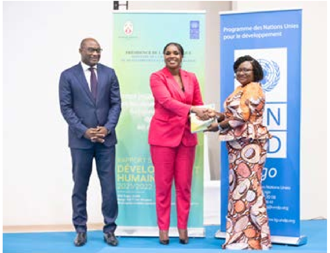
Le Pnud aux côtés du gouvernement

de 70 forages équipés de systèmes mini-adduction d'eau potable, la création de 19 centres communautaires, l'établissement de 10 unités de soins