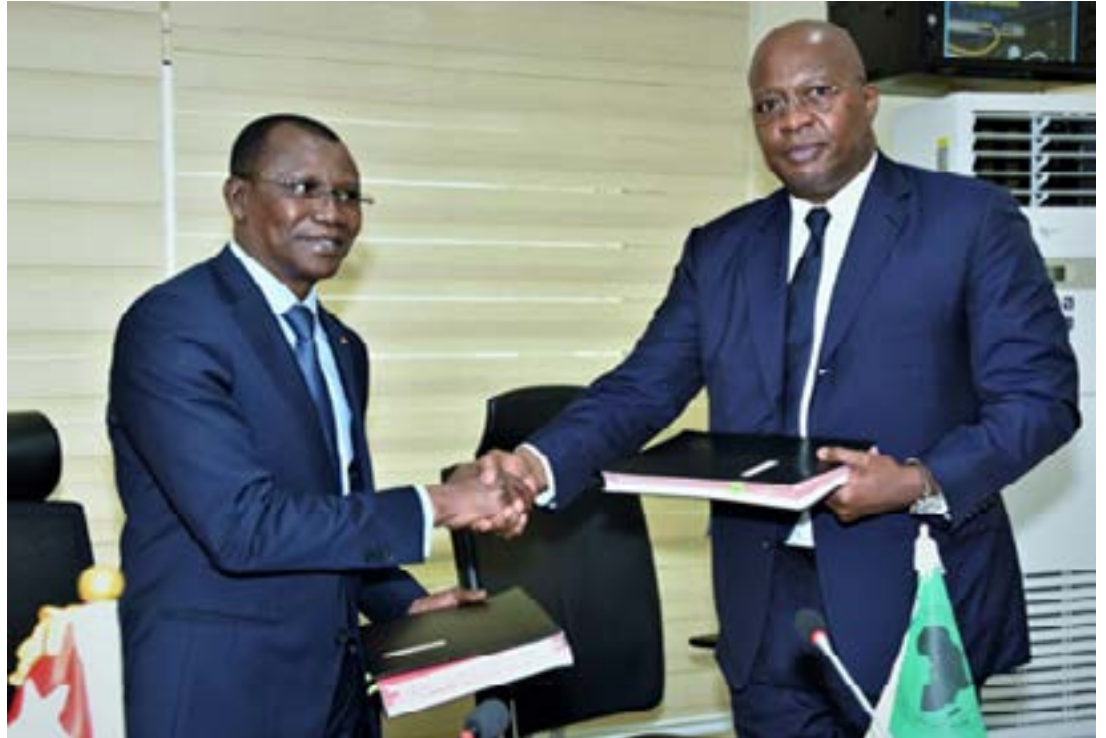
Accord de financement entre la BAD et le Togo

Ce financement de la Banque africaine de développement témoigne