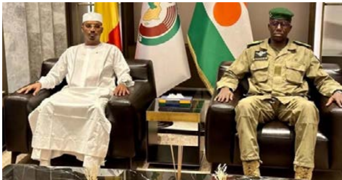
Le Gal. Mahamat Déby et le Gal. Salifou Mody, ancien chef d'état-major des armées du Niger et acteur clé de la Junte au pouvoir

Nouveau test grandeur nature pour Bola Tinubu, le nouveau président de la Communauté économique des Etats de l'Afrique de l'Ouest (Cedeao). A peine porté à la tête de cette institution qu'il est appelé à régler un nouveau coup de force au Niger. Et la démarche semble nouvelle, ou du moins, elle semble manifester un durcissement de ton et de méthode. En dehors des sanctions auxquelles la Cedeao nous a habitués, l'institution lance un ultimatum de 7 jours aux putschistes de Niamey pour rendre le pouvoir, et n'écarte pas l'option d'une intervention militaire pour les y obliger.