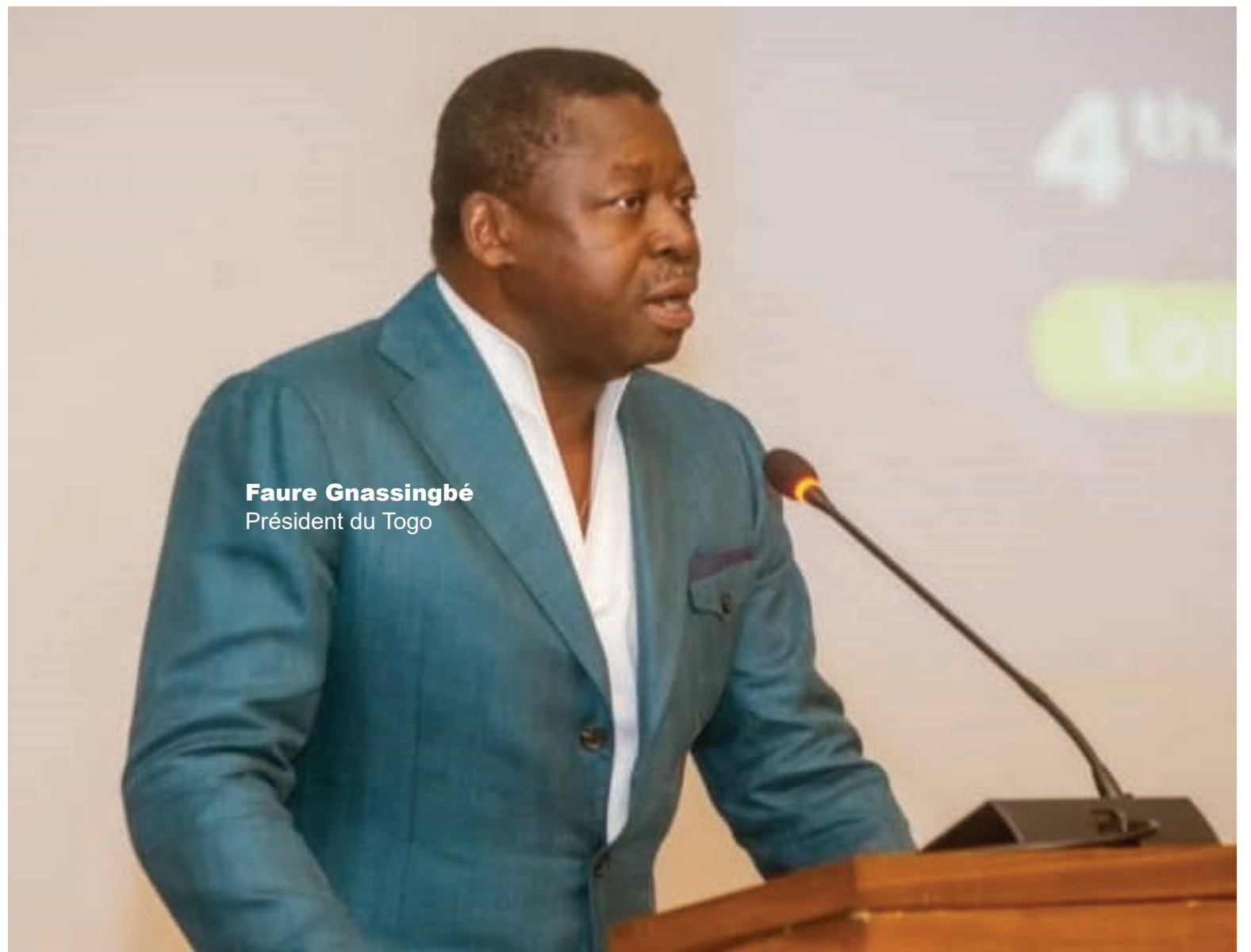
Faure Gnassingbé Président du Togo