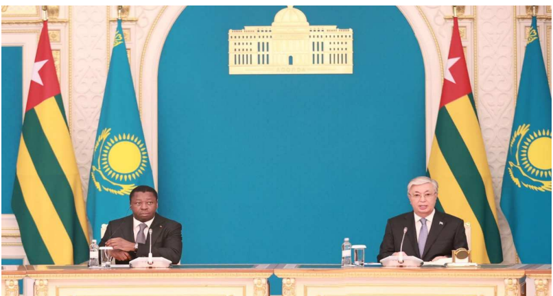
Tête-à-tête entre les leaders du Togo (g) et du Kazakhstan (dt)

Lors de sa visite dans ce pays, l'un des premiers pays producteurs de blé, du pétrole, de l'uranium, du gaz et des métaux, Faure Essozimna Gnassingbé a visité des sites industriels notamment le parc industriel Swiss-Grow, spécialisé dans la production des fertilisants, le complexe militaro-industriel (Kazakhstan Paramount Engineering) et Astana International Financial Centre (AIFC), un nouveau centre financier pour l'Asie centrale, le Caucase, l'Union économique