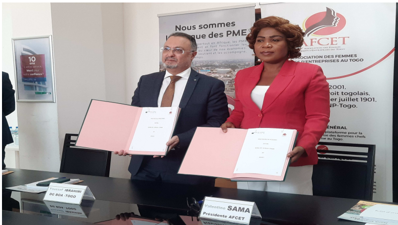
Photo après la signature

Cette signature de partenariat permet de rendre l'AFCT plus compétitive, grâce à des solutions de financement attrayantes mises en place par la BOA-Togo. Le partenariat, assorti d'un accord de financement d'un milliard FCFA pour accompagner les femmes entrepreneures au Togo, cadre parfaitement avec la vision de la BOA-Togo qui est de soutenir la