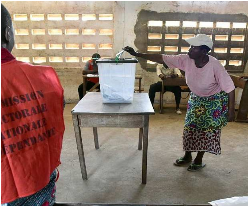
Une citoyenne accomplissant son devoir civique