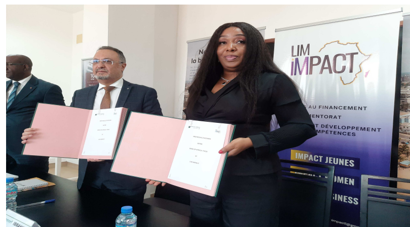
Echange de documents après la signature

Dans le cadre de notre stratégie d'ouverture aux PME, nous sommes en train de ficeler quelques partenariats avec plusieurs associations, notamment les associations de femmes. A travers Lim impact, on cible des petites et moyennes entreprises qui ont des besoins de financement. Nous