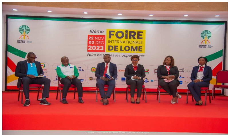
Une vue des panélistes

La gamme élargie de ses produits et services ne cesse de séduire la clientèle, en particulier les différents comptes d'épargne accessibles à toutes les bourses, à savoir EPARGNE CORIS, CORIS KID, CORIS DADA, CORIS KDO, CORIS LEADER, CORIS DIASPORA et CORIS ACADEMIA ; mais également des crédits à des taux très attractifs, dont le Prêt fêtes à Taux zéro, qui est actuellement en cours jusqu'au 31 janvier 2023. On note également sa solution de Monnaie Electronique " Coris Money " déployée depuis le mois de juillet dernier et la finance participative, à travers sa solution de Finance