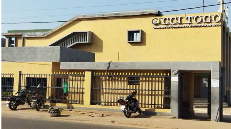
Le siège de la Cci

Concrètement, les futurs électeurs doivent être des opérateurs inscrits au Registre du commerce et du crédit mobilier (RCCM), être en règle avec l'administra-