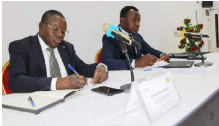
La table d'honneur

Pour l'année 2024, l'OTR se fixe des objectifs encore plus ambitieux, avec une contribution attendue de 48% du budget national, soit 1.042,1 milliards FCFA. Pour y parvenir, l'OTR envisage d'élargir l'assiette fiscale, d'améliorer le contrôle fiscal et douanier, de rationaliser