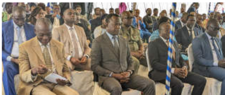
Vue partielle des officiels

fournissant un espace accueillant pour les contribuables. Les installations comprennent des bureaux de recouvrement et de déclaration, des salles d'attente et de réunion, une caisse pour le versement des impôts et taxes, ainsi qu'un secrétariat général pour le dépôt et le re-