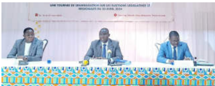
La table d'honneur

« Nous attendons de vous (Maires, élus locaux et autres acteurs impliqués, ndlr) un accueil équitable et une gestion impartiale de toutes les activités devant meubler les élections, une sensibilisation et une forte participation de tous les citoyens aux échéances annoncées et surtout une gestion apaisée qui permet de consolider et de renforcer le tissu social, la paix et la sécurité comme l'a toujours voulu le chef de l'État et surtout que nous sommes dans un environnement sécuritaire menacé par l'extrémisme violent et le terrorisme. Vous êtes appelés à jouer efficacement votre rôle tout au long du processus et surtout au cours de la campagne électorale d'autant plus que c'est une période tendue et chaque responsable doit se rendre disponible