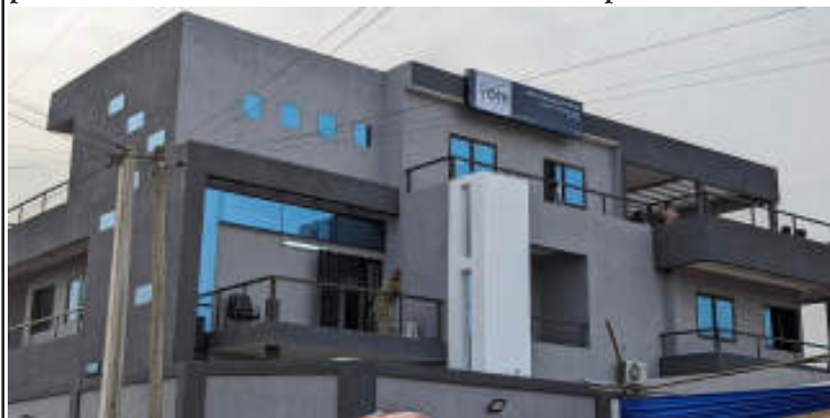
Le nouveau local inauguré

La division des opérations fiscales du Golfe 2 (Hédzranawoé) franchit une nouvelle étape dans son engagement envers les contribuables togolais en inaugurant ses nouveaux locaux, offrant ainsi un cadre moderne et accessible pour les services fiscaux. L'Office togolais des recettes (OTR) a dévoilé ce bâtiment flambant neuf lors d'une cérémonie d'inauguration le jeudi 7 mars 2024 en présence du Commissaire Général de l'OTR, Philippe Kokou Tchodié marquant ainsi un pas de plus vers des services fiscaux efficaces et transparents.