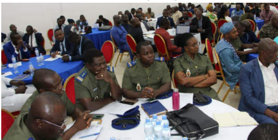
Vue partielle des agents de l'OTR

Awards a décerné un prix spécial à l'OTR en tant que meilleur service public digital.