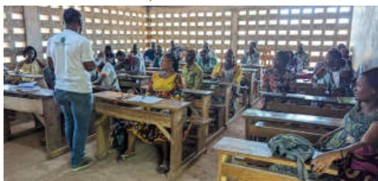
La causerie débat

vant des solutions aux problèmes rencontrés dans leur pratique quotidienne. Le fondateur de l'école la Cité du Savoir à la fin de ladite rencontre a exprimé sa satisfaction quant aux résultats de cette initiative, soulignant l'importance de comprendre les élèves pour mieux les enseigner.