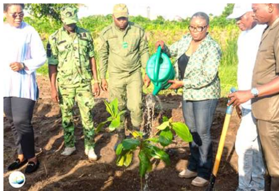
Mmes Victoire Tomégah-Dogbé, Yawa Djigbodi Tségan et Yawa Kouigan, le 1 er juin

Lomé. Justement, le ton de la nouvelle campagne a été donné sur ce site par le Premier ministre, Victoire Tomégah-Dogbé, qui y a mis en terre un plant de Terminalia catappa ou Badamier. Elle a été suivie dans ce geste par la Présidente de l'Assemblée nationale, Yawa Djigbodi Tségan, les ministres, les députés, le corps diplomatique, les ONG et les groupes organisés. «Ces plants (ndlr, Terminalia superba (Fraké), Terminalia catappa (Badamier),