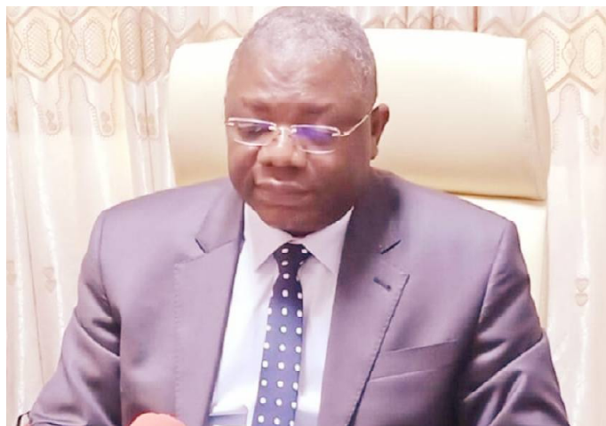
Pierre Kossi G. Lamadokou, Ministre du Tourisme et de la Culture

On précise que c'est la Commission Nationale d'Agrément et de Classement des Etablissements de Tourisme (CNACET) qui propose le classement des établissements. Les hôtels sont classés en étoiles et les restaurants en fourchettes. Les autres établissements sont justes agréés pour le moment. « Les établissements ne se trouvant pas sur cette base de données ne sont pas agréés ; ils exercent dans l'illegalité », fait savoir le ministère de la culture et du tourisme. Pour figurer dans la liste des établissements, il faut suivre une procédure réglementaire. Le promoteur adresse une demande d'agrément au ministre en charge du tourisme, la Commission Nationale d'Agrément et de Classement des Etablissements de Tourisme (CNACET) étudie le dossier de demande, elle effectue une visite technique de l'établissement. Le paiement d'une redevance selon le classement de l'établissement est requis. Le ministre prendra à la fin, un arrêté portant délivrance d'un agrément (licence d'exploitation) pour une période de validé de cinq (05)