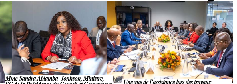
Mme Sandra Ablamba Johnson, Ministre, SG de la Présidence du Conseil et Gouverneur du Togo auprès de la Banque mondiale

Au niveau de la Banque mondiale, ce sont des projets structurants qu'elle accompagne dans le pays dans plusieurs domaines clés, notamment l'énergie (électrification rurale, infrastructures) ; l'agriculture