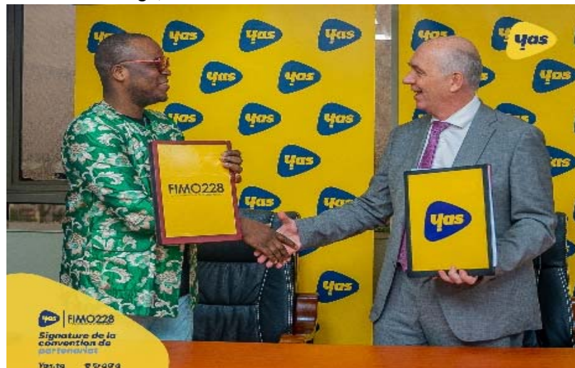
Echange de documents après la signature