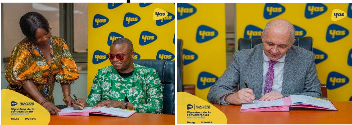
Signature du protocole d'accord par les deux parties

ration vise une fois de plus à renforcer la structuration dudit festival, à accroître sa portée internationale et à pérenniser ses actions au bénéfice de la jeunesse togolaise et africaine. " Yas Togo