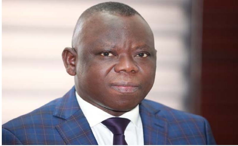
Jean-Marie TESSI, Ministre de la Santé, de l'Hygiène publique, de la Couverture Sanitaire Universelle et des Assurances.

Le PNDS 2023-2027 est structuré en 5 axes stratégiques : le système de santé et santé communautaire ; l'utilisation des services essentiels de santé, y compris la nutrition par les mères, les enfants, les jeunes et adolescents et les personnes âgées ; la lutte contre les maladies et la maîtrise des déter-