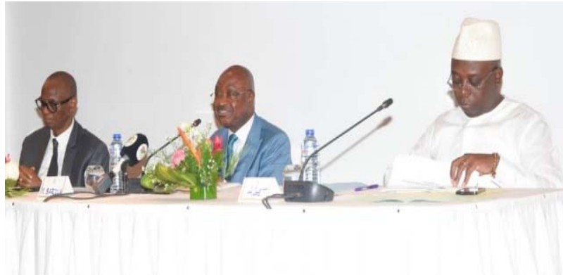
Le ministre des finances Essowè Barcola (au milieu)

Les autorités ont également relevé la mise en place de réformes pour accélérer les remboursements de crédits de TVA, afin d'alléger les charges financières des entreprises, l'étalement des droits d'enregistrement des marchés publics pour les