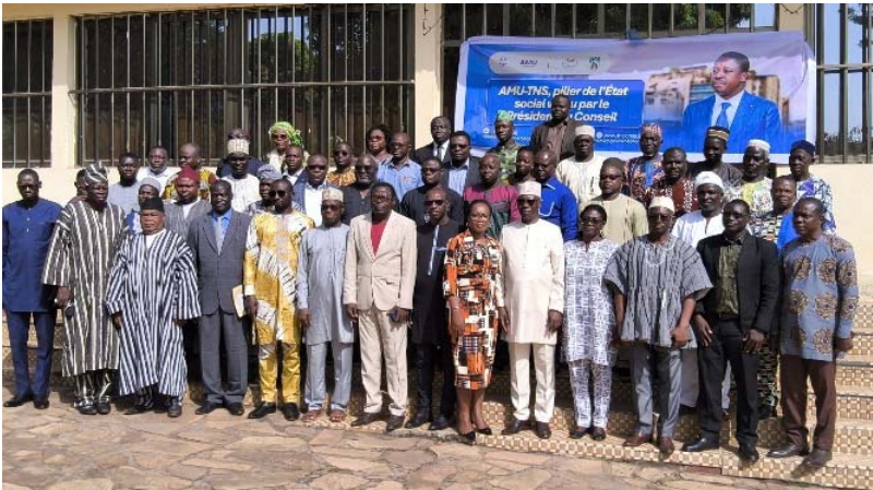
Les participants à la rencontre de sensibilisation sur l'AMU-TNS à Sokodé

Placée sous le thème " Ne laisser personne de côté ", elle vise à informer, sensibiliser et accompagner les travailleurs de l'économie informelle à adhérer à ce mécanisme de solidarité nationale par lequel le Togo inscrit une nouvelle page dans l'histoire sociale de l'Afrique. Le pays devient ainsi le tout premier pays africain à lancer une assurance maladie dédiée aux travailleurs non-salariés. Une avancée majeure, presque révolutionnaire, qui ouvre la voie à une protection plus équitable, plus inclusive et, surtout, plus humaine pour des millions d'acteurs