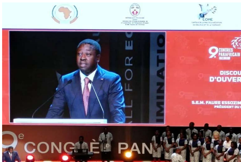
Le Président Faure Gnassingbé lors de son allocution

Togo a porté le noble et immense chantier d'organisation du 9 e Congrès panafricain. La volonté combinée du Président du conseil, les chefs d'État et de gouvernement de l'Union africaine des Caraïbes de la commission de l'Union africaine ont permis aujourd'hui de tenir ce congrès.