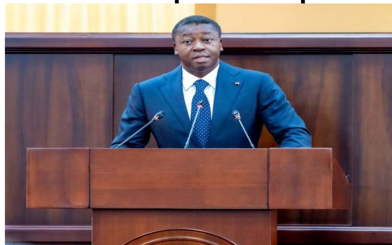
Faure Gnassingbé, Président du Conseil

Faure Gnassingbé a indiqué que, fidèle à l'esprit de la réforme, l'action de son Gouvernement s'organisera autour de trois axes majeurs: la protection des Togolais, la souveraineté du Togo et son rayonnement diplomatique : c'est la responsabilité de protéger ; la consolidation républicaine, la cohésion nationale et la décentralisation : c'est la volonté de rassembler ; et le développement économique et social : c'est l'ambition de transformer. " Alors que nous arrivons au terme de la Feuille de route gouvernementale 2025, ces trois axes s'inscrivent dans la continuité de notre action, mais aussi dans une ambition