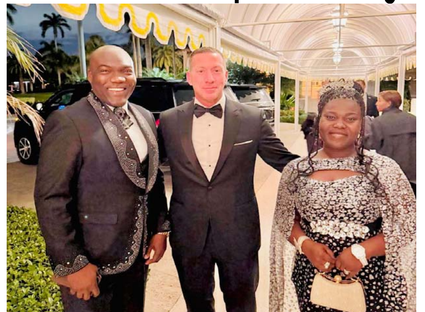
Ici avec le Directeur du service secret des ETats-Unis

Soulignons que durant cette soirée d'honneur dédiée aux vétérans américains, ils ont été conviés à conduire un moment de prière solennel, marquant la dimension spirituelle de l'événement et soulignant le rôle essentiel de l'interces-