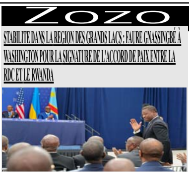
STABILITÉ DANS LA RÉGION DES GRANDS LACS : FAURE GNASSINGBÉ À WASHINGTON POUR LA SIGNATURE DE L'ACCORD DE PAIX ENTRE LA RDC ET LE RWANDA

Le chantier qui attire le plus d'attention reste celui de la voie de contournement de Sokodé. Lancé en janvier 2025 par le président du Conseil, Faure Essozimna Gnassingbé, le projet redéfinit les perspectives de mobilité dans la région. Longue de 16 kilomètres, la nouvelle voie partira de la RN1 à Tchalo, contournera la ville à l'ouest, croisera la RN17 sur l'axe Sokodé-Bassar avant de rejoindre la RN1 au niveau de Kidéoudé.