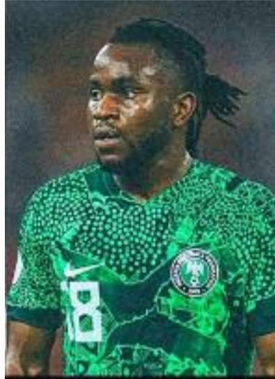
Les demi-finales Mercredi 14 janvier 2026 Sénégal – Égypte : 18h à Tanger Maroc – Nigeria : 21h à Rabat