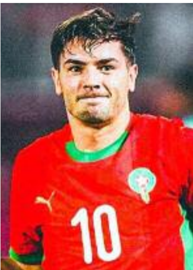
Les demi-finales de la CAN 2025 se tiendront le mercredi 14 janvier 2026, entre les cadors du football africain qui ont tous répondu présent. Les affiches des demi-finales de cette CAN 2025

Après les quarts de finale explosifs durant lesquels les meilleures équipes, qui ont été plus entreprenantes, se sont qualifiées, place désormais aux demi-finales qui seront crânement joués entre quatre équipes que beaucoup d'observateurs attendaient à ce stade bien avant le début de la compétition. Les quatre équipes qualifiées pour les demi-finales de la CAN 2025 sont le Maroc, le Nigeria, le Sénégal et l'Égypte. Le Maroc s'est imposé face au Cameroun 2-0 en quart de finale, tandis que le Nigeria a battu l'Algérie 2-0 pour rejoindre les demi-finales. L'Égypte s'est également qualifiée après sa victoire en quart contre la Côte d'Ivoire, et le Sénégal a validé sa place après son succès face au Mali.