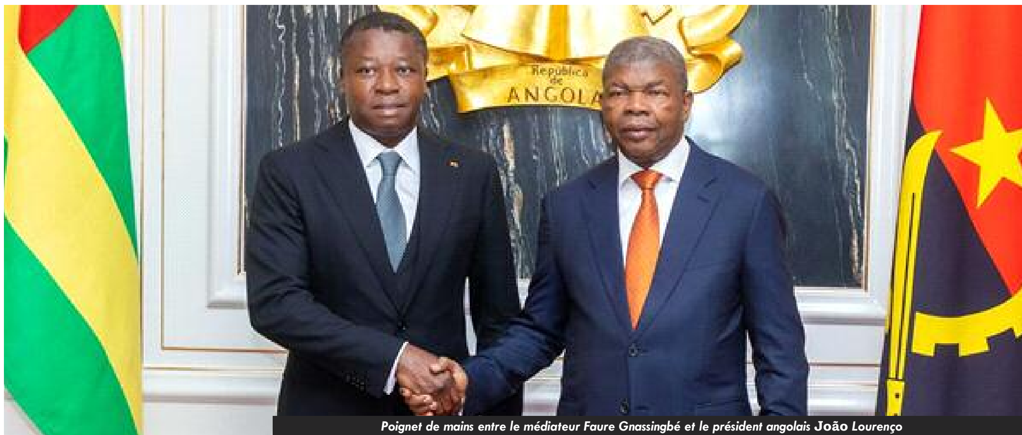
Poignet de mains entre le médiateur Faure Gnassingbé et le président angolais João Lourenço