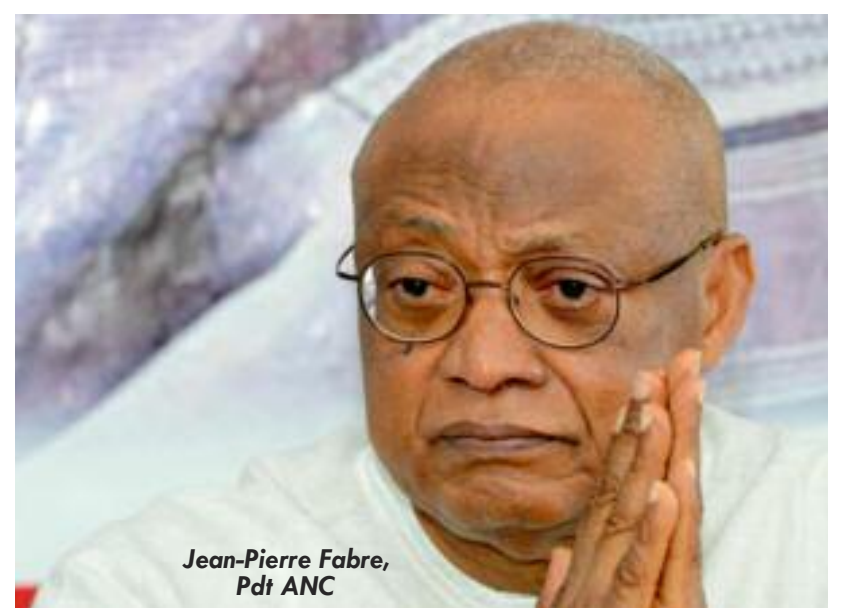
Jean-Pierre Fabre, Pdt ANC

L'Alliance nationale pour le changement, à l'image d'autres partis politique de l'opposition traverse des crises existentielles. Cette situation est marquée par des divisions profondes nées des choix du premier responsable. Participer ou ne pas participer aux élections ? Une question qui a profondément bouleversé la vie des formations politiques