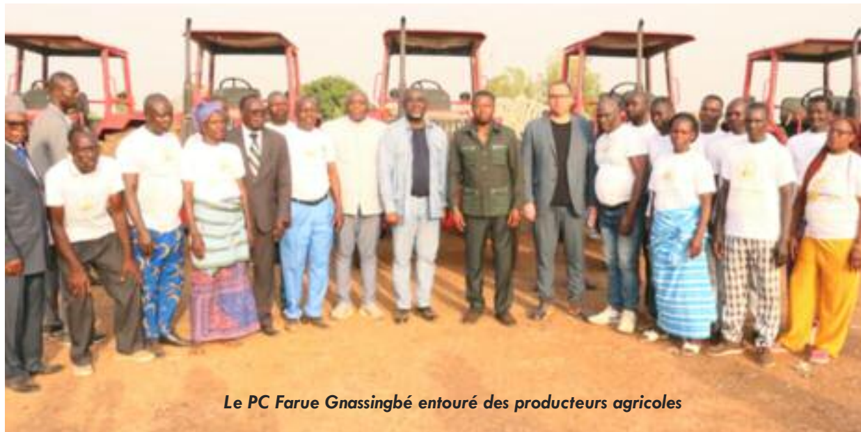
Le PC Farue Gnassingbé entouré des producteurs agricoles

lutions pour accélérer le développement du secteur agricole dans une démarche inclusive. "Ces rencontres ont pour finalité d'identifier ensemble des solutions aux défis auxquels les Togolais sont confrontés. Le gouverne-