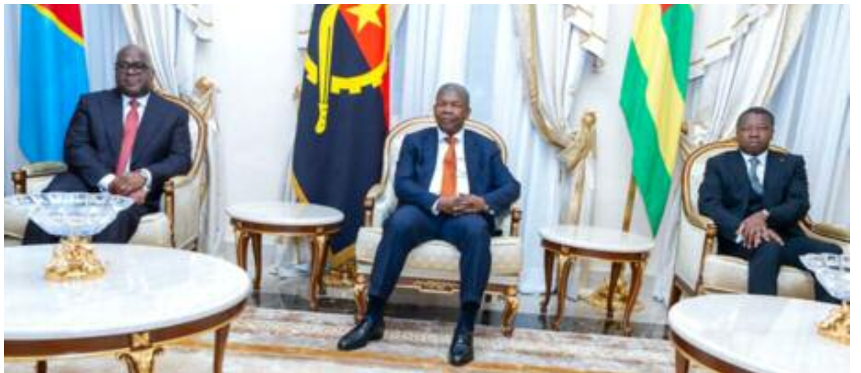
Félix Tshisekedi de la RDC, Lourenço de l'Angola et le médiateur Faure Gnassingbé

Nigéria Olusegun Obasanjo, président du collège des facilitateurs de l'Union Africaine, les deux dirigeants (togolais et angolais) ont eu des entretiens avec le président congolais Félix Antoine Tshisekedi, consacrés à l'intégration régionale ainsi que les voies et moyens à mettre sur pied pour mettre fin à l'instabilité chronique dans les Grands Lacs et trouver une paix durable dans la