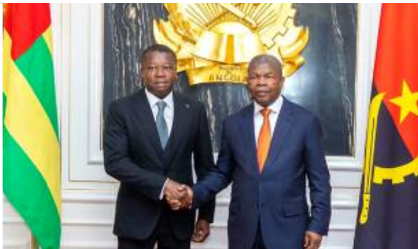
Poignet de mains entre le médiateur Faure Gnassingbé et le président angolais João Lourenço

Avant le déplacement d'Entebbe, la semaine dernière et toujours dans la même dynamique de ramener définitivement la paix dans la région, le Président du Conseil et Médiateur de l'UA, Faure Gnassingbé a poursuivi ses consultations à Kigali avec le président rwandais, Paul Kagame ensuite avec le président burundais Évariste Ndayishimiye au Burundi. Ces initiatives diplomatiques du médiateur Faure visent à