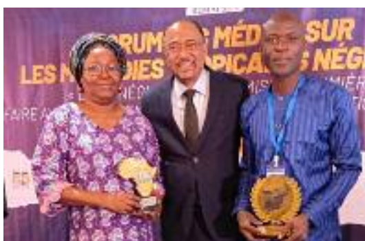
Les 2 lauréats togolais du prix Michel Sidibé