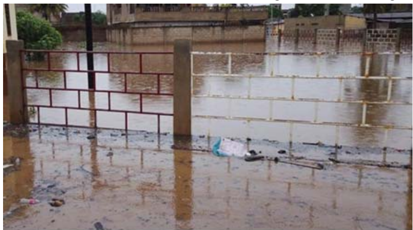
Bassin Attiomé derrière AIGE-Golfe 1

Plusieurs quartiers et quelques rues ont été inondés, les eaux s'étant retirées progressivement, décès par noyade d'un enfant de 03 ans au quartier Nukafu, plusieurs dégâts matériels enregistrés (vêtements, documents scolaires, biens alimentaires, habitations etc.), quelques bassins ont malheureusement débordé. Cependant, le système de pompage était fonctionnel, avaient constaté les spécialistes. Tels étaient