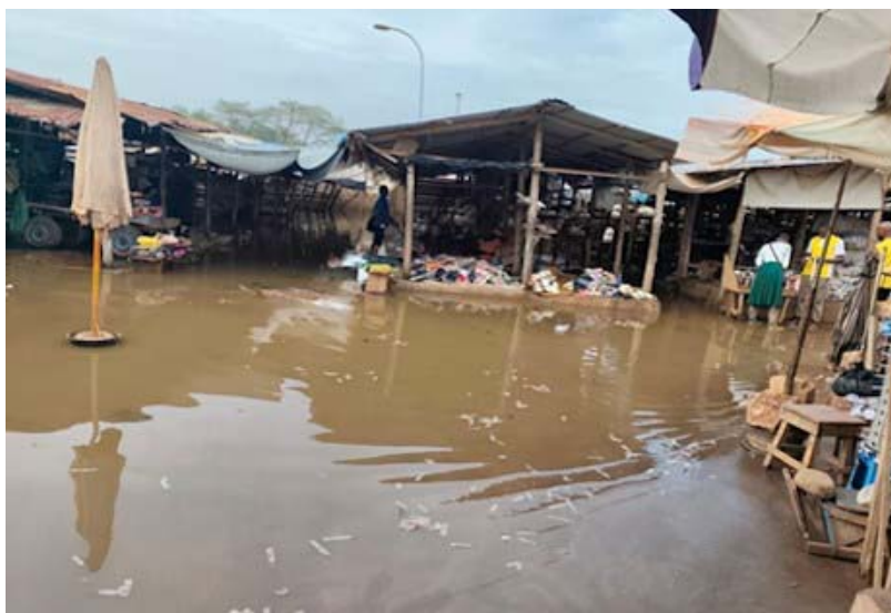
Marché de Hédzranawoé-Golfe 2

annonçait en termes de prévision, une situation normale à tendance excédentaire les 28, 29 et 31 mars 2026, avec environ 1011,3mm de pluies. Le 28 mars 2026, à la suite des fortes pluies, huit (8) Bassins ont débordé. Il s'agit des bassins Caméléon, Léo 2000, 13 janvier, Babakopé, Attiomé, Hédzranawé, Ségbé et Agoè-Assiyéyé.