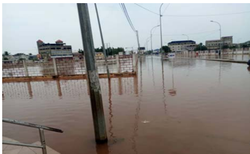
Le Bassin de 2 Lions-Golfe 5

En termes de mesures urgentes de réponse, suite aux pluies des 28, 29 et 31 Mars 2026, l'Agence