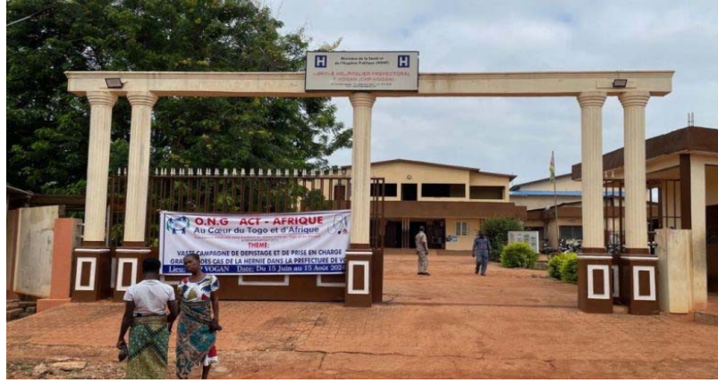
Entrée Centre hospitalier (CHP) de Vogang

C'est aussi le cas dans la préfecture de Yoto où les indicateurs sanitaires du district de Yoto sont au beau fixe. Les services sont mieux struc-