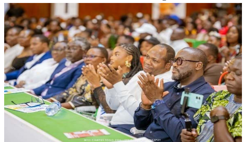
Une vue de l'assistance