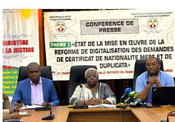
La table d'honneur

Dans les prochaines étapes, des campagnes régionales de sensibilisation sont prévues afin d'accompagner les citoyens dans l'appropriation de la plateforme.