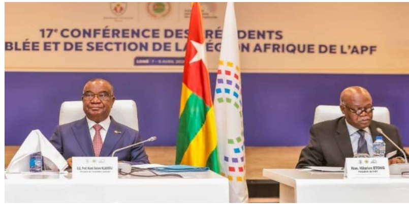
Komi Selom Klassou, Pdt de l'Ass.Nat du Togo et Hilarion Etong, Président de l'APF

La Conférence a, par ailleurs rappelé les principales dispositions du nouveau Règlement de la Région Afrique adopté à Cotonou (Bénin), à l'occasion de la 31ème Assemblée régionale Afrique qui s'est tenue du 2 au 4 juin 2025 ; encouragé la participation active des sections africaines aux activités statutaires de l'APF prévues en 2026 ; invité les sections à honorer leurs engagements financiers au titre des cotisations et adopté une position consensuelle en faveur de la can-