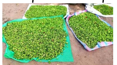
Du piment frais

En mars 2026, l'IHPC au Togo s'est établi à 104,5. Ce niveau d'indice, comparé à la situation de mars 2025 (glissement annuel) a progressé de 1,6%. Selon Institut National de la Statistique et des Études Économiques et Démographiques (INSEED), cette évolution s'explique par l'effet de la hausse observée au niveau de l'indice des divisions de consommation "Logement, eau, électricité, gaz et autres combustibles" (+8,0%) ; "Restaurants et services d'hébergement" (+4,0%) ; "Produits alimentaires et boissons non alcoolisées" (+0,6%) ; "Santé" (+1,7%) ; "Soins personnels, protection sociale et biens divers" (+0,9%) et "Transport" (+0,3%).