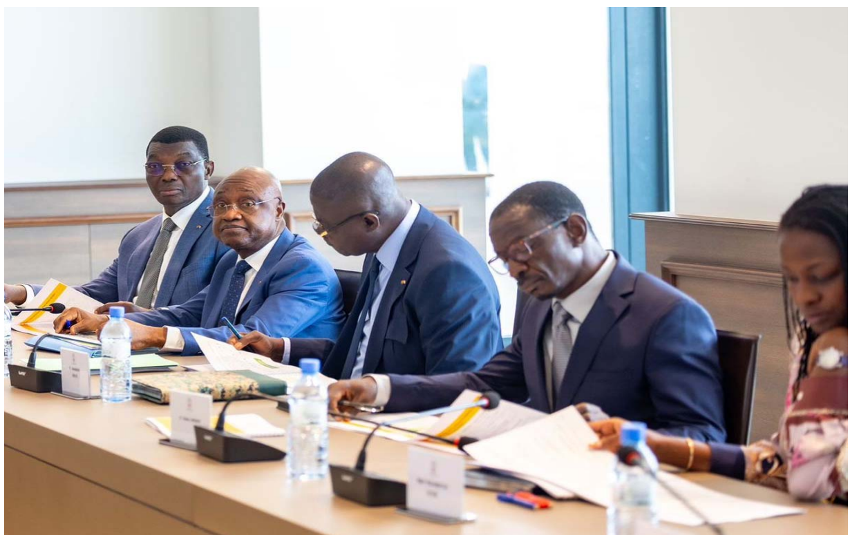
Une vue des ministres lors des travaux

Le nouveau cadre stratégique devra s'appuyer sur les principes directeurs suivants : une sélectivité accrue dans le choix des priorités, en concentrant les ressources sur les actions à fort impact pour les populations; une cohérence intersectorielle, en rompant avec la logique de silos sectoriels et en privilégiant