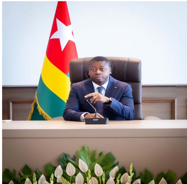
Le Président du Conseil, GFaure Gnassingbé a présidé les travaux

Ainsi, sur la base des enseignements tirés du bilan de la Feuille de route 2020-2025, de l'analyse de la conjoncture internationale et des orientations définies par le Président du Conseil, il a été officiellement lancé le processus de formulation des programmes de la Feuille de route gouvernementale 2026-2031, articulée autour des trois (3) axes stratégiques précédemment énoncés: