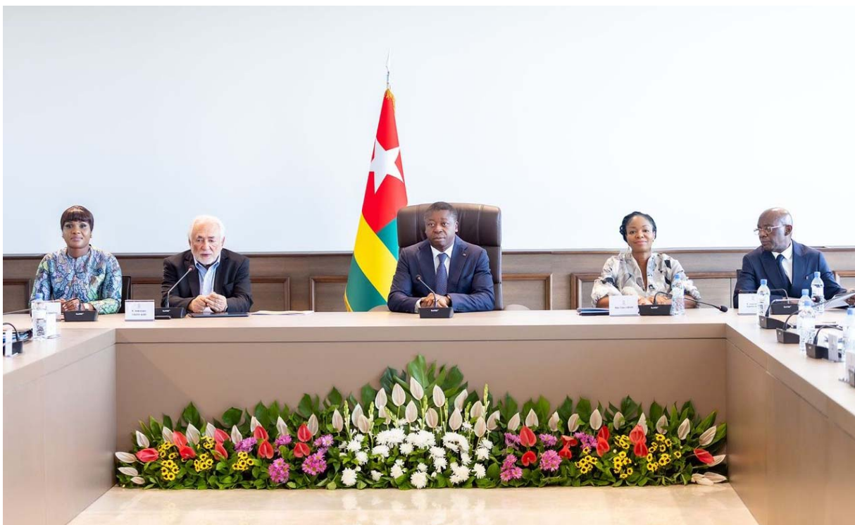
Le Président du Conseil, Faure Gnassingbé (au milieu) lors des travaux

À travers cette initiative, le Gouvernement, sous le leadership du Président du Conseil, réaffirme sa détermination à poursuivre les réformes structurelles engagées, à renforcer l'efficacité de l'État et à consolider une gouvernance stratégique orientée vers des résultats tangibles .