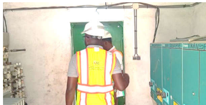
L'équipe de contrôle de l'ARSE autour des équipements de la CEET

Pour la CEET, par ailleurs vivement critiquée depuis quelques semaines à cause des coupures intempestives de l'électricité, le travail de l'ARSE a touché 24 agences dans le Grand Lomé, les Savanes, la Kara, la Centrale, les Plateaux et la Maritime. Dans ces agences, il a consisté à contrôler les registres physiques et les bases de données numériques de la CEET, en vérifiant les délais d'établissement des devis, de réalisation des branchements, de traitement des réclamations et de dépannage chez les clients. Et c'est là qu'il est indiqué que, en 2024, le contrôle a permis de relever que le délai moyen de dépannage chez les clients était de 11,68 heures (11,01 heures en 2023) contre une cible de 4,60 heures fixée dans le contrat de performance signé entre l'Etat et la CEET pour la période 2023-2024 ; que le délai moyen de réalisation des branchements observé dans les 26