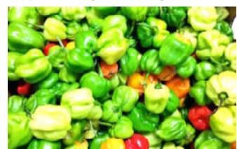
Le prix du piment vert (gboyébessé) a explosé, à +96,7%

de prix des produits du secteur «tertiaire» (+2,0%), «primaire» (+2,9%) et «secondaire» (+0,7%) a contribué à la hausse annuelle du niveau général des prix. Du point de vue de la durabilité, la hausse du niveau général des prix en évolution annuelle est principalement induite par la progression du niveau des prix des «services» (+2,0%) et des produits «non durables» (+1,6%). Par rapport à l'origine, la progression an-