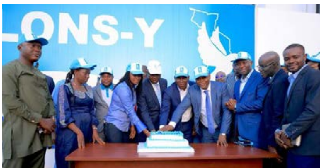
Coupe du gâteau par les membres du MJU et les premiers responsables du parti

Placée sous le signe de l'engagement et du renforcement des capacités de la jeunesse, cette rencontre a été marquée par deux panels thématiques. Le premier a porté sur l'entrepreneuriat et le volontariat, mettant en lumière les opportunités offertes aux jeunes ainsi que leur rôle dans le développement socio-économique du pays. Le second panel s'est concentré sur l'utilisation