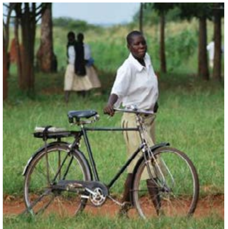
Une élève sur le chemin de l'école

développement. Malgré cette tendance générale, certains pays maintiennent leurs engagements. Le Luxembourg, la Norvège, la Suède et le Danemark dépassent la cible de 0,7 % du revenu national brut consacrée à l'aide.