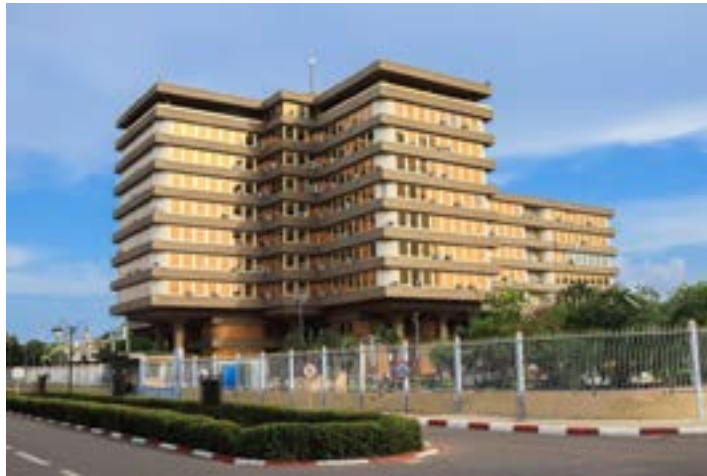
Le président du Conseil remettant du matériel de mécanisation agricole

En amont, des institutions comme la Cellule nationale de traitement des informations financières (Centif) pour la lutte contre