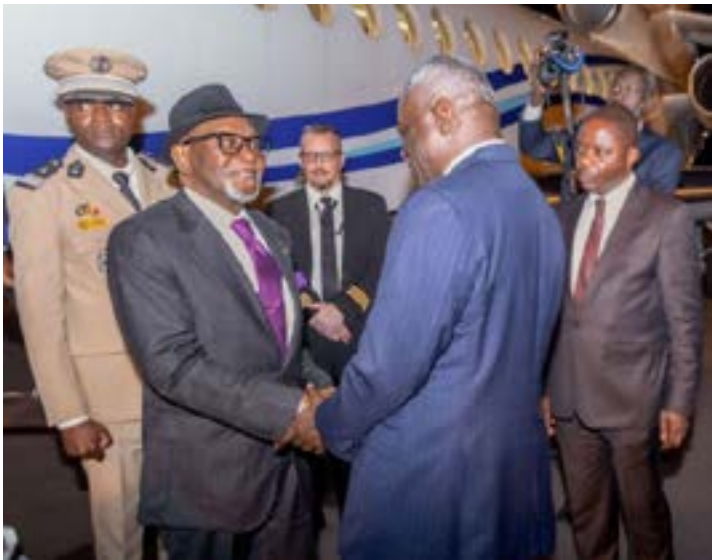
Jean Lucien Savi de Tové à sa descente d'avion (à gauche)

Le président de la République, Jean-Lucien Kwassi Lanyo Savi de Tové, est arrivé le mercredi 15 avril 2026 à Brazzaville pour prendre part à l'investiture du président congolais Denis Sassou N'Guesso, réélu à la magistrature suprême de son pays.