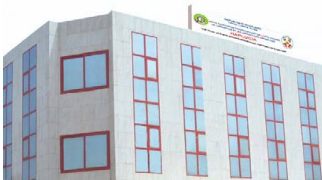
Faure Gnassingbé mettant une plante à terre

Dans son rôle de contrôle juridictionnel, la Cour des comptes juge les comptes des comptables publics, déclare les comptables de fait et sanctionne les fautes de gestion. Au niveau du contrôle de gestion, elle vérifie la régularité, l'efficacité et l'efficience de la gestion des administrations, des établissements publics et des entreprises publiques.