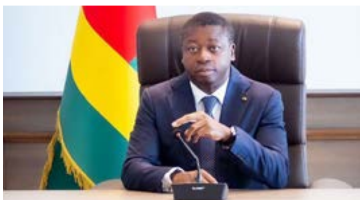
Faure E. Gnassingbé, président du Conseil des ministres

L'environnement régional et international connaît aujourd'hui de profondes perturbations et recompositions géopolitiques, marquées par la persistance des