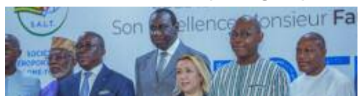
Les officiels: on reconnaît en costume à gauche, le DG de la SALT, Malik Natchaba et à droite le ministre des Transports, Comla Kadji

● Environ 1,6 million de passagers par an