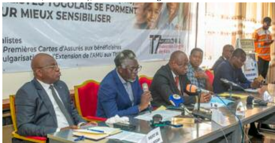
Les officiels lors de l'ouverture du séminaire

Elles ont annoncé la poursuite de ces sessions de