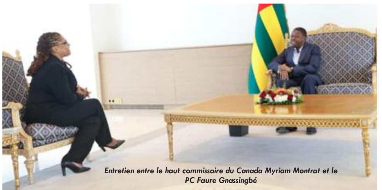
Entretien entre le haut commissaire du Canada Myriam Montrat et le PC Faure Gnassingbé

renforcement de ce partenariat. Les échanges ont également porté sur les questions de paix et de sécurité, des piliers essentiels pour la stabilité et l'attractivité du pays. Cette rencontre a offert l'occasion à Myriam Montrat de saluer les efforts du Togo en matière de consolidation de la paix dans la sous-région et sur