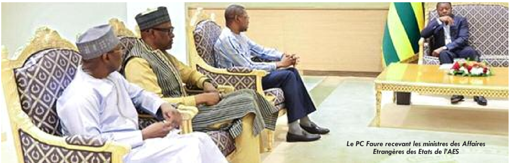
Le PC Faure recevant les ministres des Affaires Etrangères des Etats de l'AES