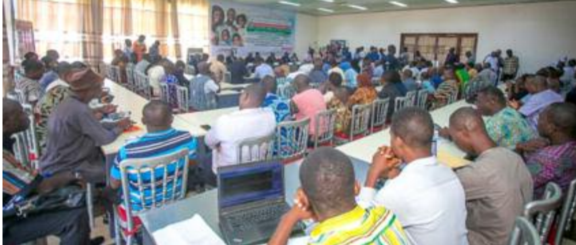
Les journalistes en pleine formation

vécues par certains professionnels confrontés à l'absence de couverture sanitaire. Il a, par ailleurs, exprimé la reconnaissance des organisations de presse au Président du Conseil pour son engagement en faveur du secteur. Pour finir M. Pouli a appelé les journalistes à être des relais