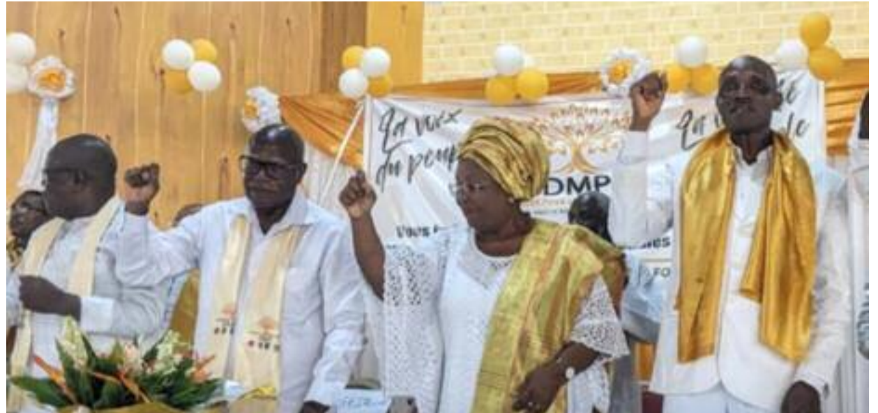
Les leaders de la DMP

décision après la participation aux travaux du Cadre permanent de concertation (Cpc) du désormais ex membre et ce, au mépris de la décision du regroupement de rester en retrait. La décision est donc sans équivoque, il est suspendu de toutes ses fonctions au sein de la Conférence des présidents et de toutes les activités de la Dmp. « Il n'est d'ailleurs plus autorisé à agir, à s'exprimer ou à engager la DMP de quelque manière