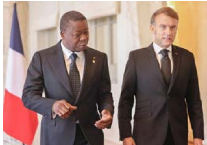
Le président du Conseil togolais Faure Gnassingbé (à gauche), et son homologue français Emmanuel Macron (Image d'archives)

Le Togo demeure attaché à une diplomatie d'ouverture, fondée sur ce principe simple : parler à tous, sans s'aligner sur personne. Dans un contexte international marqué par de profondes recompositions, le Togo