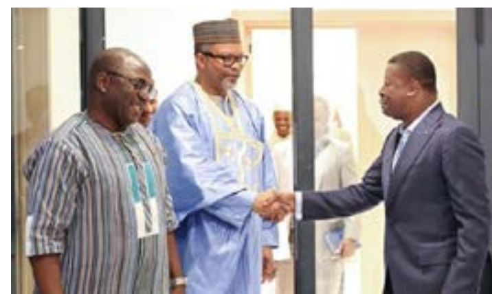
Faure Gnassingbé (à droite) saluant les personnalités reçues en audience

Pour sa part Bassolma Bazié a salué l'esprit de dialogue prôné par le Togo