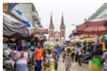
Grand marché de Lomé

Au Togo, la mobilisation des ressources fiscales reste en deçà des standards régionaux. Estimée à 13,1 % du Produit intérieur brut (Pib) en 2025, elle demeure inférieure au seuil communautaire de 20 % fixé par l'Uemoa. Ce constat intervient alors que le pays engage les travaux du cadrage budgétaire à moyen terme (CBMT) pour la période 2027-2029, un instrument destiné à renforcer la cohérence et la visibilité de l'action publique.