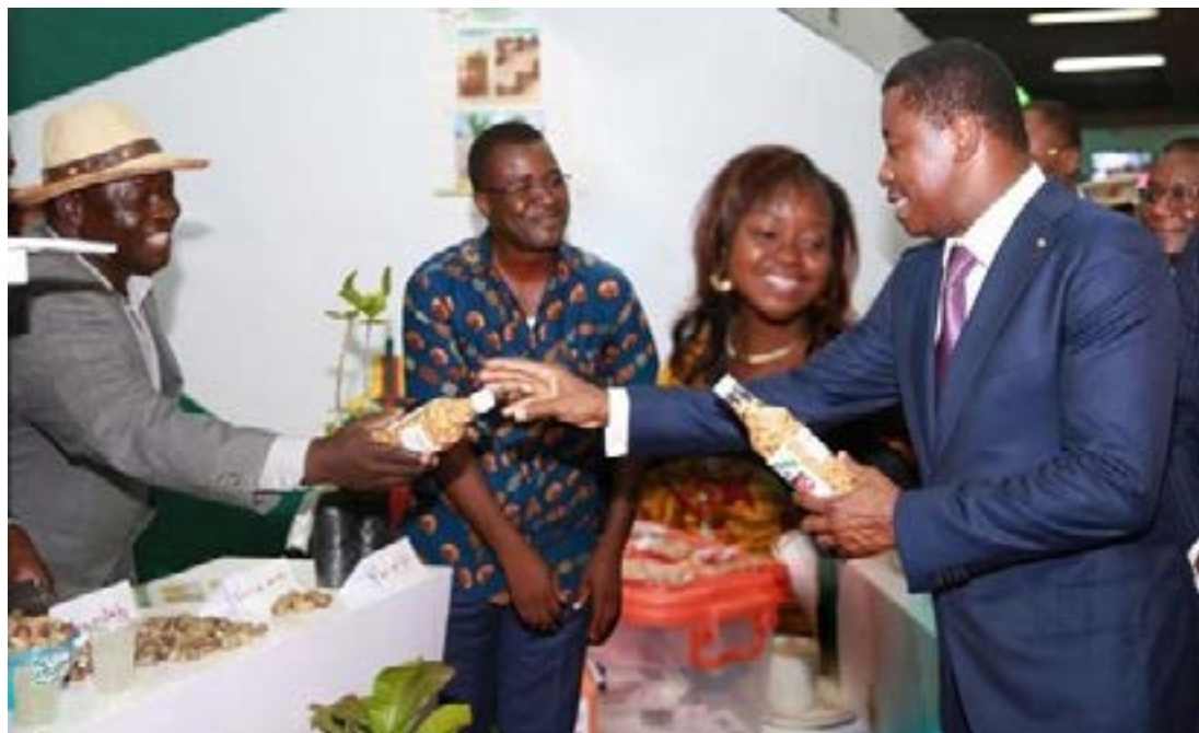
Le président du Conseil échangeant avec les entrepreneurs

inépuisable et une responsabilité majeure. La jeunesse représente un potentiel immense. Le pays demeure profondément marqué par cette couche de la population. En 2023, l'âge médian s'établit à 18,1 ans, révélant une réalité saisissante : qu'une personne sur deux a moins de 18 ans.