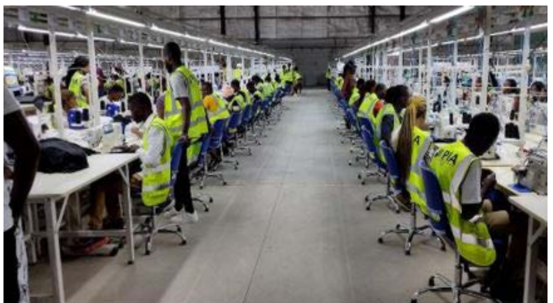
Usine textile à la PIA

Les 1 000 étudiants seront rémunérés dans les structures d'accueil pour le stage d'un mois. Aussi, le projet offre aux stagiaires une indemnité forfaitaire et une déclaration à la Caisse nationale de la sécurité sociale (CNSS)