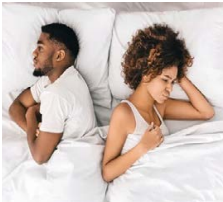
Ce couple n'est visiblement pas épanoui dans son intimité

sperme est-elle fréquente ? Non, elle est rare. Les irritations après un rapport sexuel et les infections locales sont beaucoup plus fréquentes. Peut-on être allergique au sperme d'un seul homme ? En général, non : il s'agit plutôt d'une réaction à des protéines du sperme, donc potentiellement avec n'importe quel homme.