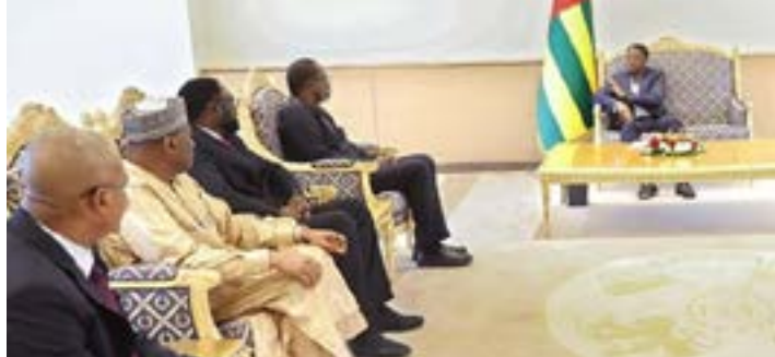
Faure Gnassingbé (devant au centre) et les différentes personnalités reçues en audience

ouest-africaine. Bien sûr, il y a des cadres institutionnels peut-être différents, mais nous allons continuer à œuvrer pour les peuples