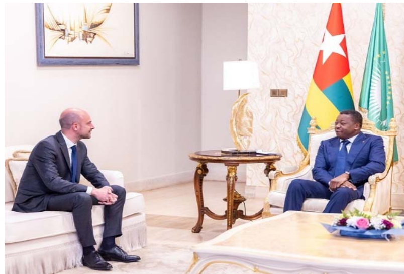
Echange avec le Président du Conseil

" Le Togo, sous l'autorité du Président Faure Essozimna Gnassingbé, mène une médiation très importante dans la région des Grands Lacs, sujet que nous avons également abordé, tout comme la situation au Sahel, qui suscite de vives préoccupations où le rôle du Togo demeure particulièrement déterminant ", a relevé le chef de la diplomatie française.