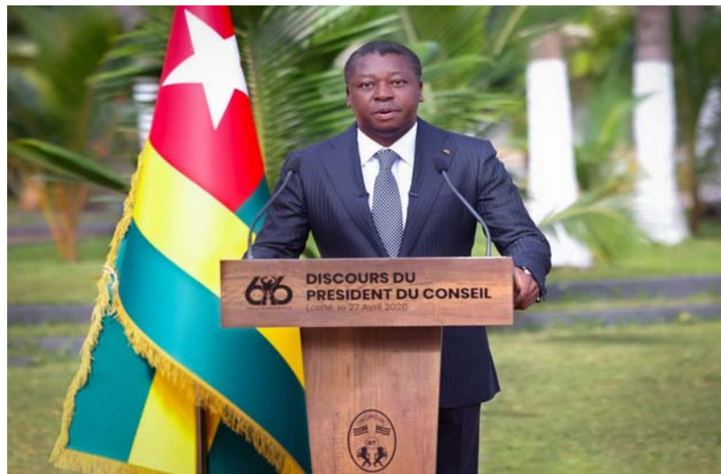
Faure Gnassingbé, Président du Conseil

Il a rappelé que la nouvelle étape repose sur trois exigences qui s'imposent à l'action du gouvernement : Protéger rassembler transformer. " Ce ne sont pas juste des mots ", a dit Faure Gnassingbé.