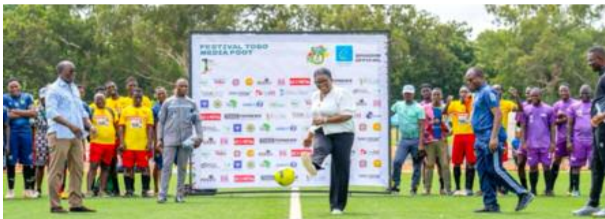
coup d'envoi symbolique donné par la ministre de la Communication, Yawa Kouigan