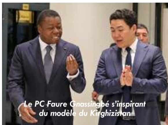
Le PC Faure Gnassingbé s'inspirant du modèle du Kirghizistan

talisation des services et l'intégration de solutions d'intelligence artificielle. Des avancées saluées par le Président du Conseil, qui y voit des pistes concrètes pour approfondir la collaboration entre les deux pays.