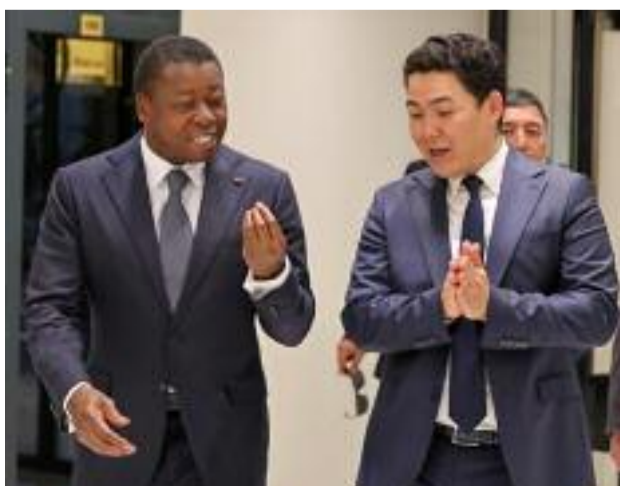
Le PC Faure Gnassingbé s'inspirant du modèle du Kirghizistan

Au Kirghizistan, Faure Gnassingbé s'inspire des réformes innovantes pour le Togo P.4