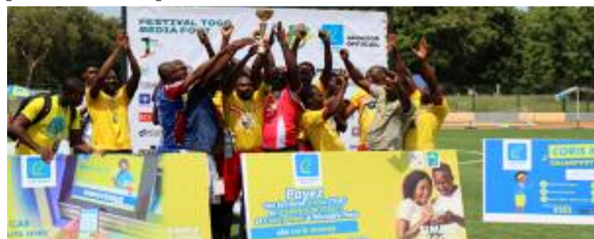
L'équipe d'Atoppel brandissant la coupe

ambitieuse, inclusive et rayonnante. Il lance, à cet effet, un appel aux entreprises, institutions, mécènes et partenaires pour pérenniser ce concept qui valorise le sport, renforce la cohésion de la presse togolaise et offre une grande visibilité nationale. Le Comité d'organisation invite toutes les bonnes