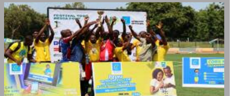
L'Equipe d'Atoppel brandissant la coupe

Le Comité d'organisation dresse le bilan et met le cap sur la 2ème édition P.3