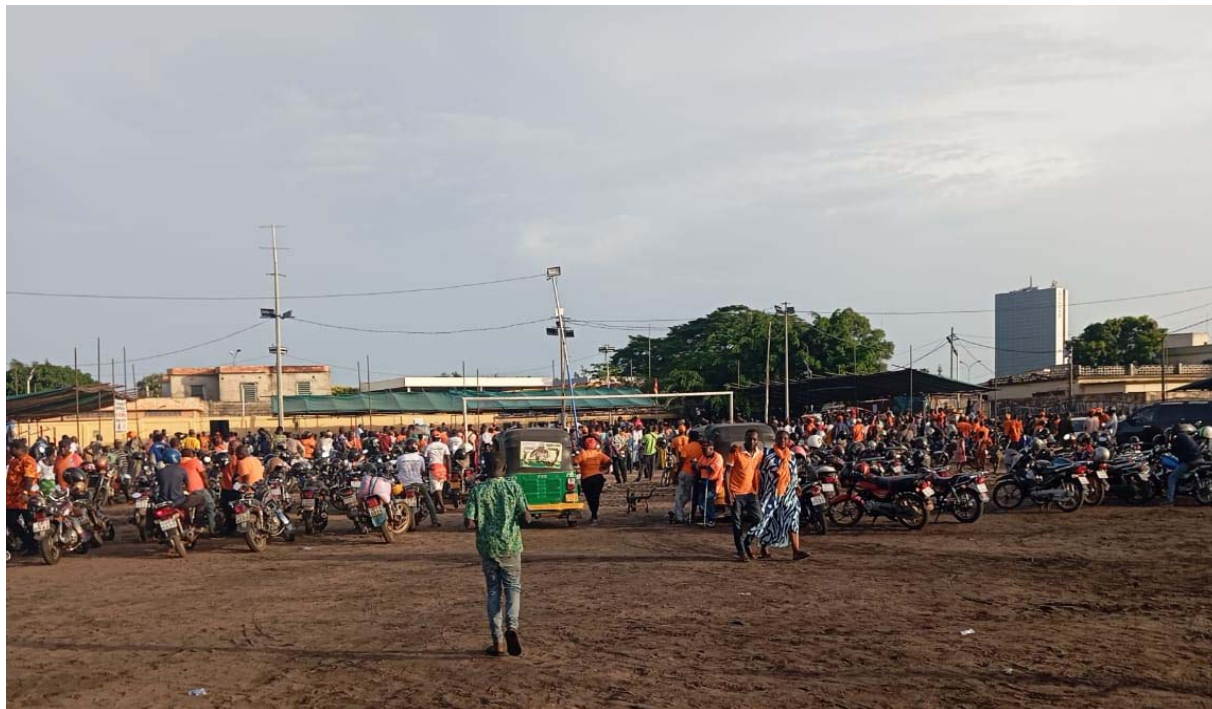
Une vue des manifestants

Espérant remobiliser les foules à l'issue de ce meeting et damer les pions à leurs pairs de l'opposition, aussi d'une autre époque, les leaders politiques du CNCC n'ont eu leurs yeux que pour pleurer en sourdine. Ils sont désormais très légers dans l'art de soulever la masse politique. Car n'inspirant plus confiance à leurs militants