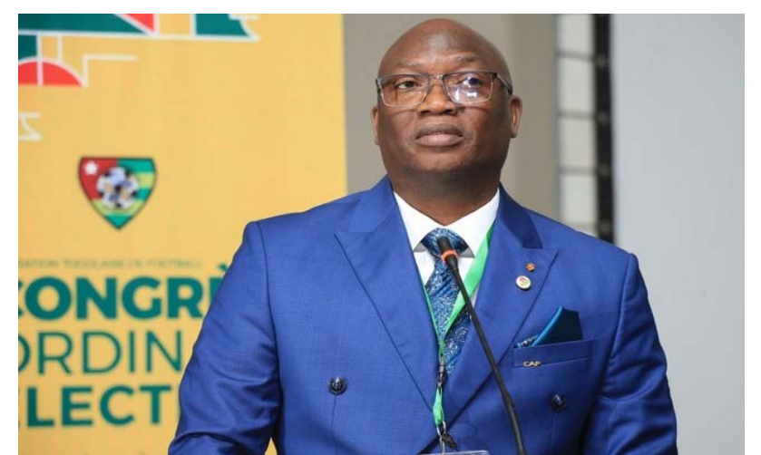
Col Guy Akpovy, président de la FTF

La participation du responsable de la FTF à cette rencontre confirme, en outre, l'implication du football togolais dans les principaux axes du football ouest-africain, ainsi que la détermination du Togo à prendre part concrètement au fonctionnement des instances régionales.