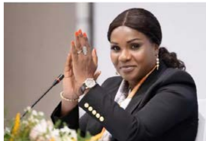
Sandra Ablamba Johnson, ministre, secrétaire de la présidence du Conseil

les cinq dernières années de mise en œuvre de la Feuille de route, l'on relève dans le domaine de la santé l'instauration de l'Assurance maladie universelle (Amu), qui aujourd'hui permet de toucher 4,4 millions de personnes. Des initiatives comme Wezou ont permis