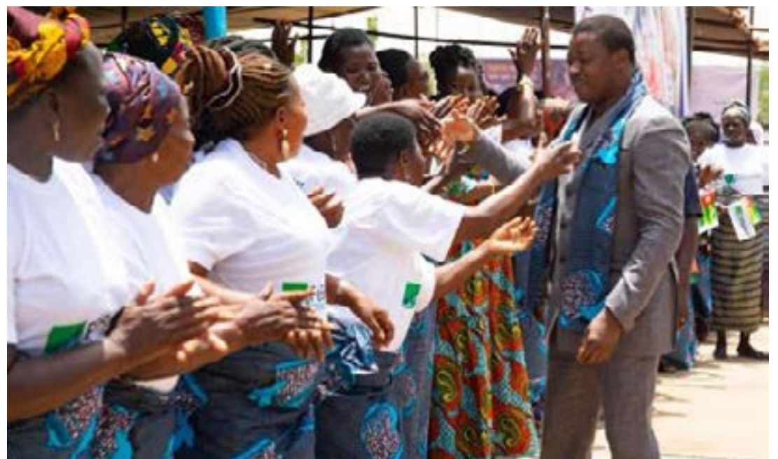
Le président du Conseil et les femmes bénéficiaires du FNFI

Pour promouvoir l'autonomisation, surtout celle des femmes, le Togo s'illustre par un effort constant d'amélioration du climat des affaires, reconnu à l'échelle régionale et internationale. La simplification des procédures au CFE, la digitalisation des démarches et la réduction des coûts de création d'entreprise ont contribué à rendre le parcours entrepreneurial plus fluide et plus inclusif. À travers le Comité de concertation entre l'État et le secteur privé (CCESP), le gouvernement maintient un dialogue permanent avec les opérateurs économiques afin d'adapter les réformes aux réalités du terrain. Cette approche collaborative renforce la confiance et favorise la durabilité des initiatives. Pour donner davantage de souffle aux femmes porteuses de projets, l'Agence nationale de