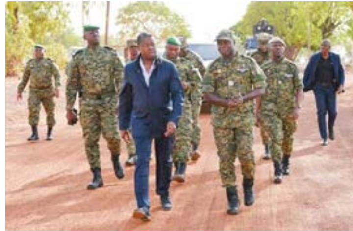
Faure Gnassingbé (devant à gauche)

au personnel de l'opération Koundjoaré pour le travail remarquable accompli. Il s'est également réjoui de