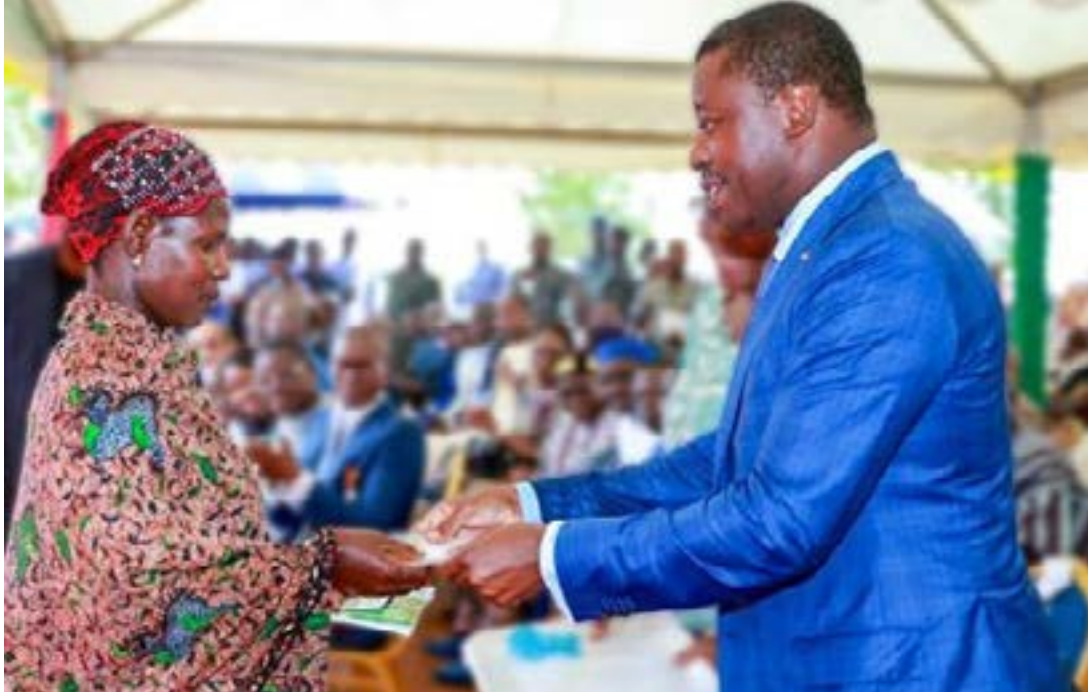
Le président du Conseil remettant une enveloppe financière

Avec une population constituée de plus de 51 % de femmes, le Togo fait de l'autonomisation des femmes son cheval de bataille. Processus par lequel les femmes acquièrent le pouvoir, la compétence et les ressources nécessaires pour contrôler leur vie, l'autonomisation féminine ne se limite plus au discours. Elle va plus loin et se concrétise dans les faits. En témoigne, le nouveau projet du gouvernement visant à autonomiser 1 500 jeunes filles, à travers des formations gratuites.