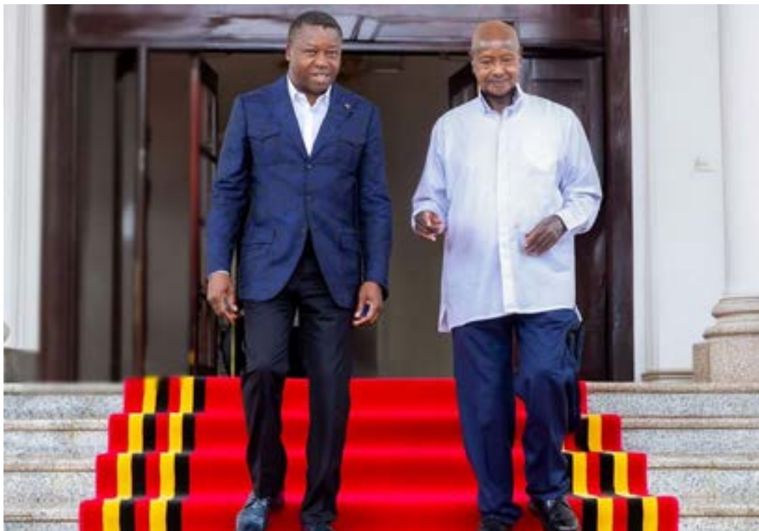
Faure Gnassingbé (à gauche) et Yoweri Museveni (à droite)

« Au plan régional et continental, le Togo et l'Ouganda se sont toujours