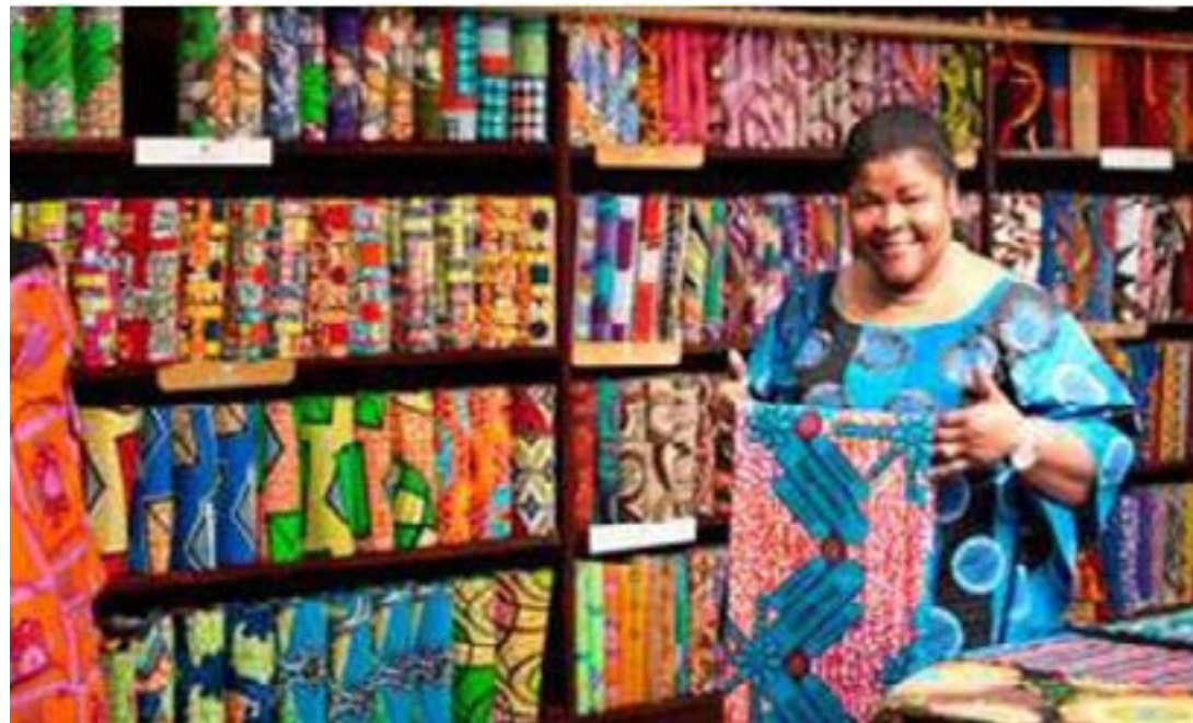
Photo d'une commerçante de pagne au grand Marché de Lomé