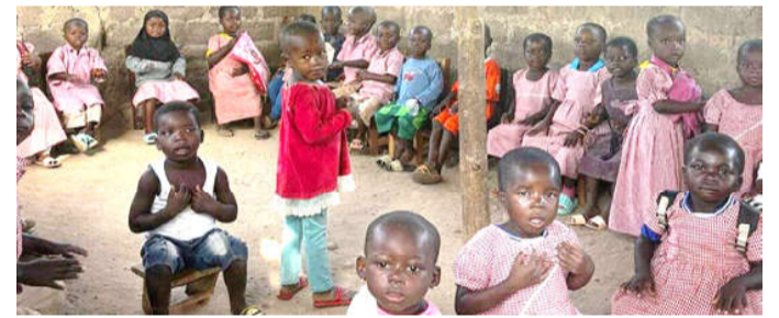
Les enfants du village de Bouladé, dans la région Centrale