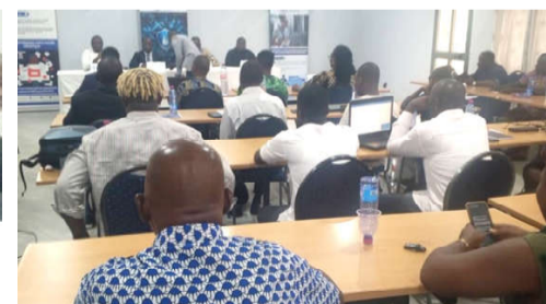
...aux journalistes à la clôture de la formation