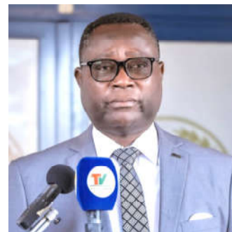
Me Kwao Ohini Sanvee, Président de la CNDH

En rappel, première institution nationale des droits de l'homme en Afrique, la CNDH a été accréditée au statut A depuis 2000, puis