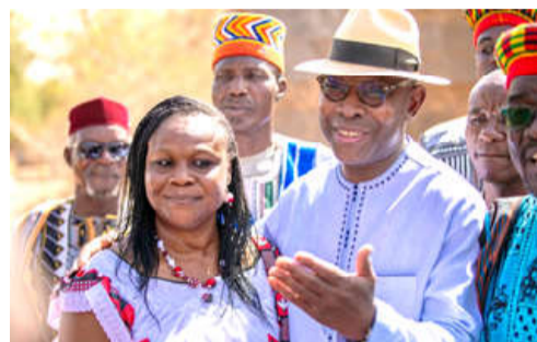
Le ministre Tchiakpè au village artisanal