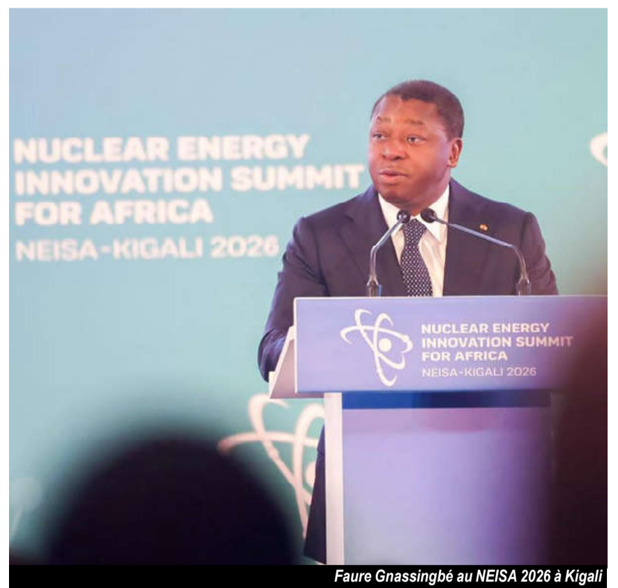
Faure Gnassingbé au NEISA 2026 à Kigali