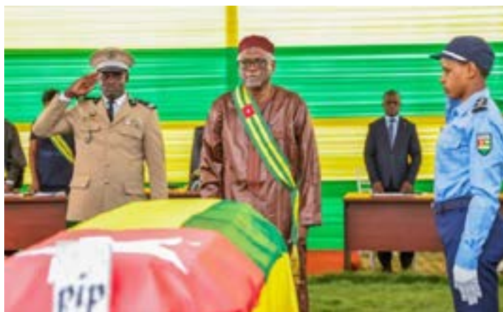
Barry Moussa Barqué, président du Sénat (au milieu), s'incline devant la dépouille