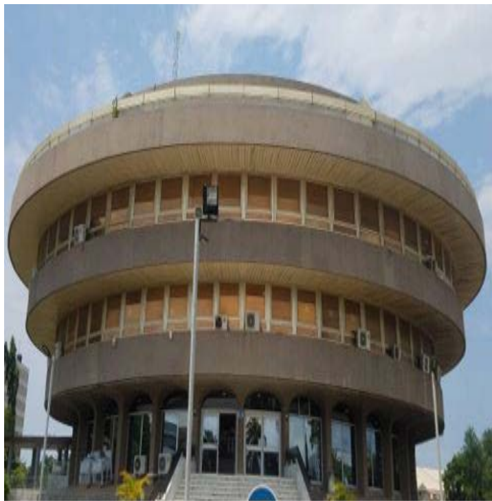
La Direction générale du Trésor et de la comptabilité publique

Orchestrée sous l'égide d'Umoa-Titres, l'opération visait d'offrir, la direction générale du Trésor et de la Comptabilité publique a