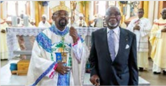
Jean-Lucien Savi de Tové (à droite) avec le nouvel archevêque de Lomé