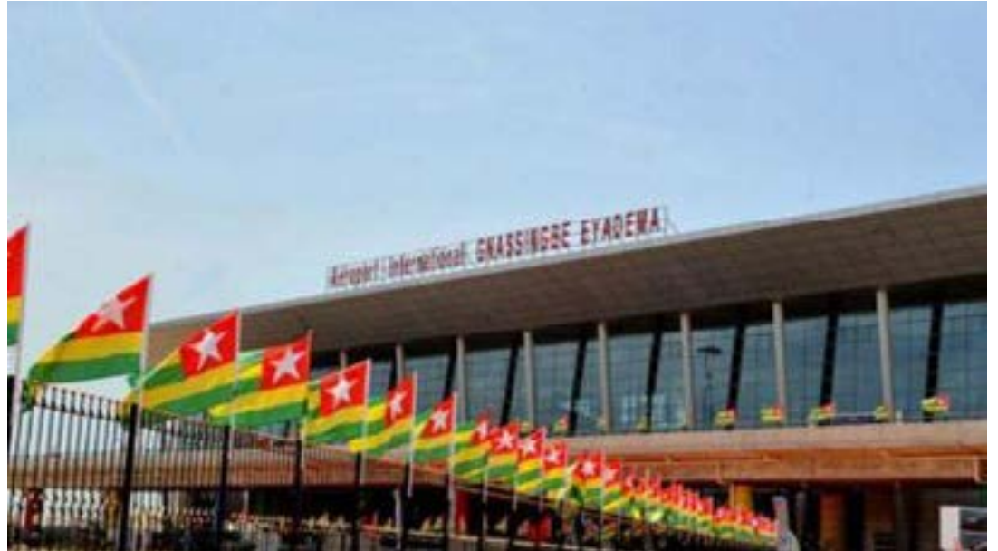
Aéroport de Lomé

Dans la foulée, les allocations budgétaires du secteur des travaux