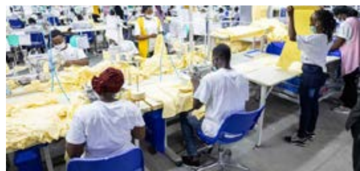
Usine textile de PIA

Dans l'espace de l'Union économique et monétaire ouest-africaine (Uemoa), plusieurs pays affichent également des performances encourageantes. Le Sénégal demeure le pays le mieux classé de l'Union avec un score de 0,6368 point. Elle est suivie par la Côte d'Ivoire (0,6173), du Bénin (0,5519) et du Togo (0,5479), qui occupe la 25e place sur 54 pays évalués. Cette position place le Togo parmi les économies industrielles intermédiaires du continent et lui permet de se situer devant plusieurs pays de la sous-région, notamment le Mali, le Burkina Faso et le Niger. Le pays bénéficie notamment de ses