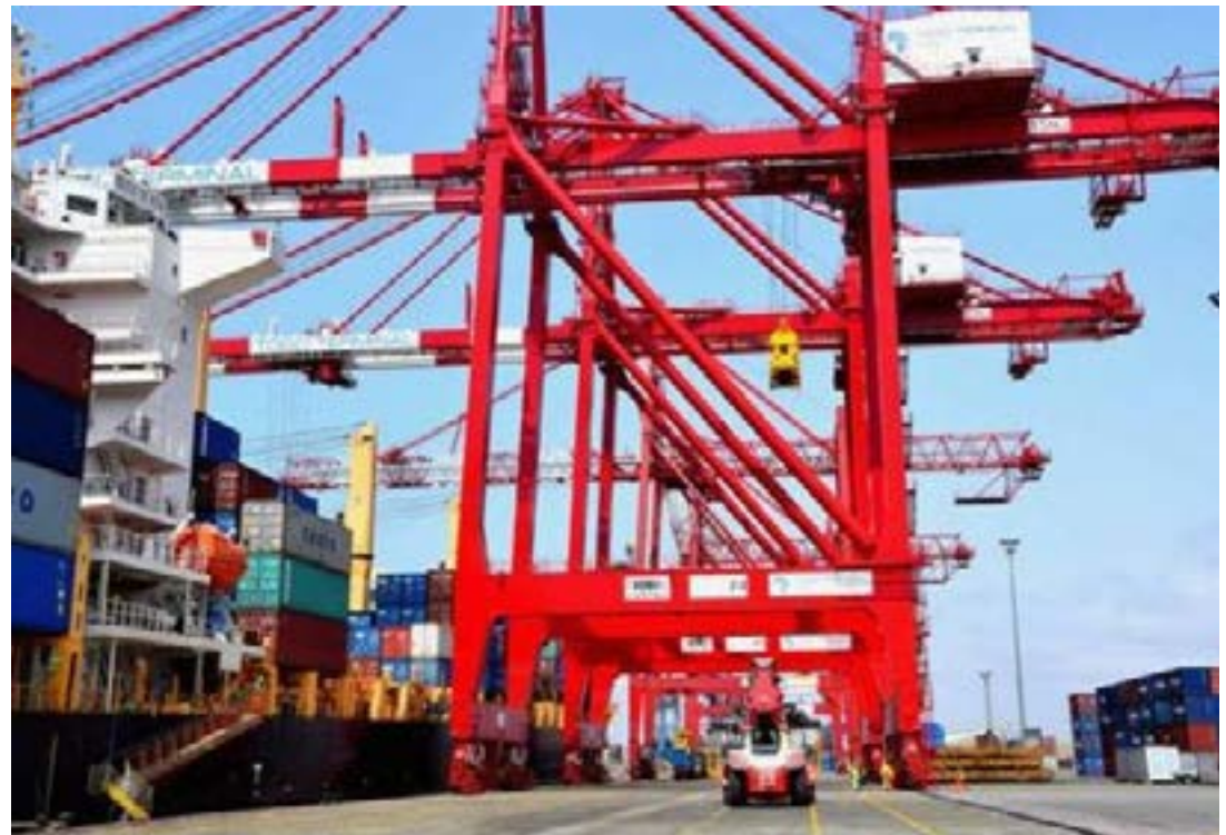
Infrastructure portuaire de Lomé

: renforcement des infrastructures sanitaires, disponibilité accrue des équipements (le gouvernement a investi près de 20 milliards de francs CFA en 2024 pour doter les formations sanitaires du pays d'équipements médicaux modernes), montée en compétence du personnel médical et paramédical, ainsi que l'amélioration de l'accès aux soins.