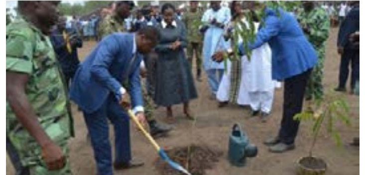
Le président du Conseil en train de planter un arbre (photo d'archives)

Ce lundi 1er juin 2026, c'est la Journée nationale de l'arbre au Togo, une tradition instaurée depuis 1977 par feu général Gnassingbé Eyadéma, ancien président de la République togolaise. Pour marquer cette journée, les autorités togolaises ont lancé en mai 2026 une campagne nationale de reboisement 2026.