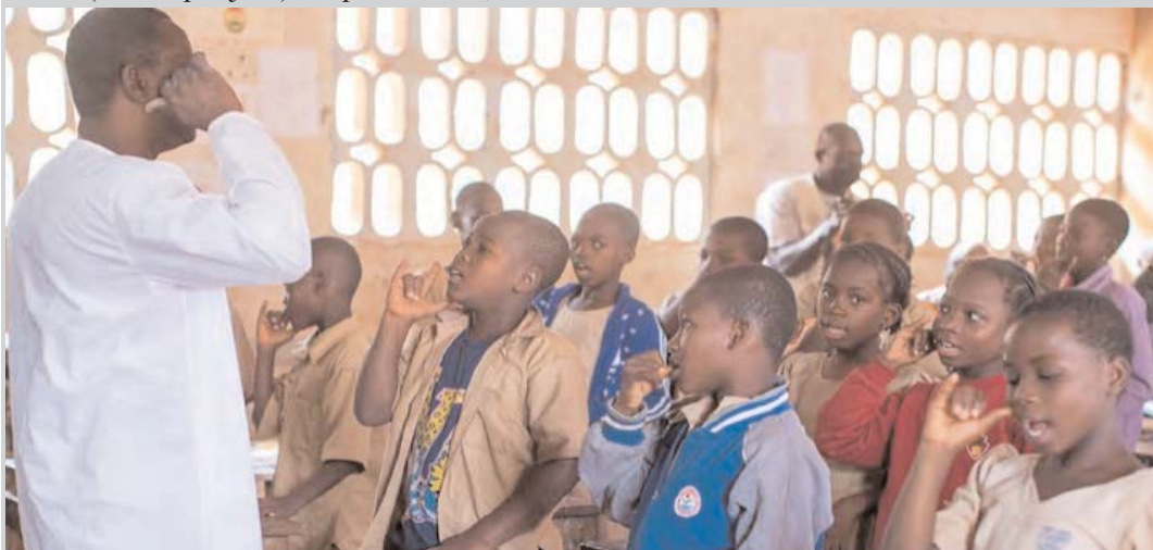
Une vue des écoliers

Le pays a également décentralisé son PNA en dotant en 2025 les cinq régions économiques du pays de leur Plan Régional d'Adaptation aux changements climatiques (PRA) dans l'optique de capturer dans son action climatique, les spécificités infranationales pour mieux renforcer résilience des communautés vulnérables.