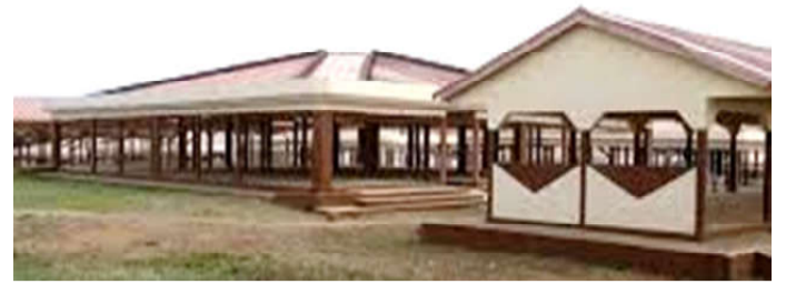
Façade du marché de Kétau

Le projet PRIMA-Togo a prévu également d'impacter 45 000 ménages ruraux (dont au moins 40% de femmes et au moins 40% de jeunes ciblés), de mettre en valeur 10