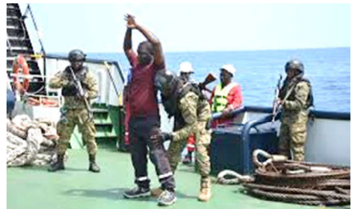
Une phase de l'exercice sur les côtes togolaises en 2025

(Préfecture maritime de l'Atlantique) – Du 1 er au 4 juin 2026, les représentants de l'Architecture de Yaoundé, des marines, garde-côtes et organisations de l'Etat en Mer des pays riverains du Golfe de Guinée ainsi que des partenaires internationaux se sont retrouvés à Brest afin de conduire la conférence principale de planification de l'exercice majeur de sûreté et sécurité maritime Grand African NEMO (GANO) 2026 qui se déroulera au deuxième semestre 2026 dans le Golfe de Guinée. Les plus de 60 participants de 21 pays ouest-africains ainsi que de 6 nations partenaires ont analysé le retour d'expérience d'opérations réelles et développé les scénarii des différentes phases de l'exercice conformément aux objectifs fixés par les autorités de l'Architecture de Yaoundé en mars dernier pour l'année 2026. Leur déplacement s'est conclu par la restitution des travaux devant le capitaine de vaisseau Emmanuel Bell Bell, directeur exécutif par intérim du Centre interrégional de coordination de l'Architecture de Yaoundé, et le contre-amiral Yann Bied-Charreton, adjoint au commandant de la zone maritime Atlantique. L'exercice annuel Grand African NEMO 26 visera ainsi à poursuivre le développement de la coopération régionale dans le domaine de la sécurité maritime avec, en particulier, la volonté de poursuivre l'ouverture de l'exercice à de nouveaux partenaires. L'adjoint au