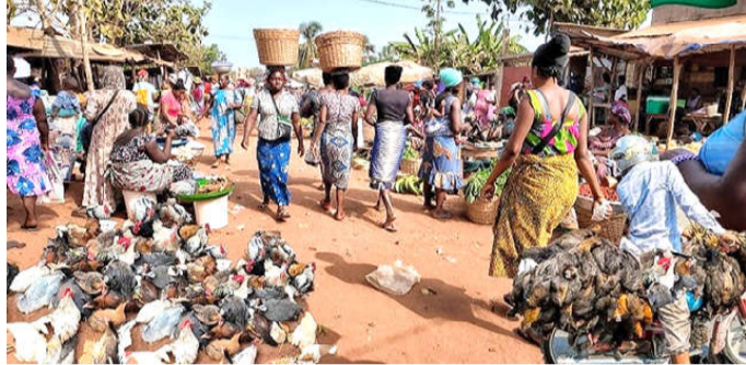
Animation au marché de Notsè

Dans le cadre de cette réhabilitation, le ministère de l'agriculture, de la pêche, des ressources animales et de la souveraineté alimentaire est en train de recruter un cabinet pour la surveillance et le contrôle des travaux de réhabilitation de 205 km de pistes rurales au sein des corridors sud, centre-sud, centre et nord autour des marchés de Notsè, Aniè, Kaboli, Kétau et Gando, ainsi que des petits ouvrages connexes. La réhabilitation des pistes rurales dans ce cas précis va contribuer non seulement à faciliter le déplacement des producteurs pour rallier leurs domiciles à leurs zones d'exploitation, mais aussi le transport des produits