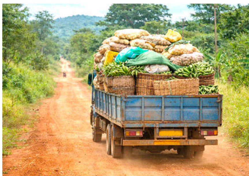
Une piste rurale qui désenclave les produits agricoles