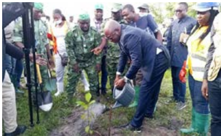
Le professeur Dodzi Komla Kokoroko, ministre de l'Environnement, le 1er juin 2026 à Aképé, préfecture de l'Avé

milliard de plants d'ici 2030 afin de faire passer la couverture forestière nationale de 24,24% à 26%. Pour atteindre cette cible, le pays doit produire et planter environ 100 millions de plants chaque année sur près de 67 000 hectares. Un défi immense qui nécessite la mobilisation de l'ensemble de la population. Les autorités insistent notamment sur la nécessité de changer certaines pratiques qui accélèrent la disparition des forêts.