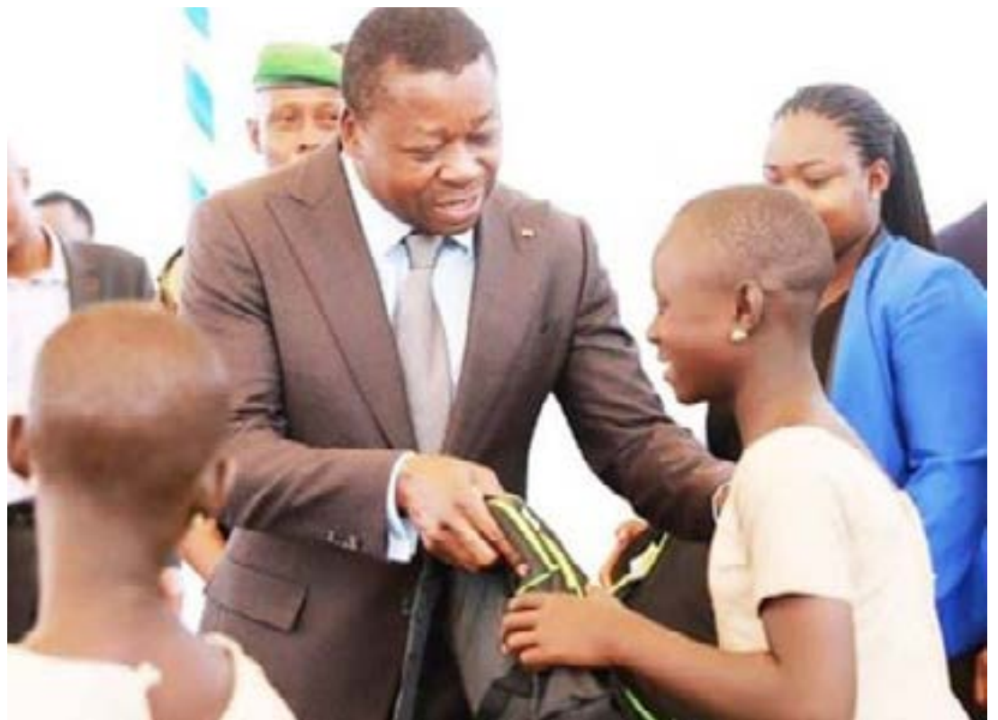
Le président du Conseil remettant des kits scolaires aux élèves

vont être consacrés aux programmes et projets du sous-secteur de l'enseignement préscolaire et primaire, 64 milliards de francs à l'enseignement secondaire général et 14 milliards de francs CFA à l'enseignement technique