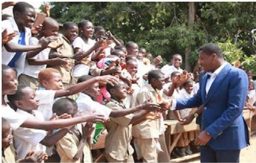
Le président du Conseil saluant les élèves

Elles sont conçues dans le cadre de la Feuille de route gouvernementale. Dans le même élan, les réformes engagées ces dernières années pour rapprocher le système éducatif du monde professionnel trouvent ici une traduction concrète. Le décret du 14 octobre 2025 vient consolider cette orientation en facilitant les passerelles entre les différents parcours, permettant aux jeunes de construire des trajectoires plus souples