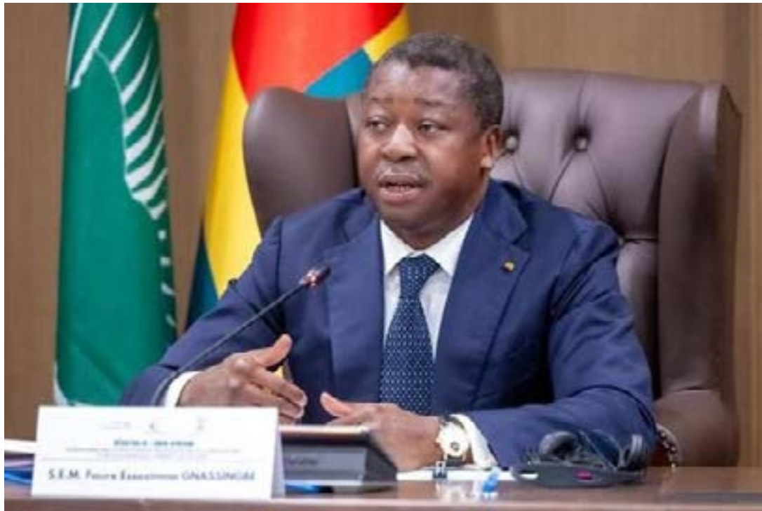
Faure Gnassingbé

Cette importante rencontre a réuni autour de la médiation togolaise, les membres du collège des facilitateurs désignés par l'Union africaine, des représentants des Nations unies, de la Communauté d'Afrique de l'Est (CAE), de la Communauté économique des États de l'Afrique centrale (CEAC), de la Communauté de développement de l'Afrique australe (SADC), de la Conférence internationale sur la région des Grands Lacs (CIRGL) et du Comité international de la Croix-Rouge (CICR). Faure Gnassingbé a salué la