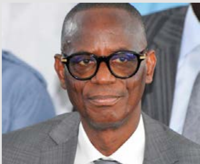
Badanam Patoki, ministre de l'Économie et de la Veille stratégique

Ces résultats dépassent les anticipations des partenaires multilatéraux. La Banque mondiale tablait sur une croissance de 5,0