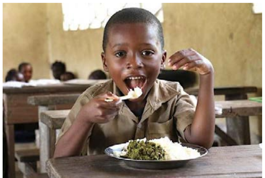
Un élève bénéficiaire de la cantine scolaire

Certes, des défis subsistent, notamment en matière d'infrastructures,