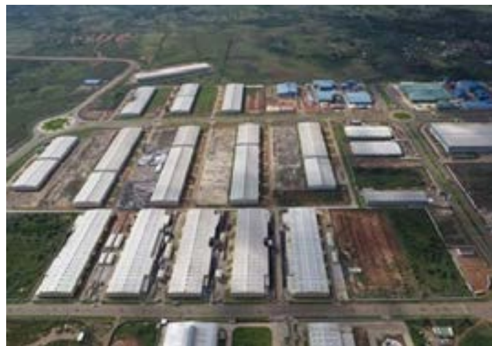
ZES de Glodjigbé au Bénin

francs ou encore les zones franches agricoles. Grâce à des procédures simplifiées, des avantages fiscaux et des règles d'investissement plus souples, elles visent à attirer les capitaux, stimuler la production et favoriser le transfert de technologies. Leur expansion sur le continent