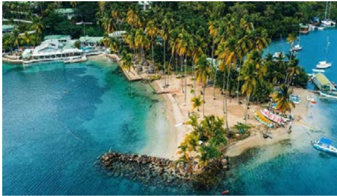
L'élévation du niveau de la mer menace l'industrie du tourisme dans des endroits comme Sainte-Lucie, dans les Caraïbes

Quelque 550 experts issus de 86 pays ont consacré près de cinq ans à l'élaboration d'un rapport d'évaluation de 1 600 pages détaillant les défis auxquels l'océan est confronté. Ce document scientifique fournit les connaissances nécessaires à l'humanité pour protéger et préserver la planète. Baptisé « World Ocean Assessment » (Évaluation mondiale des océans), ce rapport révèle un certain nombre d'éléments. D'abord, l'océan façonne le quotidien de chacun, même pour ceux qui ne vivent pas dans des zones côtières. Ensuite, il stabilise le climat en absorbant la majeure partie de l'excès de chaleur de la planète ainsi que les gaz à effet de serre nocifs ; sans son effet régulateur, il faut s'attendre à des phénomènes météorologiques plus extrêmes, menaçant les systèmes alimentaires, les chaînes d'approvisionnement et les marchés de l'assurance. Enfin, l'océan constitue une source d'alimentation. Lorsque les stocks de poissons s'effondrent ou que les chaînes d'approvisionnement sont rompues en raison