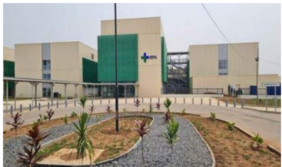
Hôpital de référence Dogta-Lafié (Image illustrative)

Ces derniers sont relatifs à l'inadéquation entre l'éducation et les besoins du marché de l'emploi, les disparités régionales d'accès aux services de santé, et l'insertion professionnelle des jeunes particulièrement dans les