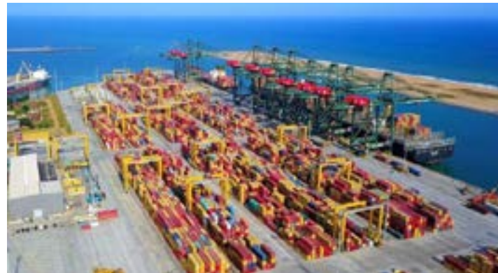
Port de Lomé

temps d'attente des navires. À l'inverse, les plateformes dominées par les flux d'importation font souvent