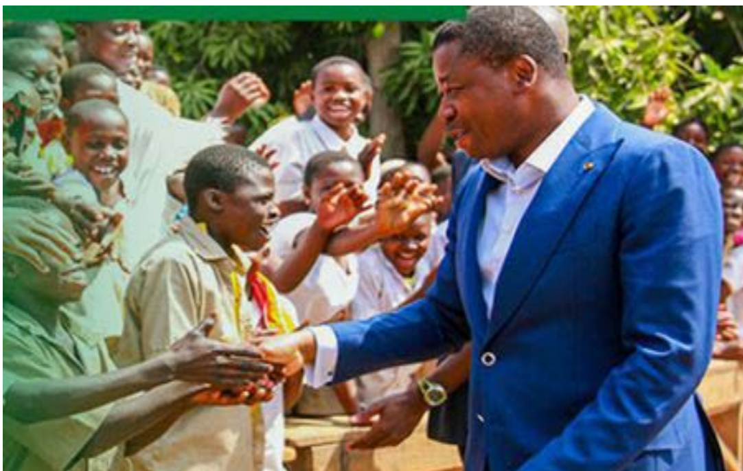
Le président du Conseil avec les élèves

Dans la foulée, le taux de chômage au Togo a également amorcé une baisse. Il est passé de 6,5 % en 2011 à 3,4 % en 2015