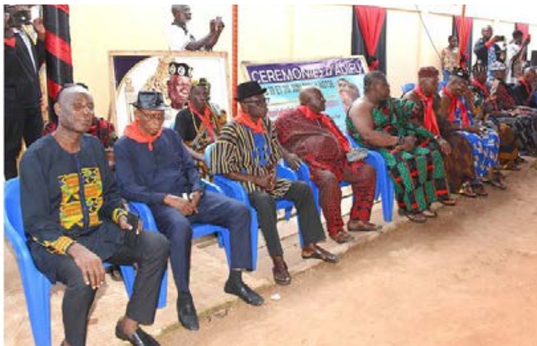
Vue partielle des personnalités présentes

Dans une atmosphère de recueillement, les populations ont entamé plusieurs jours d'hommages destinés à honorer la mémoire de leur roi, décédé le 4 février 2026 à l'âge de 86 ans, après 35 années passées sur le trône royal.