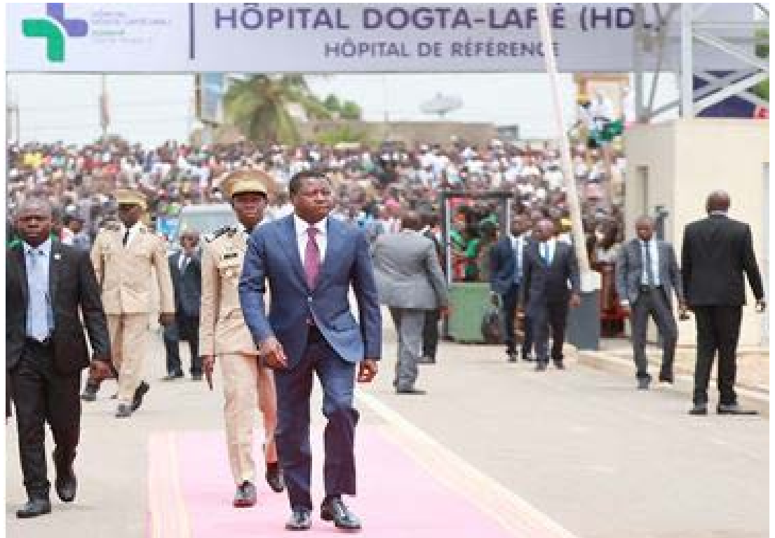
Le président du Conseil à l'inauguration de Dogta-Lafié

Cependant, malgré les avancées, la promotion du capital humain au Togo