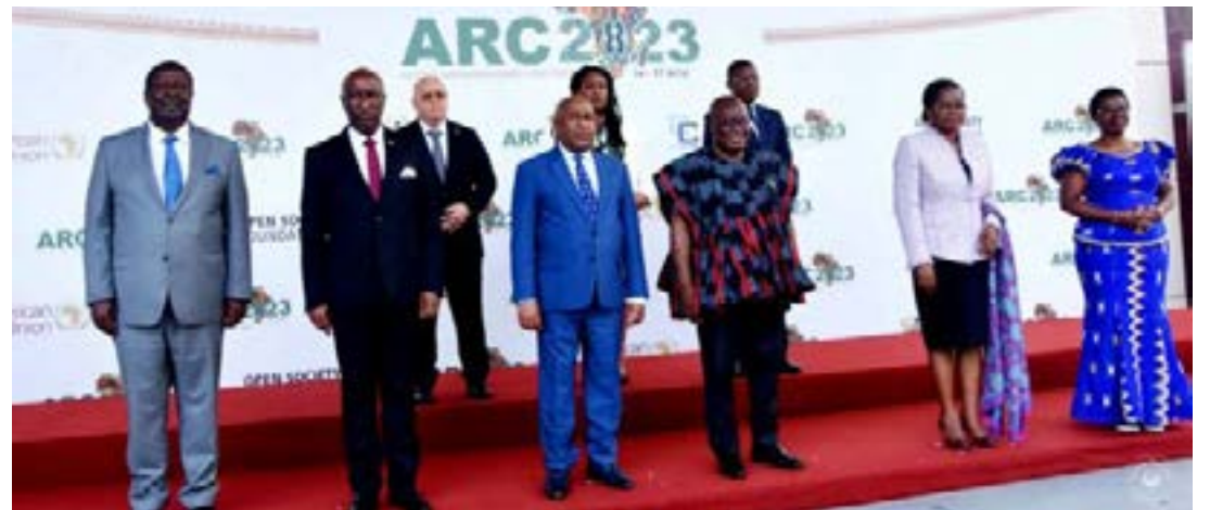
Photo archive du sommet d'Accra

de la zone UEMOA à propos de la monnaie coloniale CFA encore en vigueur ? Nos dirigeants se rappellent-ils la cause de la « vitrification » du régime de Laurent Gbagbo en 2010 en Côte d'Ivoire par Nicolas Sarkozy alors Président de la République française ? Pourquoi avec ses 54 Etats et près d'1,5 milliard d'âmes vivantes, l'Afrique ne dispose-t-elle pas de place au Conseil de Sécurité des