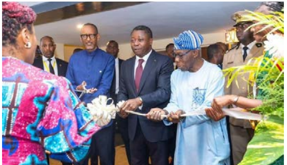
Faure Gnassingbé (au milieu), et ses hôtes

« Je continue de penser que nous devons aller au-delà des discussions sur ce qui devrait être fait et nous concentrer davantage sur ce qui doit réellement