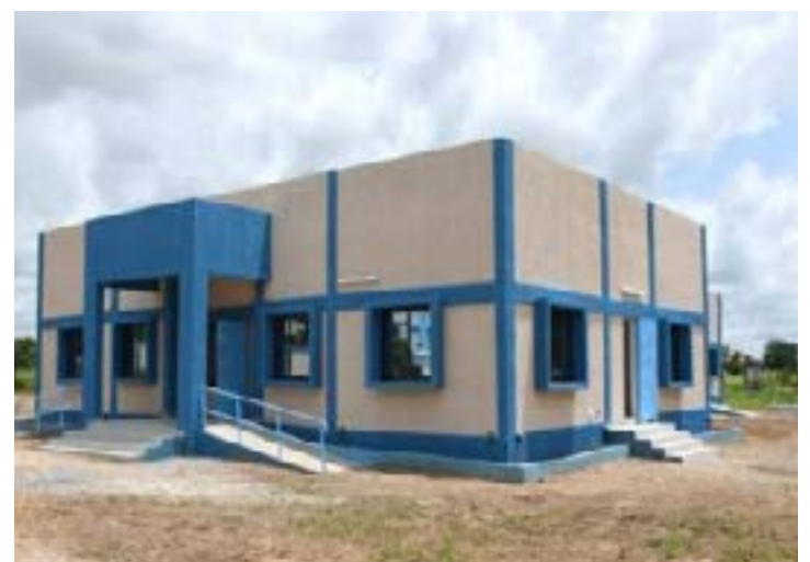
Structure sanitaire réalisée par le gouvernement

Cette stratégie permet de combler les classes vacantes, de réduire le ratio élèves-enseignants, facteur essentiel pour améliorer l'attention et l'accompagnement