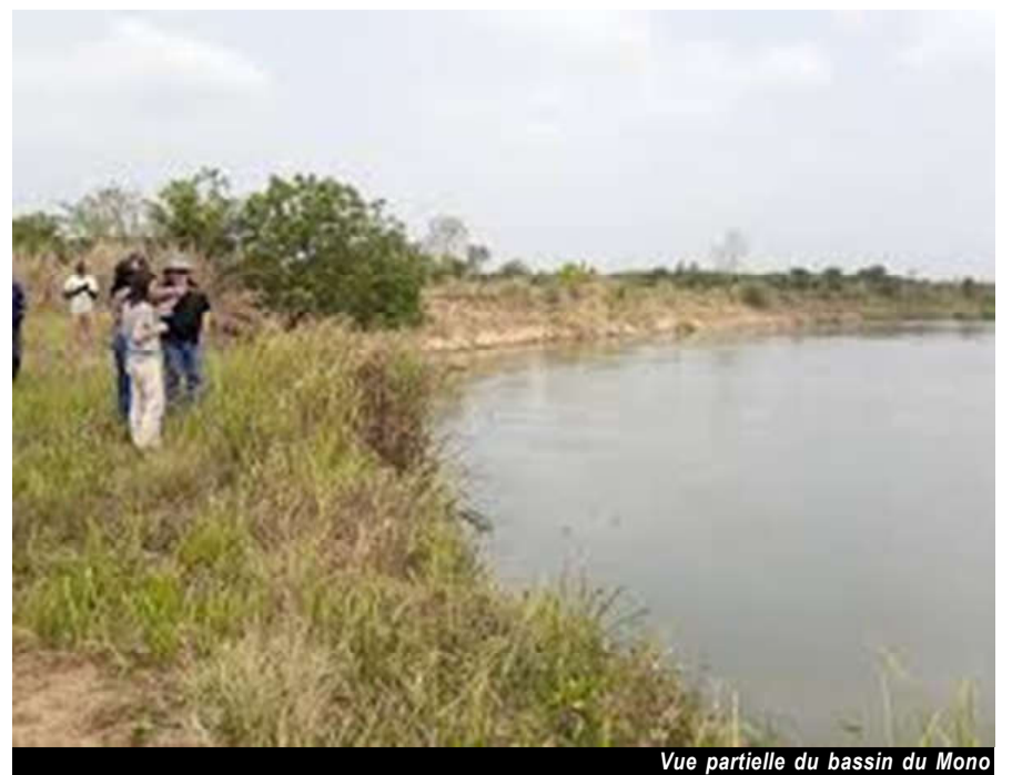
Vue partielle du bassin du Mono