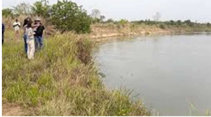
Vue partielle du bassin du Mono

Il y a deux sous-projets pilotes climato-résilients pour répondre à des soucis récurrents relevés lors de l'état des lieux sommaire du bassin réalisé en 2014 : pour le Togo, protéger les versants montagneux de l'Amou par l'approche "solutions fondées sur la nature" ; pour le Bénin, lutter contre la prolifération des plantes aquatiques envahissantes