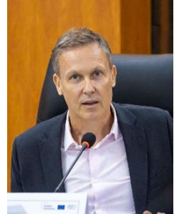
Gwilym Ceri Jones, Ambassadeur de l'UE

L'instauration de ce mécanisme permanent de concertation, appelé à se réunir deux fois par an, témoigne de l'engagement commun des