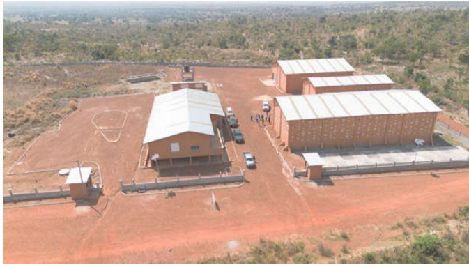
Le projet d'agropole de Kara, une priorité du gouvernement

Ça a traîné parce qu'il a fallu ouvrir les offres le 20 août 2025, avant d'attendre la réception par la Banque du rapport d'évaluation des offres, le 8 décembre suivant, et l'approbation par la Banque de l'évaluation qui a été faite le 3 juin 2026. Par exemple, les soumissionnaires togolais ont été recalés parce que le chiffre d'affaires annuel moyen du groupement n'est pas recevable ; l'accord de groupement ne spécifie pas les parts de chaque membre du groupement ; le groupement n'a pas présenté des expériences dans la gestion des risques et des aspects environnementaux et sociaux ; le soumissionnaire a présenté une liste de personnel non conforme aux exigences (l'ingénieur hydraulicien, l'environnementaliste, le conducteur des travaux de génie civil (bâtiments), le topographe (bâtiments), le sociologue (bâtiments) n'ont pas le nombre d'année d'expérience global en