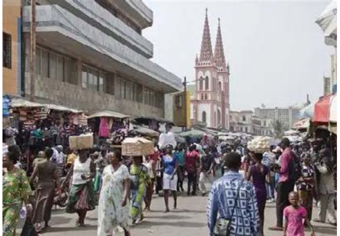
Le Grand marché de Lomé

d'accompagnement des entreprises telles que l'Agence nationale de promotion et de garantie de financement des PME/PMI (ANPGF) et de l'Agence de développement des Très petites et moyennes