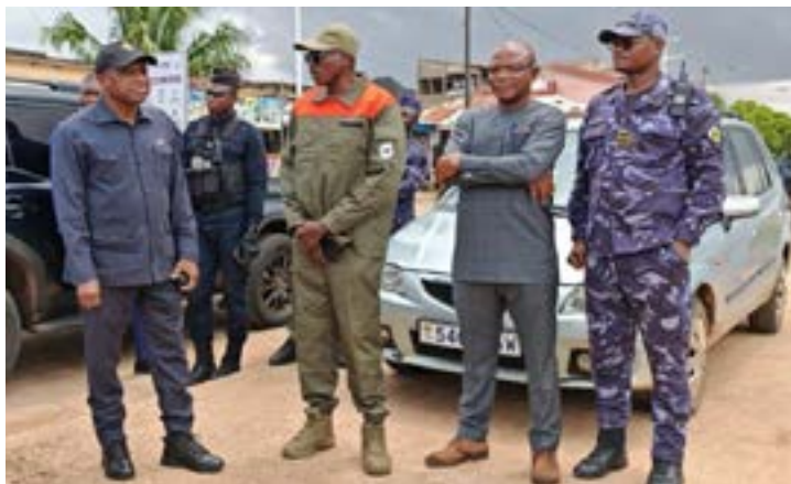
Col Calixte Madjoulba (gauche), ministre de la sécurité sur le terrain avec ses équipes réfléchissant aux solutions

Le déclenchement du plan ORSEC permet de mobiliser l'ensemble des acteurs de la Plateforme nationale de réduction des risques de catastrophes (PNRRC), sous la coordination opérationnelle de l'Agence nationale de la protection civile (ANPC). Les équipes