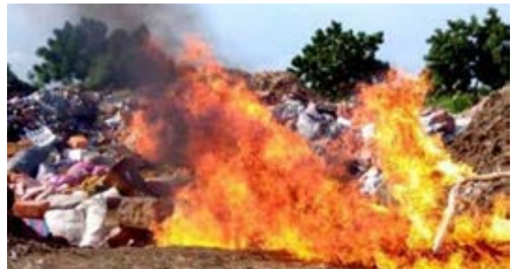
Destruction des stupéfiants saisis par les autorités

Afin de limiter ces risques, le pays a renforcé ces dernières années ses capacités de contrôle aux frontières et dans les principaux points stratégiques. Notamment