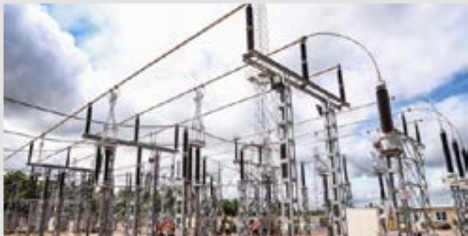
Des installations électriques

D'après le ministère de l'Énergie et des Ressources minières, les sources nationales de production ont couvert 53,3 % des besoins en énergie électrique injectée dans le réseau de la Compagnie énergie électrique du Togo (CEET) en 2024, soit 1 113,22 Gigawattheure (GWh), représentant plus de la moitié de l'approvisionnement global.