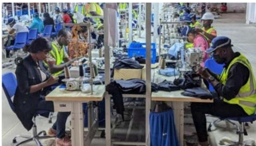
L'usine textile de la PIA

l'industrie, l'une des stratégies adoptées par les autorités togolaises est le renforcement du Partenariat public privé (PPP). Grâce à ce