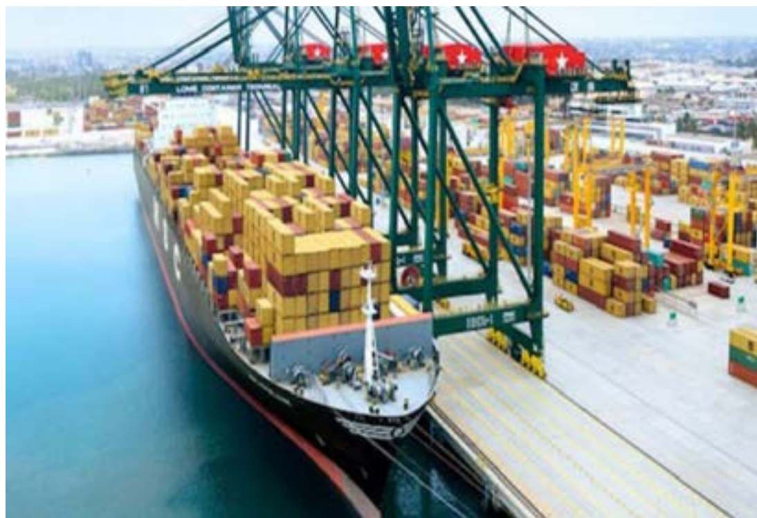
Le port autonome de Lomé

La pertinence d'une telle orientation repose sur un constat simple : une croissance soutenue ne produit des effets durables que si elle est accompagnée d'une structuration solide des secteurs qui la génèrent. En renforçant les mécanismes de