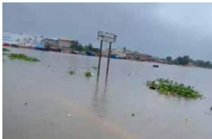
Les rues inondées

vulnérables. Les usagers de la route signalent des situations de blocage total au carrefour Agoè, ainsi que dans les zones de Bè Gendarmerie, d'Akodesséwa et d'Adidogomé. Les forces de sécurité recommandent d'éviter absolument les déplacements non essentiels durant les pics de précipitations, notamment en début d'après-midi où