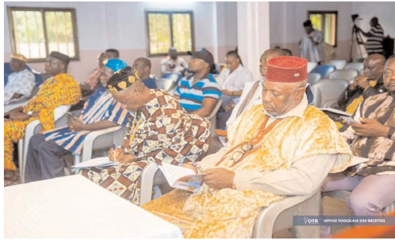
Une vue de l'assistance

La troisième journée a conduit la délégation à Wawa, précisément à Badou, où les discussions ont permis d'aborder, sans détour, les diffi-