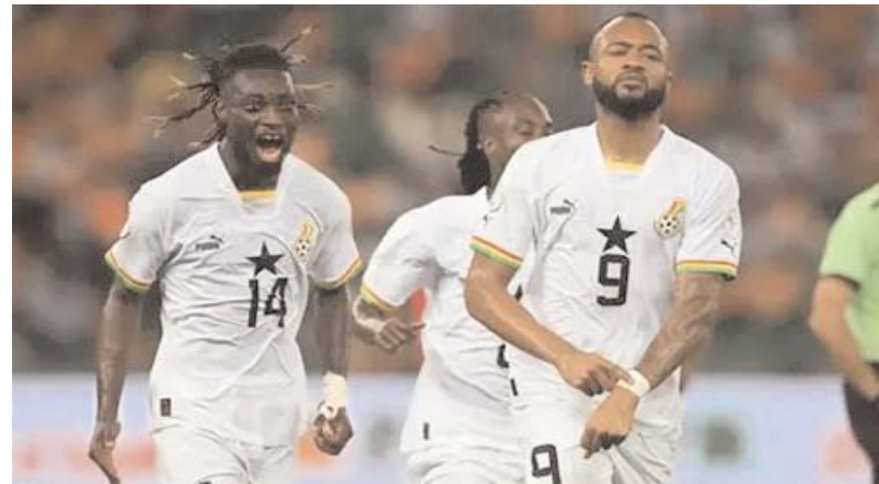
Les Blacks Stars de retour sur terre

Un autre point ressort : le manque d'automatismes. Carlos Queiroz a récemment pris le poste d'entraîneur. Il doit encore