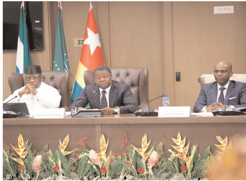
Les officiels lors de la rencontre

" La crise au Moyen-Orient ne peut être regardée par l'Afrique comme une crise lointaine. Elle nous concerne directement. Elle concerne nos économies. Elle concerne notre sécurité. Elle concerne notre résilience. Elle concerne surtout notre capacité