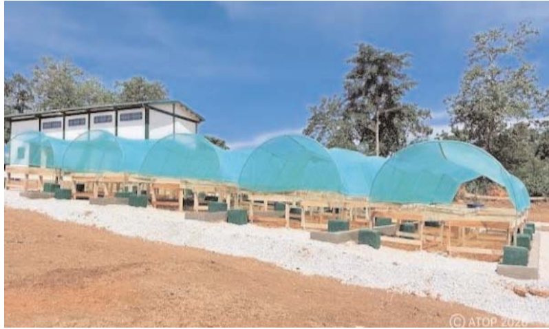
Vue partielle du centre d'excellence de traitement de cacao à Abrewankor (Pref Wawa)

En effet, pour les autorités togolaises, la relance des filières café et cacao repose aujourd'hui sur une