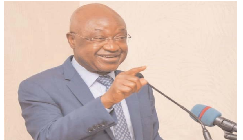
Le ministre George Barcola

Les autorités rassurent qu'avec ce reclassement le Togo reste, à court terme, éligible aux ressources de l'IDA, le guichet de la Banque mondiale qui prête à des conditions très douces aux pays modestes, ainsi qu'au Fonds africain de développement, le guichet concessionnel de la Banque africaine de développement (BAD). L'éligibilité à ces guichets ne dépend pas que de la catégorie de revenu, mais d'un seuil spécifique de RNB par habitant et de la capacité du pays à emprunter aux conditions de marché. " La transition, quand elle intervient, est progressive et