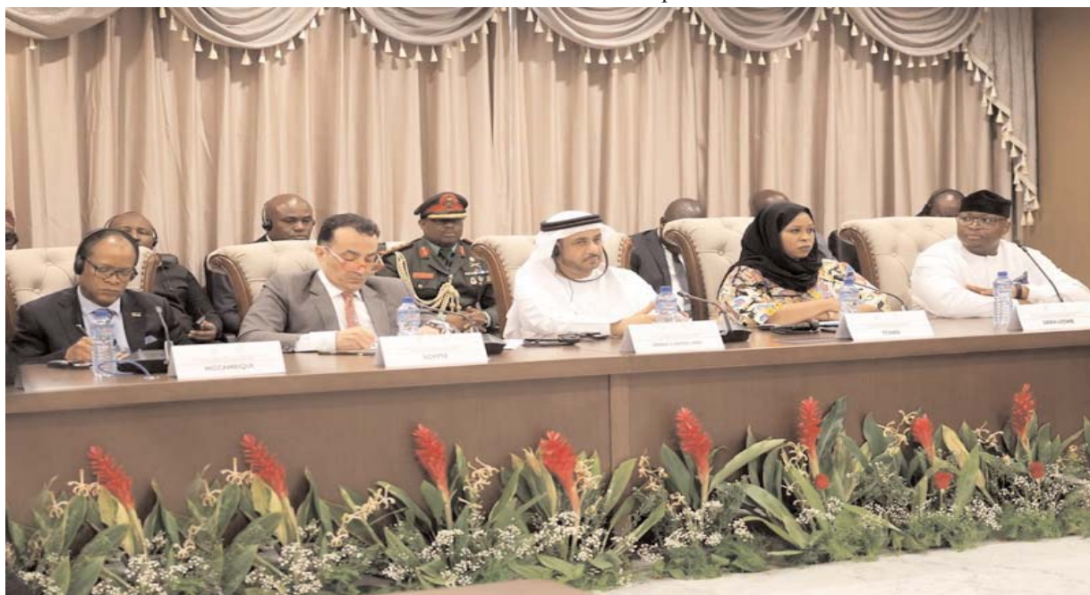
Une vue de l'assistance

Au terme des travaux, la conférence permettra de développer une compréhension partagée des implications économiques, sécuritaires et stratégiques de la crise du Moyen-Orient pour l'Afrique, ainsi que pour la stabilité régionale et internationale. Elle contribuera également à définir des orientations stratégiques visant à renforcer la résilience du continent face aux évolutions de l'environnement international et à dégager des convergences en faveur de la paix, de la désescalade, du dialogue et de la stabilité régionale.