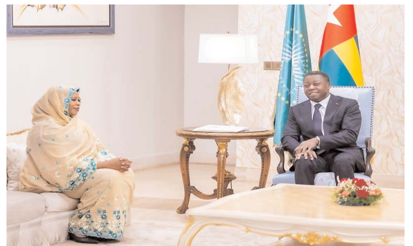
Une vue de l'audience

" Nous sommes porteurs d'un message personnel du Président