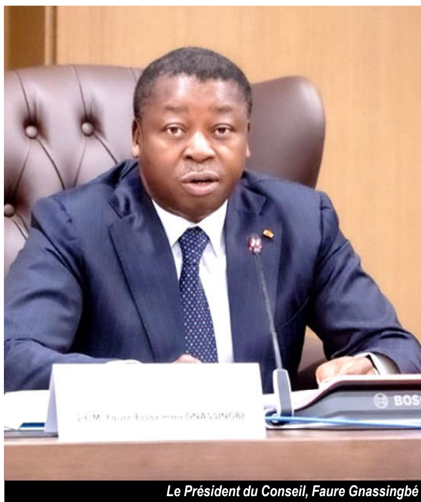
Le Président du Conseil, Faure Gnassingbé