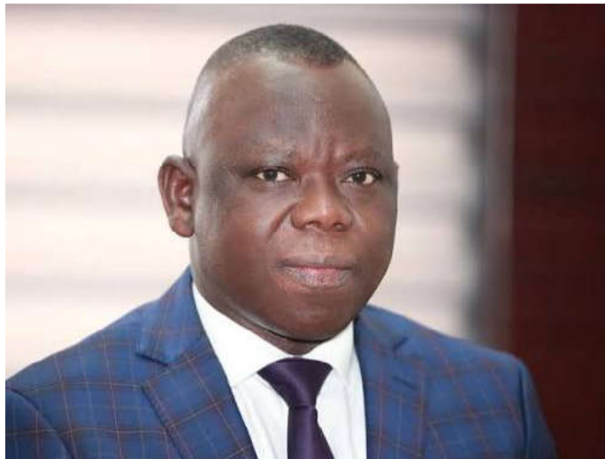
Jean-Marie TESSI, Ministre de la Santé, de l'Hygiène publique, de la Couverture Sanitaire Universelle et des Assurances

lisation des ressources domestiques demeure insuffisante, constituant un défi majeur pour la soutenabilité du financement du secteur de la santé et la consolidation des acquis liés à la mise en œuvre de l'axe 5. Par rapport au développement de mécanismes performants d'achat des prestations de soins, l'indicateur des dépenses de santé des ménages par paiement direct en pourcentage de la dépense courante de santé reste élevé malgré la régression de 2021 à 2023. Et bien qu'on note une progression de l'indicateur sur l'assurance sociale/obligatoire en pourcentage des dépenses courantes de santé en 2023, cet indicateur reste toujours faible.