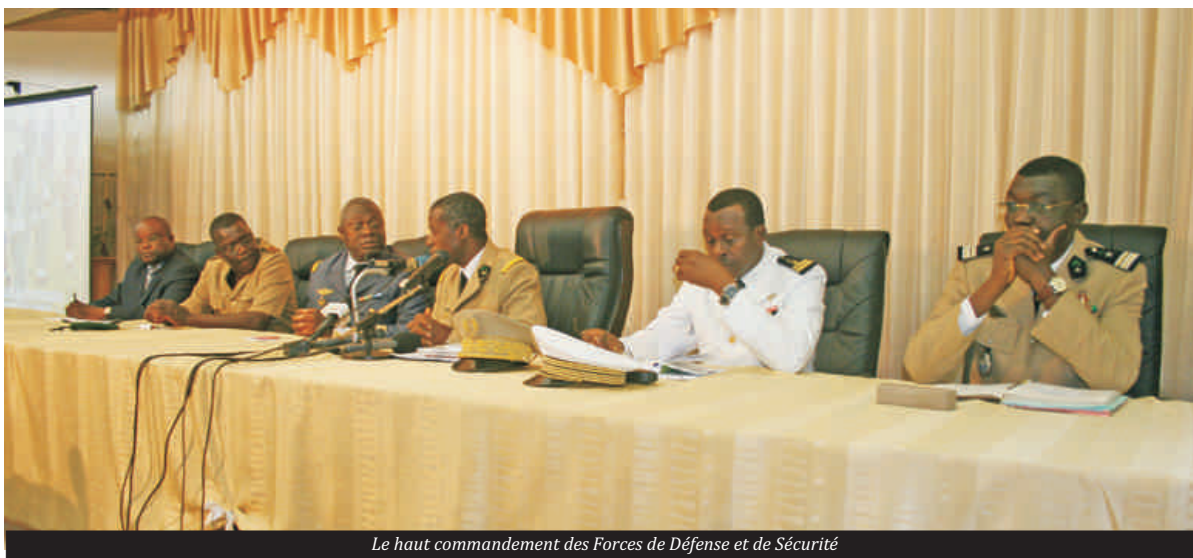
Le haut commandement des Forces de Défense et de Sécurité

Au cours de sa conférence de presse introductive de ces Journées qui a eu lieu hier mardi à la grande salle de cinéma de l'Etat Major des FAT, la haute hiérarchie militaire et de sécurité a invité la presse togolaise et internationale à accompagner cet événement, premier du genre dans la vie de cette institution, qui vise à mieux faire connaître l'armée, à susciter des vocations et surtout au rapprochement de l'Armée et des populations en vue du renforcement de la réconciliation et du développement harmonieux du Togo dans l'intérêt de tous ses fils et