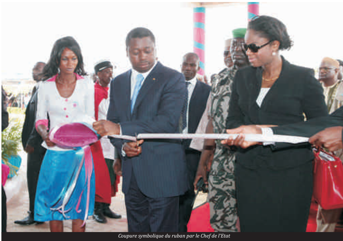
Coupure symbolique du ruban par le Chef de l'Etat

Grande bâtisse à 8 niveaux avec une capacité de 129 bureaux 7 salles de réunions un rez de chaussée doté d'un grand hall et que sais-je encore... le tout sur une superficie de 2hectares situé dans le quartier Tokoin ATCHANTE connu depuis quelques années sous le nom de grand carrefour GTA, voila brièvement présenté le nouveau siège de la société de téléphonie fixe TOGOTELECOM. La coupure du ruban symbolique marquant l'inauguration du joyau a été effectuée par le chef de l'Etat Faure GNASSINGBE au lendemain du gigantesque défilé civil et militaire marquant les 51 ans de l'accession du Togo à la souveraineté internationale. Pour ce qui est de la genèse de ce nouveau siège, il faut remonter au 2 mai 2003 pour voir les premiers coup de pioches marquant le début des travaux.. Un investissement de près de trois milliards de francs CFA et sept ans après, c'est un ensemble architectural répondant à une volonté d'amélioration et d'innovation pour un meilleur rendement, qui surplombe les environs de la nouvelle présidence de la république. De l'intérieur, le visiteur est sans doute