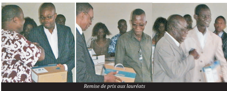
Remise de prix aux lauréats

Ils étaient six journalistes des plus heureux cette après midi du 3 mai à la Maison de la Presse. Des prix composés d'ordinateurs